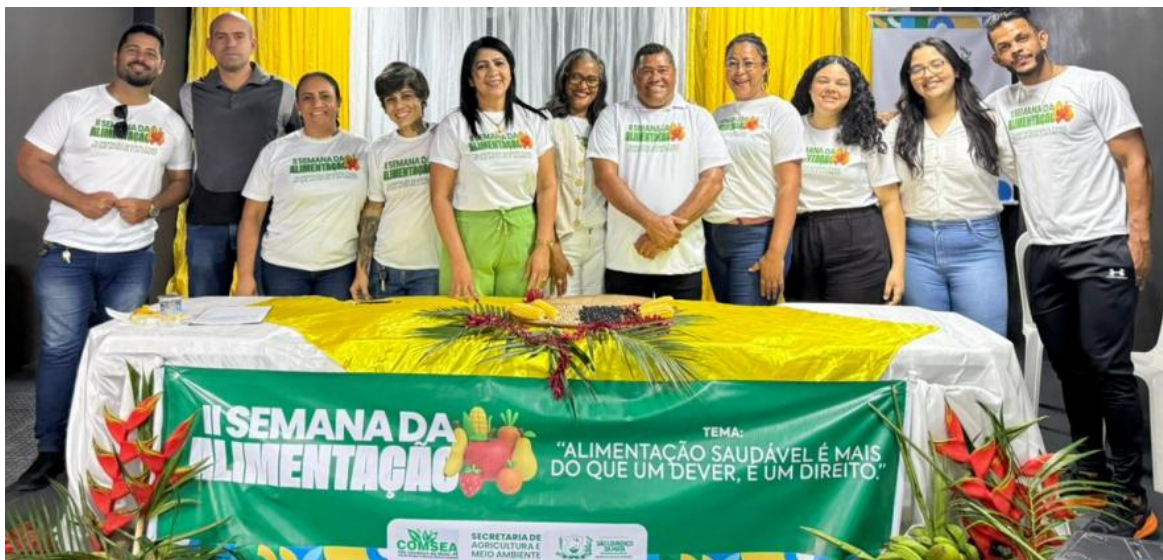
Figura 3: II Semana da Alimentação, realizado em outubro.