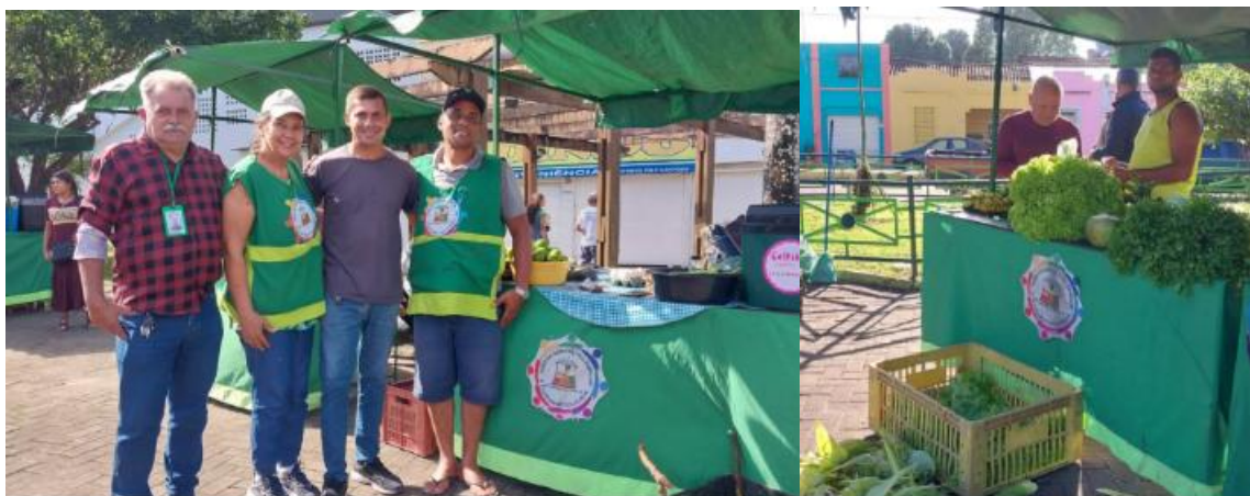
Figura 8: Produtores em dia de feira da agricultura familiar expondo seus produtos para comercialização.

mesmo como clientes assíduos, reforçando assim que não basta apenas divulgar as ações, mas ser atuante.