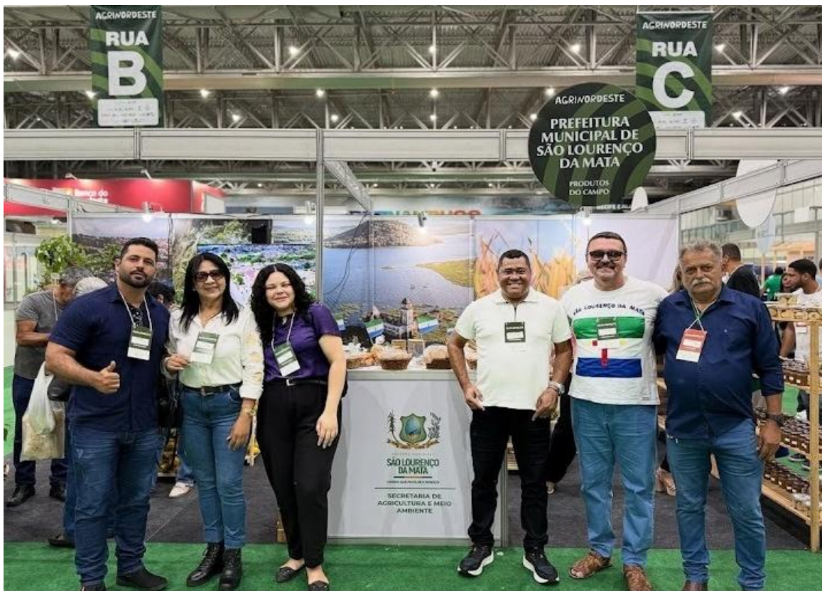
Figura 5: Presença da Equipe técnica da SAMA na 32ª Agrinordeste realizada em setembro.