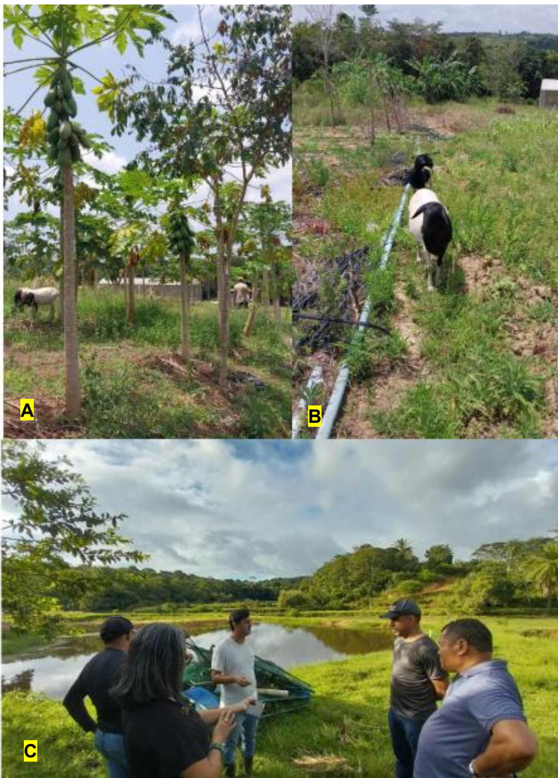
Figura 9: Vistoria em áreas de produções agropecuárias: AB - área de produção de mamoeiro e atualização cadastral de produtores de caprinos; C - Dimensionamento e atualização cadastral de criador de piscicultura.