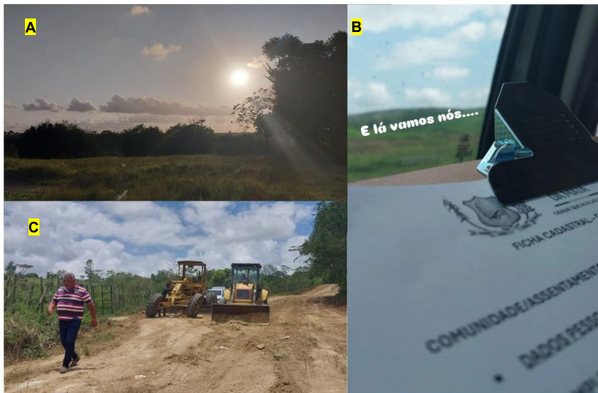
Figura 7: Vistoria em áreas de produções agrícolas: A - área de assentado a ser mecanizada; B - Cadastro do Assentado; C - Maquinário em atuação no programa Terra Pronta.