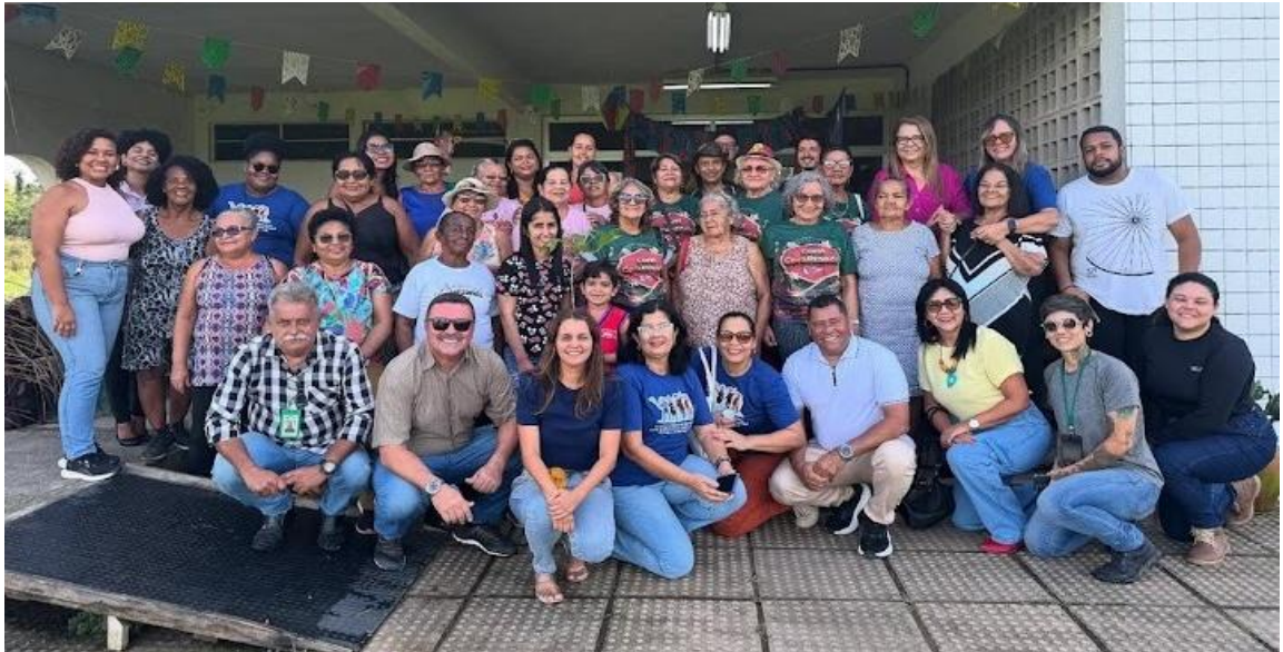
Figura 6: Evento realizado no CODAI-Tiúma em parceria com o Centro de Convivência da Terceira Idade.