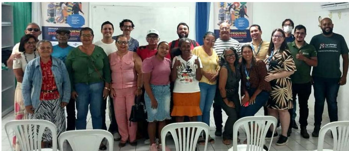
Figura 4: Palestra destinada aos agricultores familiares e representantes de cooperativa, sobre Organização financeira e análise de crédito.