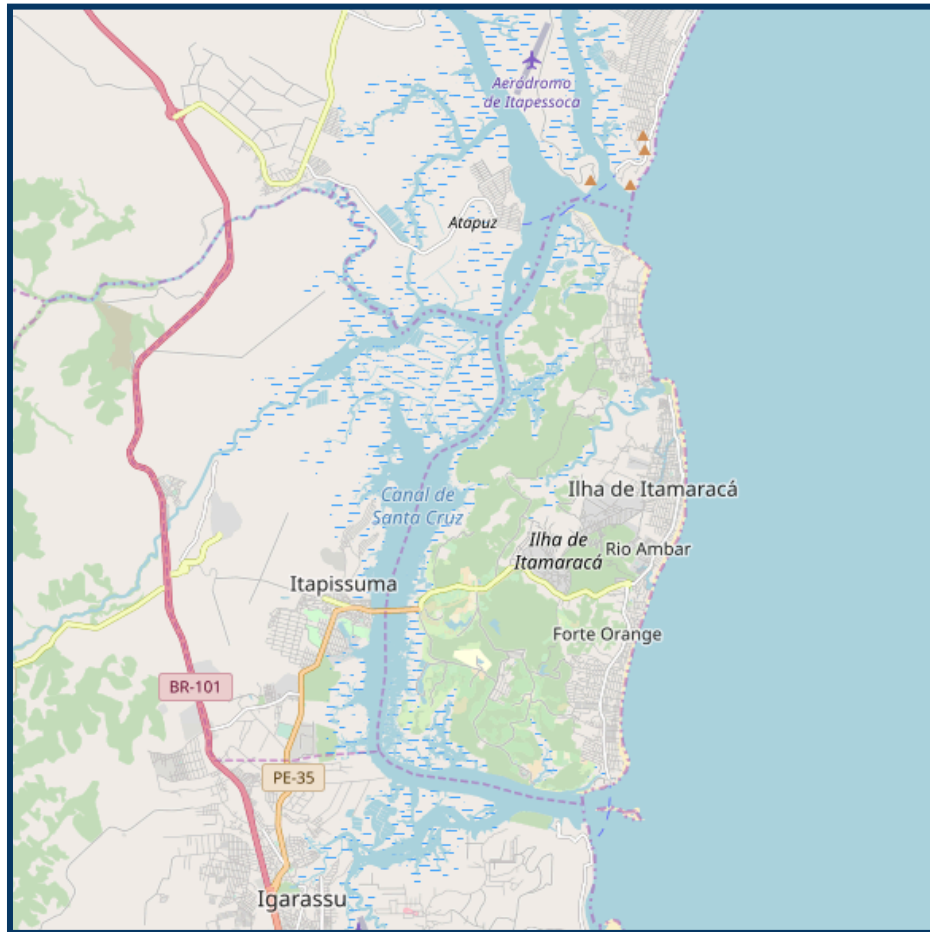
Figura 1 - Mapa do Canal de Santa Cruz