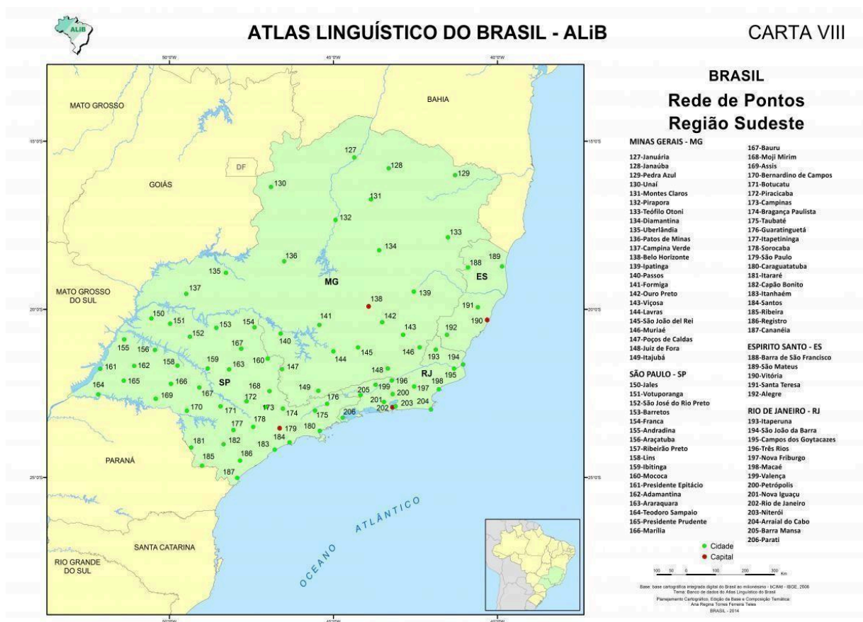
Figura 1: Carta VII - Rede de pontos (Região Sudeste)

de pontos do Projeto Atlas Linguístico do Brasil (ALiB), referente aos pontos 150 a 187, de acordo com a Carta VII (Cardoso et al , 2014), apresentada a seguir, os quais são referentes aos municípios de Jales, Votuporanga, São José do Rio Preto, Barretos, Franca, Andradina, Araçatuba, Ribeirão Preto, Lins, Ibitinga, Mococa, Presidente Epitácio, Adamantina, Araraquara, Teodoro Sampaio, Presidente Prudente, Marília, Bauru, Moji Mirim, Assis, Bernardino de Campos, Botucatu, Piracicaba, Campinas, Bragança Paulista, Taubaté, Guaratinguetá, Itapetininga, Sorocaba, São Paulo, Caraguatatuba, Itararé, Capão Bonito, Itanhaém, Santos, Ribeira, Registro e Cananéia, pertencentes ao estado de São Paulo.