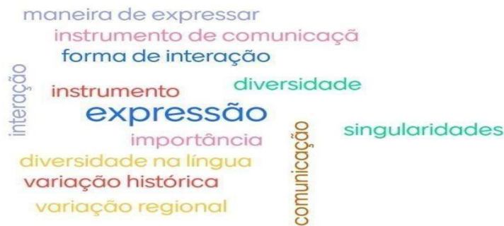
Figura 3 - Quais são as suas concepções de linguagem e de variação linguística?