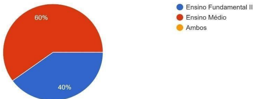
Figura 2 – Modalidade de atuação

No que corresponde às modalidades de atuação no ensino de língua portuguesa, algumas atuam no Ensino Médio e outras no Ensino Fundamental do 6º ao 9º ano, conforme explicitado na figura 2.