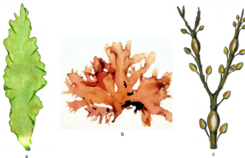
Figura 1. Representação dos três principais grupos de macroalgas em função da sua coloração: a - Macroalga verde pertencente ao filo Chlorophyta; b - Macroalga vermelha pertencente ao filo Rhodophyta; c - Macroalga marrom pertencente ao filo Ochrophyta, classe Phaeophyceae.

demonstrando um alto potencial para aplicações na indústria farmacêutica e cosmética (Prasedya et al., 2021). Além disso, avanços recentes indicam que diferentes espécies de macroalgas podem ser utilizadas na produção de biocombustíveis, reforçando seu papel como matéria-prima sustentável (Aparicio et al., 2020).