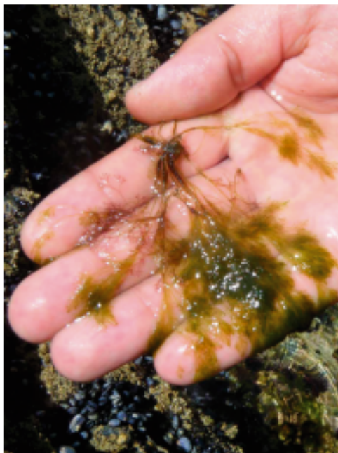
Figura 2. Macroalga da espécie Bryopsis plumosa imagem adaptada de LEONEL PEREIRA (2009).