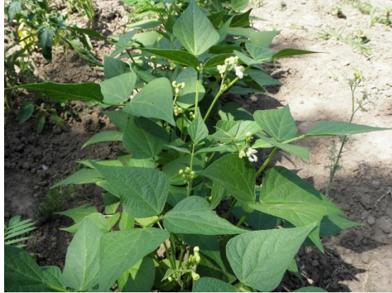
Figura 3. Phaseolus Vulgaris imagem adaptada de IGOR SHEREMETYEYEV 1 julho 2015

para a segurança alimentar em diversas regiões (MESQUITA et al. 2007). Esta cultura é de extrema importância econômica, pois existe uma alta demanda de seu consumo em todas as regiões brasileiras. Além disso, esta planta se destaca pela facilidade do seu cultivo, podendo ser cultivada em várias épocas do ano, necessitando de pouca quantidade de água para sua irrigação e podendo ser cultivada tanto em áreas irrigadas por grandes produtores, quanto por pequenos produtores ( COELHO et al. 2007).