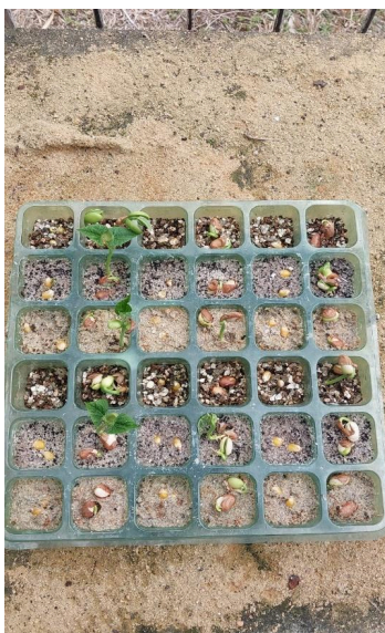
Figura 6. Germinação das sementes de Zea mays var. everta e Phaseolus vulgaris L. , Saulo Marques (2025)

de milho neste experimento se deve a alta umidade do solo, como observado também em Link & Costa (2008).