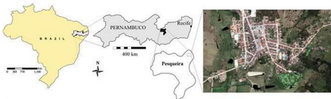
Figura 01. Mapa de localização do Distrito de Mutuca - PE.

O estudo foi desenvolvido no Distrito de Mutuca, município de Pesqueira, na região de Agreste do Estado de Pernambuco (Figura 1). A ação foi desenvolvida na Unidade Experimental Demonstrativa de Tratamento e Reúso Hidroagrícola, situada entre as coordenadas geográficas 7° 15' 18" e 8° 18' 11" de Latitude Sul, e 35° 52' 40" de Longitude Oeste e altitude média de 550m, Figura 1.