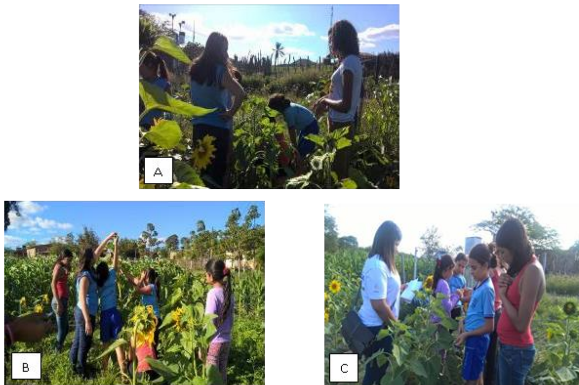
Figura 10. Diâmetro caulinar (A); Altura da Planta (B); Número de Folhas (C)

Na análise estatística dos dados da biometria participativa realizada pelos alunos da comunidade local, observou-se que houve diferenciação dos efeitos do tratamento (adubação via lodo) em relação aos caracteres agrônômicos altura da planta, diâmetro caulinar e número de folhas, de acordo com a análise de variância (Tabela 5).