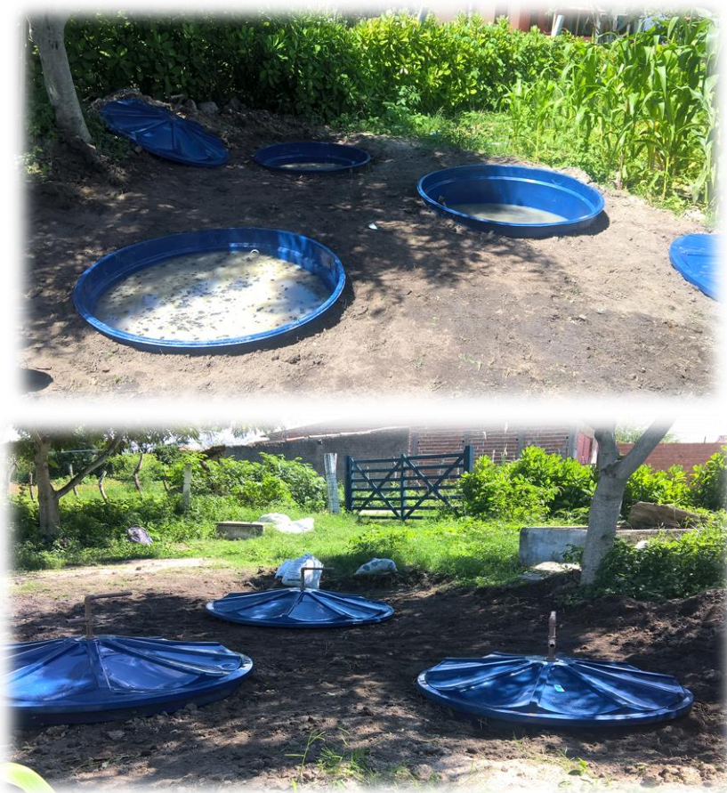
Figura 07. Sistema simplificado de baixo custo

O tratamento primário de esgotos e dejetos objetiva a remoção de sólidos e matéria orgânica, de modo a reduzir os valores de DBO (Demanda Bioquímica de Oxigênio) e DQO (Demanda Química de Oxigênio). A DBO representa a quantidade de oxigênio necessária para estabilizar a matéria orgânica biodegradável existente na água por meio da ação de microrganismos, enquanto que a DQO representa a quantidade de oxigênio necessária para estabilizar a matéria orgânica total presente na água. Os esgotos domésticos apresentam valores de DBO de 500 miligramas de oxigênio para cada litro de resíduo, respectivamente. Valores elevados de DBO e DQO indicam que os resíduos são mais poluentes e seu tratamento mais complicado.