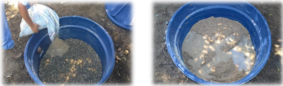
Figura 06. Vista superior do leito filtrante

Um filtro lento de areia é simplesmente um leito de areia apoiado por outro leito de cascalho, contido em uma caixa, com uma entrada para água bruta e uma saída para água tratada (SOLONA,1995). A filtração lenta em camada de areia apresenta uma taxa de filtração de duzentas vezes menor que na filtração rápida. O efluente pode demorar 2 ou mais horas da entrada à saída. Durante a passagem pelo meio filtrante, a água muda continuamente de direção, favorecendo o contato entre as impurezas e os grãos do meio filtrante, com retenção de parte delas, principalmente em até 40 cm de profundidade resultando em várias ações distintas: transporte, aderência e atividade biológica.