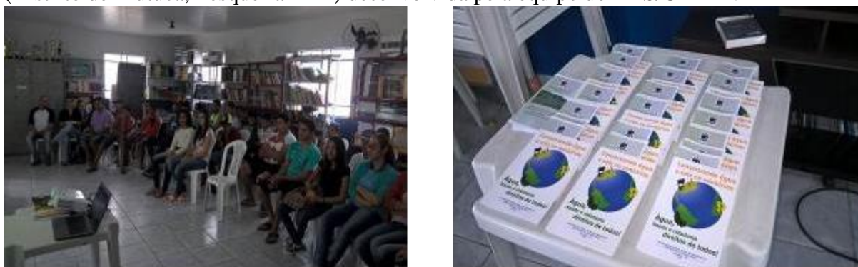
Figura 09. Palestra com alunos e professores da Escola Intermediária Henrique Monteiro Leite (Distrito de Mutuca, Pesqueira – PE) desenvolvida pela equipe do LAS/UFRPE.

Na ação foi desenvolvido o tema “reúso do esgoto doméstico tratado na agricultura e fontes alternativas na clarificação de águas residuárias”. Foi abordada a definição de reúso de água de acordo com a Resolução nº 54, de 28 de novembro de 2005, a importância do tratamento do esgoto e seu uso para fins hidroagrícolas, a proteção de nascentes e o cultivo de oleaginosa com alto potencial de clarificação de águas residuárias, como é o caso da Moringa oleífera que apresenta boa adaptação em diversas regiões do semiárido brasileiro florescendo e produzindo frutos mesmo em tempo de estiagem, além de sua potencialidade como coagulante natural, apresentando assim viabilidade ambiental, econômica e sanitária (Oliveira et al., 2018).