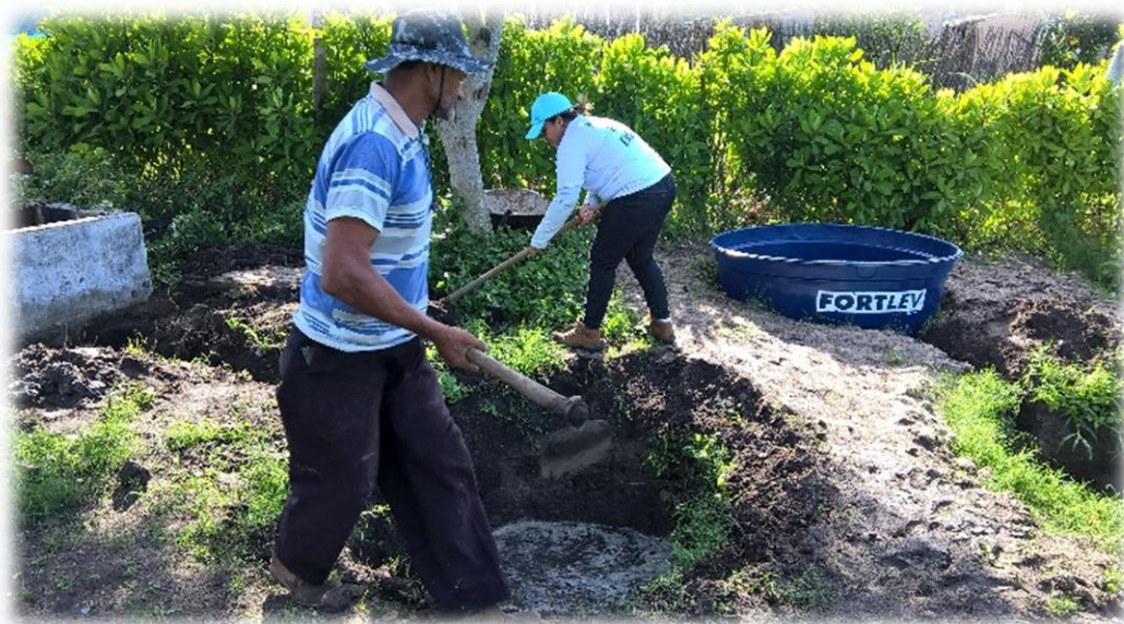
Figura 03. Instalação de caixa decantadora

O sistema é formado por três caixas, que são colocadas no solo e conectadas por meio do sistema de tubulação, Figura 4. O tubo é instalado na saída da caixa de recepção do esgoto (caixa de inspeção) e conectado à primeira caixa coletora (decantador primário), Figura 5. O objetivo é que os sólidos em suspensão, que apresentam densidade maior do que a do líquido circundante, sedimentem gradualmente no fundo constituindo o lodo primário. Parcela dos sólidos em suspensão sedimentados é de natureza orgânica, o que conseqüentemente resulta na redução da carga orgânica afluyente ao tratamento secundário.