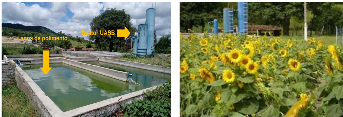
Figura 2. Unidade Experimental de Tratamento e Reúso de Esgoto doméstico – ETE Mutuca

Mutuca fica localizado no município de Pesqueira-PE, distante 230 km da cidade de Recife, capital do Estado, apresenta uma população de aproximadamente 5.500 habitantes e como a maioria das comunidades rurais do Estado, não dispõe de saneamento básico. Além disso, os efluentes domésticos de 1/3 do povoado drenavam diretamente para as nascentes da Bacia do Rio Ipojuca, responsável pela recarga do aquífero onde se situa poço amazonas e poço tubular, principais fontes de água potável da região. Em um terreno de 4078 m 2 , próximo a nascente, pela Prefeitura Municipal de Pesqueira, foi construída uma Unidade de Tratamento de Esgoto com reator UASB com recurso do Ministério da Ciência e Tecnologia, que contribuiu para a erradicação dos efluentes domésticos nas nascentes. A Estação de Tratamento de Esgoto (ETE) de Mutuca Figura 1, atende a uma parte do distrito de Mutuca correspondente a 150 residências com uma média de 5 moradores por unidade, 750 pessoas, cuja renda média é de um salário mínimo. A vazão que alimenta o reator UASB foi estimada em 3000 L/ dia. A estação de tratamento de esgotos de Mutuca é constituída de um tratamento preliminar com grades de barra, desarenador e calha Parshall; em seguida, um reator UASB, combinado com um filtro anaeróbico de fluxo descendente e lagoa de polimento dando aos efluentes um grau de tratamento secundário (SANTOS, 2017).