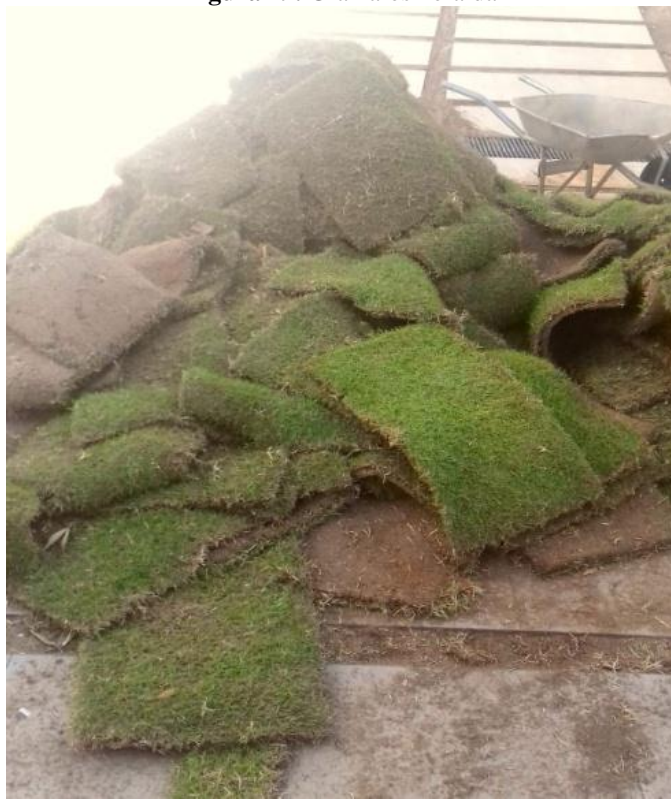
Figura 19. Grama-esmeralda