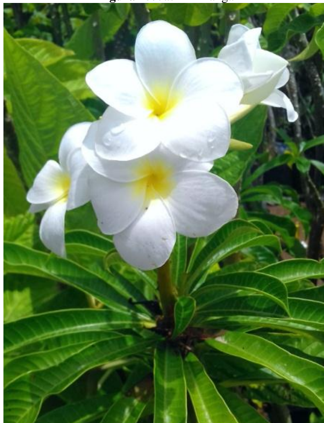
Figura 15. Jasmin-manga