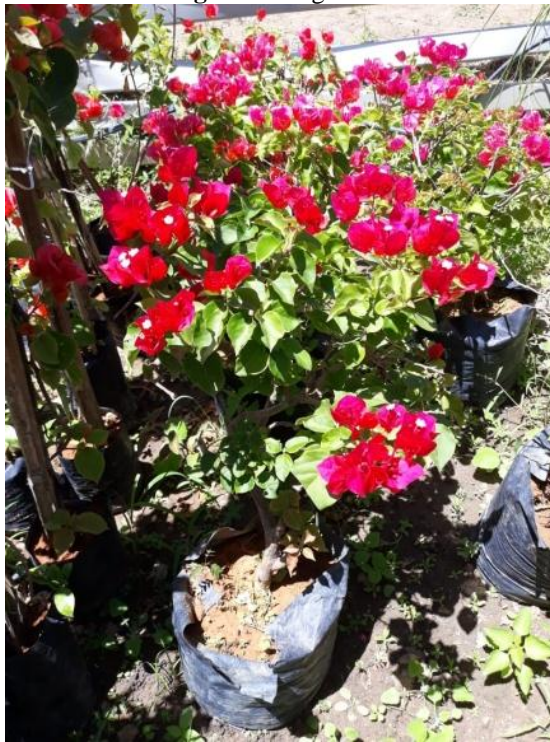
Figura 8. Baganvile