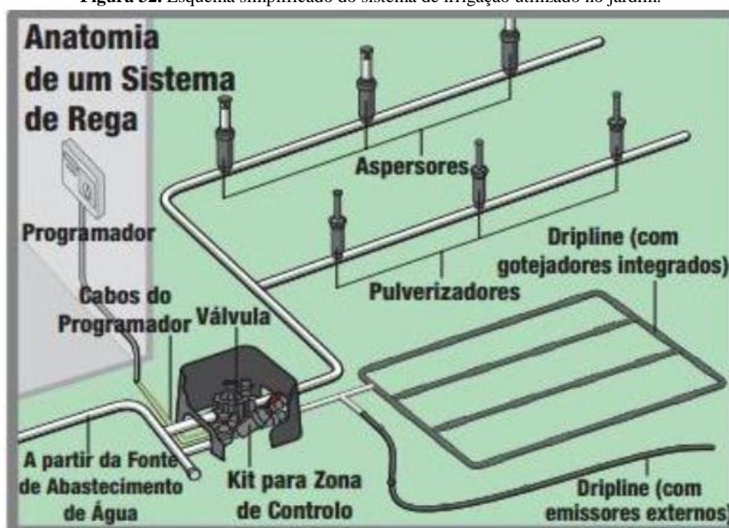
Figura 32. Esquema simplificado do sistema de irrigação utilizado no jardim.

A água utilizada para irrigação do jardim é proveniente do reaproveitamento da água que é consumida na residência, sendo oriundas do uso dos chuveiros, lavatórios e máquinas de lavar roupas, sendo denominadas de Águas cinzas, que após tratamento, podem ser usadas na irrigação paisagística da residência.