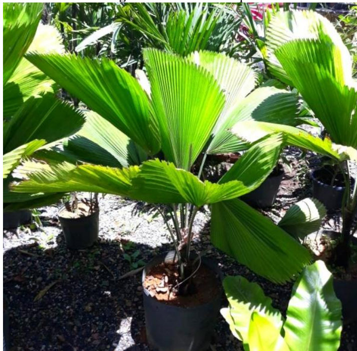
Figura 31. Palmeira –leque