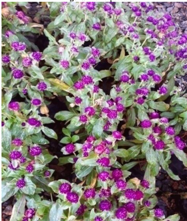
Figura 24. Perpétua