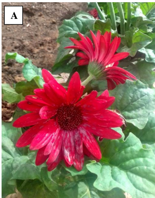
Figura 45. Gérberas com sintomas de Oídio (A), plantas mortas (B)