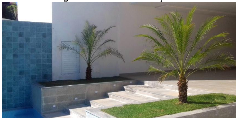
Figura 52. Cicas na escada da piscina