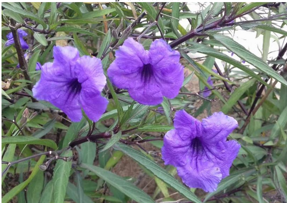
Figura 28. Ruélia-azul