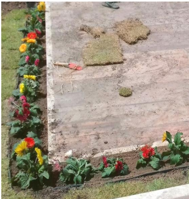
Figura 43. Introdução de gérberas

Foi introduzida mudas de gérberas para formar uma bordadura no entorno do Platô da fachada da residência (Figura 43) e o cipreste italiano (Figura 44).