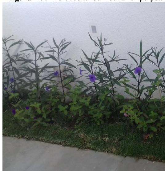
Figura 49. Bordadura de ruélia e pérfetua