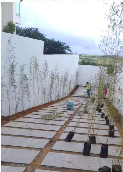
Figura 38. Plantio do bambu da Índia