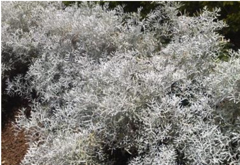
Figura 29. Cinerária