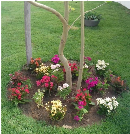
Figura 56. Maciço do plátano