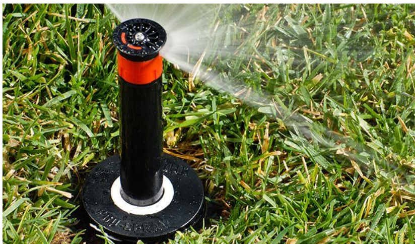
Figura 35. Emissor PRO-SPRAY®