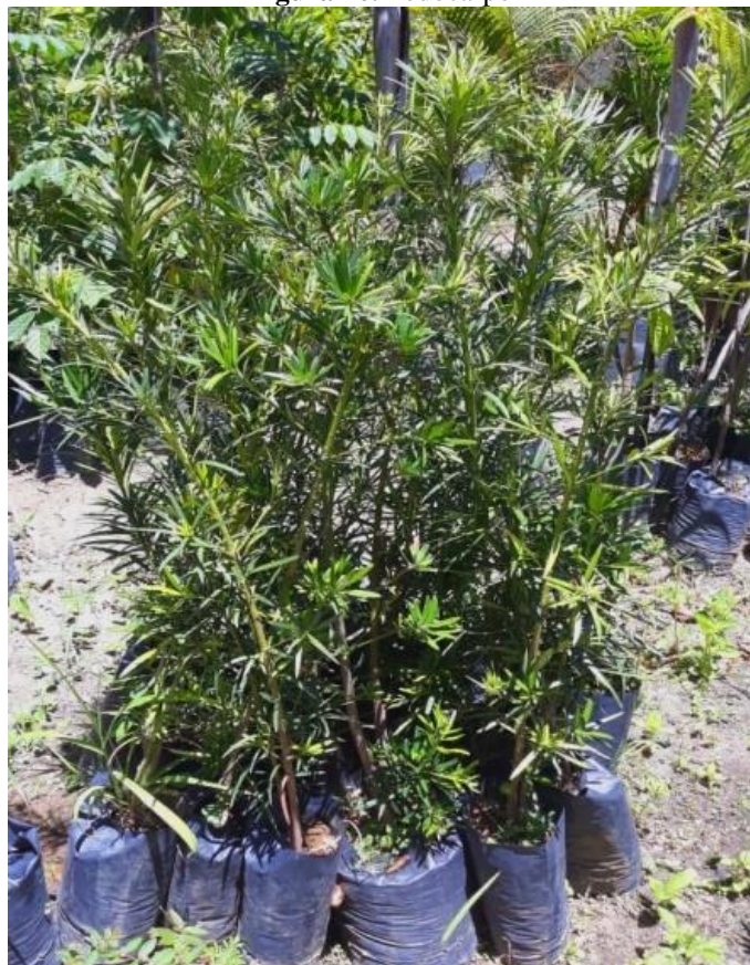
Figura 16. Podocarpo