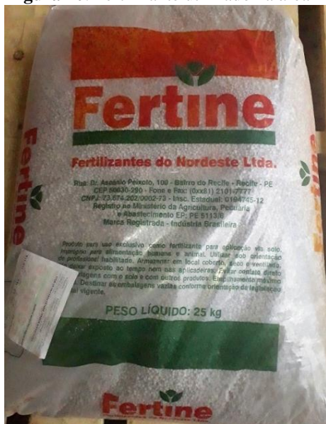
Figura 40. Fertilizante utilizado na área