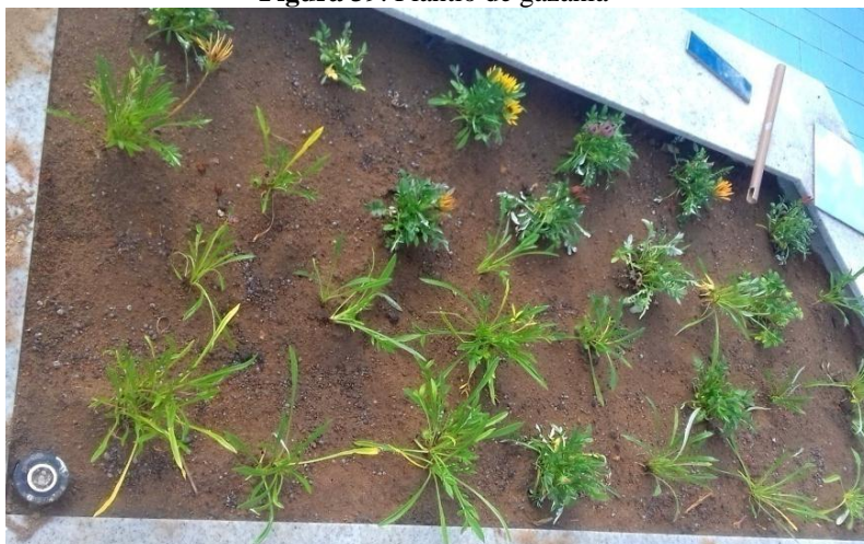
Figura 39. Plantio de gazânia

O plantio de gazânia se deu logo nos primeiros dias da implantação no jardim, devido ser uma área destinada para espécie (Figura 39).