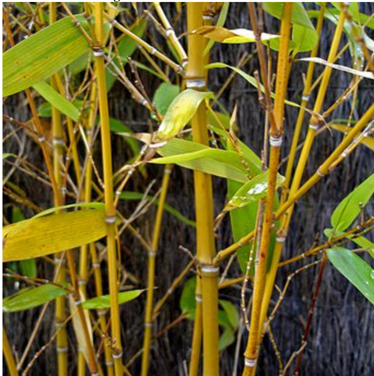
Figura 18. Bambu Cana da Índia