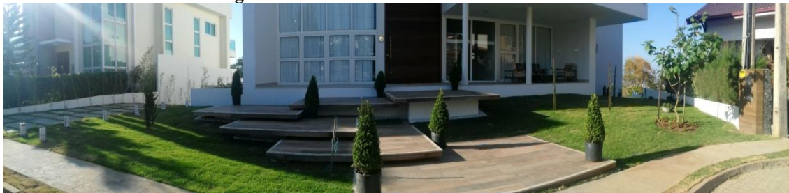
Figura 57. Área frontal da residência finalizada