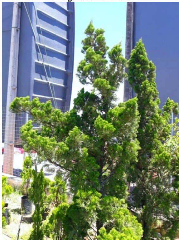
Figura 5. Kaizuka