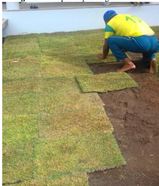
Figura 41. Implantação da grama