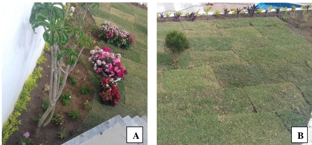
Figura 54. Jardim triangular

O jardim na lateral da casa, no formato triangular, recebeu o maior número de espécies diferentes, formando maciços, bordaduras, e trazendo cor a um ambiente que não teria muita visibilidade (Figura 54 A,B). Necessitou nessa área o uso de limitador de grama.