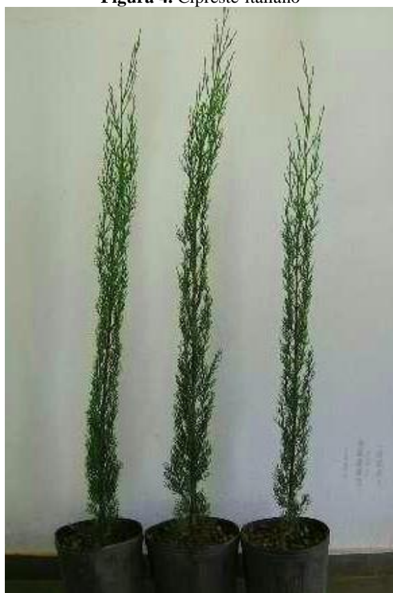
Figura 4. Cipreste-italiano