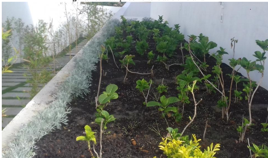
Figura 46. Maciço de hortênsias e cinerária

Foram introduzidas o maciço de hortênsias e as cinerárias (Figura 46), formando a bordadura, do jardim superior na lateral esquerda da casa.