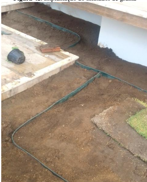
Figura 42. Implantação do limitador de grama

Algumas áreas necessitaram do uso de limitadores de grama, que é de uso muito comum para que a grama não invada locais onde estejam outras espécies, é utilizado também para promover algumas formas diferentes nos desenhos dos canteiros (Figura 42).