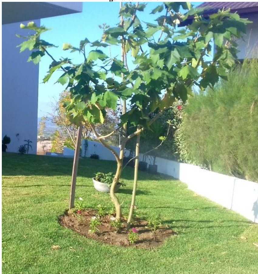
Figura 6. Plátano