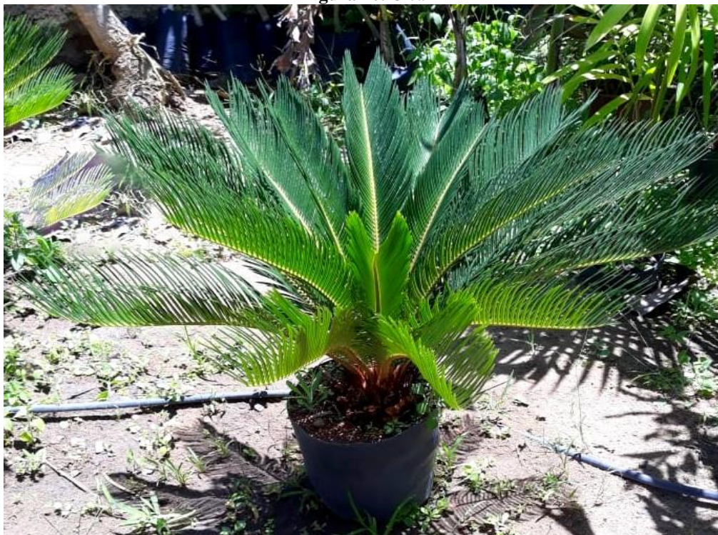
Figura 10. Cica