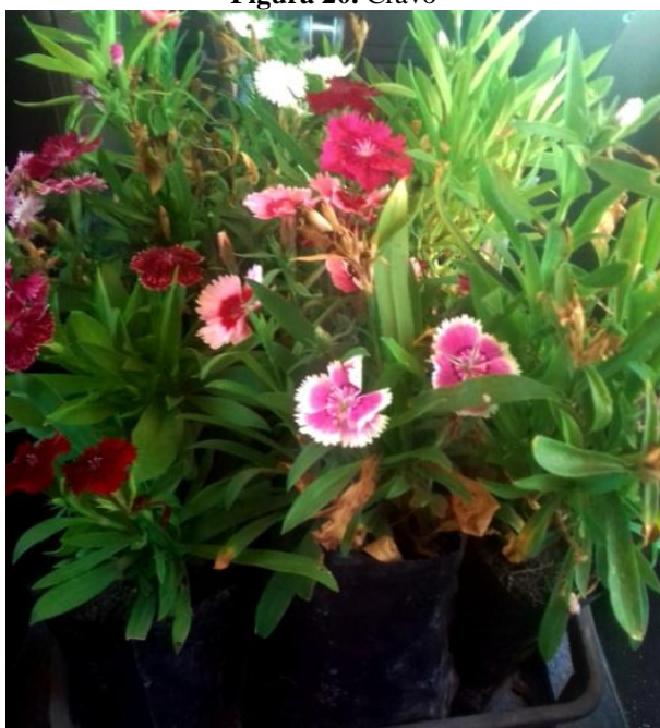
Figura 20. Cravo