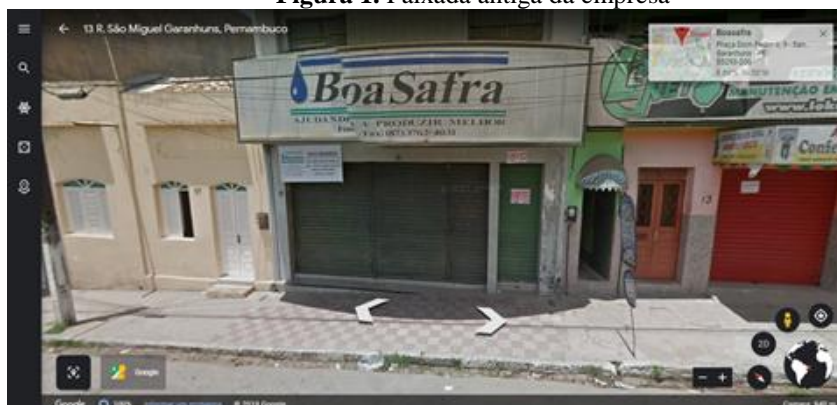
Figura 1. Faixada antiga da empresa

Atualmente a assistência técnica abrange em um raio de 100 km de distância, com atuação direta em campo no auxílio direto ao produtor rural, sejam nas áreas de olerícolas, fruticultura, principalmente com as culturas da pitaya e uva, e com pastagem. A empresa conta com 9 colaboradores, que são divididos em 4 setores: Diretor, Responsável Técnico, Assistência externa e Assistência interna.