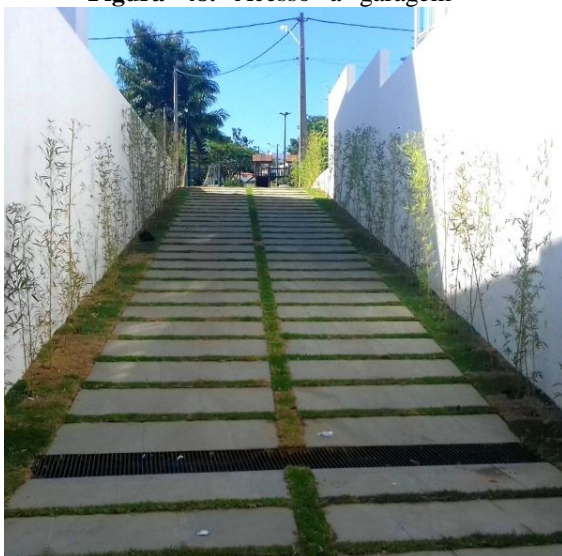
Figura 48. Acesso a garagem

Foram implantadas grama-esmeralda nos espaços entre piso na rampa da garagem e entre os bambus, protegendo da exposição do sol e trazendo melhor acabamento na área (Figura 48). A implantação da ruélia com a pérfetua e a grama, serviram como embelezamento e harmonização da parede que dá acesso a garagem (Figura 49).