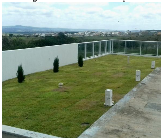
Figura 51. Jardim na área da piscina