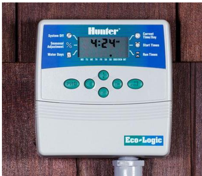
Figura 33. Controlador Eco Logic ELC-401i - E HUNTER INDUSTRIES ®

É onde ocorrem todos os comandos do sistema de irrigação. É no controlador (Figura. 33) que permite a escolha do horário para início do turno de rega e o tempo para atingir a lâmina de água necessária em cada setor. Com esse tipo de sistema é possível ter o controle de quantas vezes irá ocorrer e quais os dias da semana o sistema executará as funções.