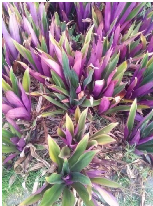
Figura 30. Abacaxi-roxo