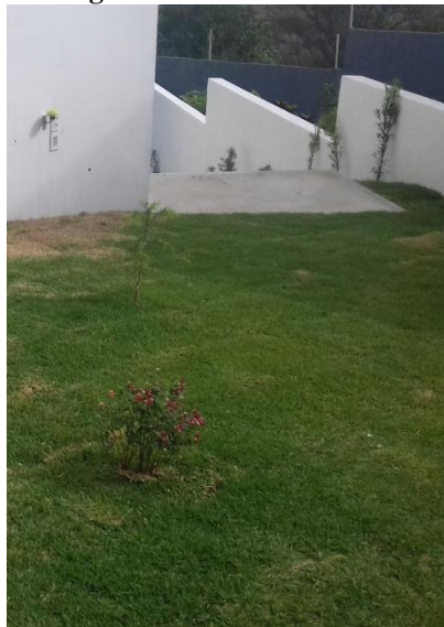
Figura 55. Recuo da casa