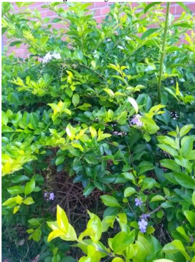
Figura 11. Pingo-de-ouro