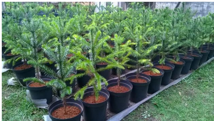
Figura 2. Pinheiro-do-paraná