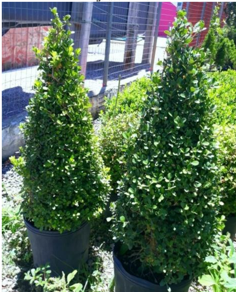
Figura 9. Buxinho