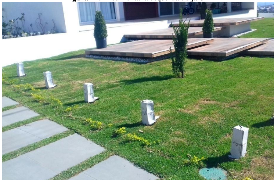
Figura 47. Área frontal a esquerda do jardim