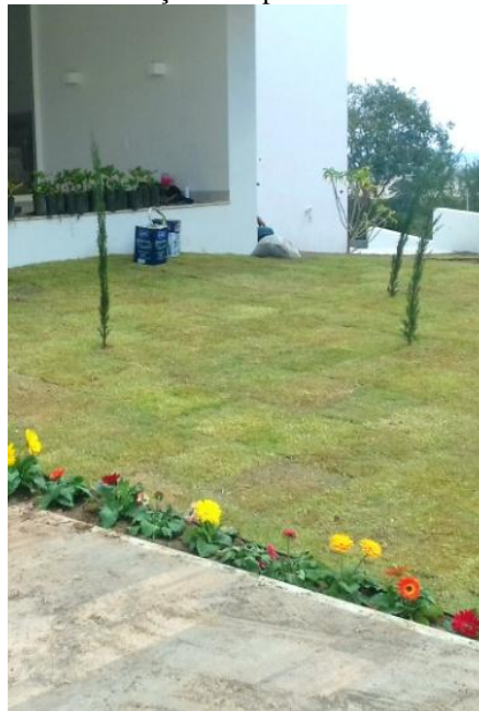
Figura 44. Introdução de cipreste italiano