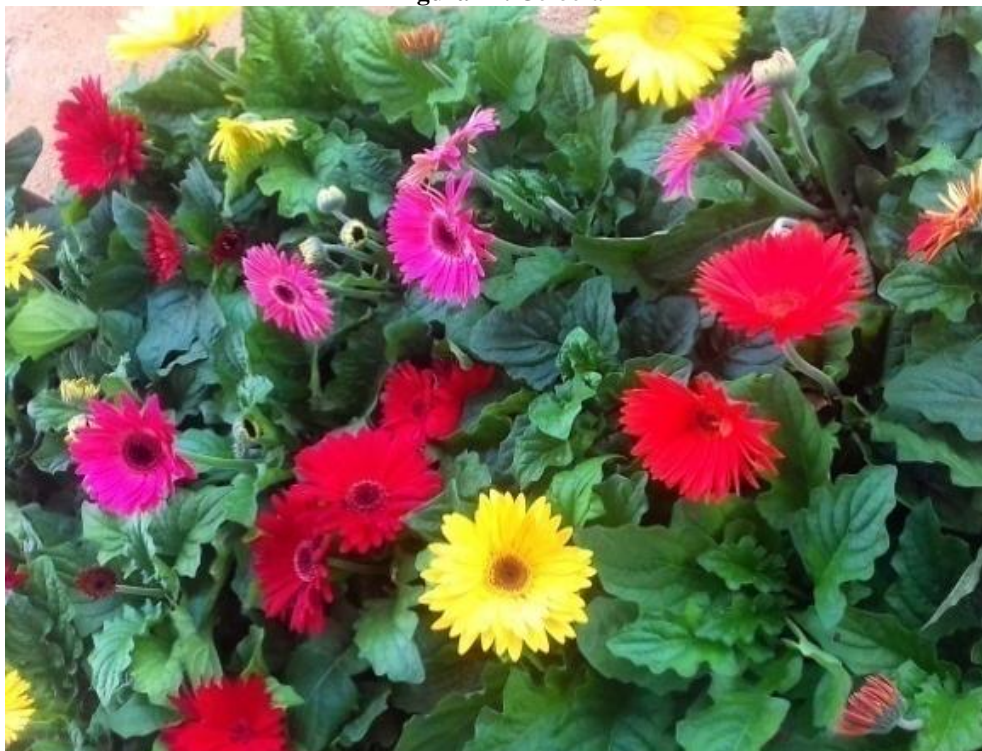
Figura 22. Gérbera