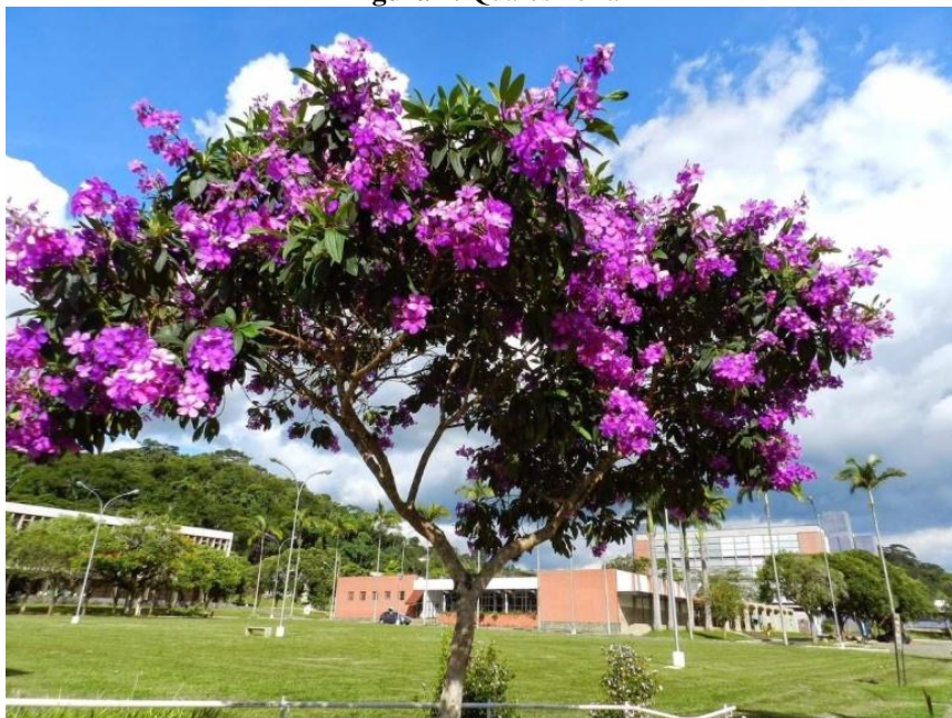
Figura 7. Quaresmeira