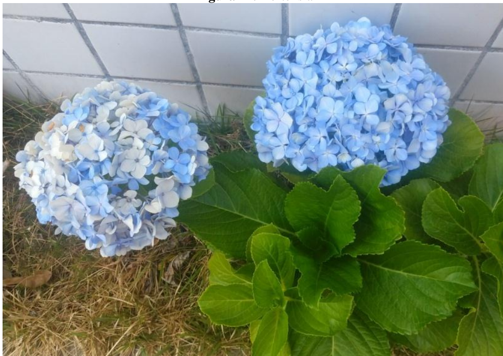
Figura 14. Hortênsia