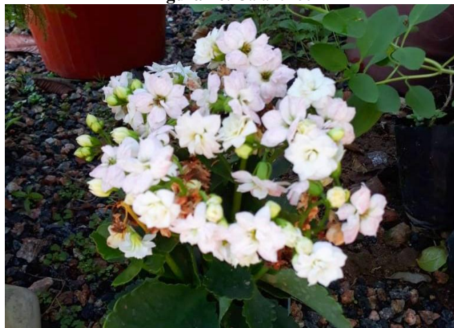
Figura 26. Calanchoê