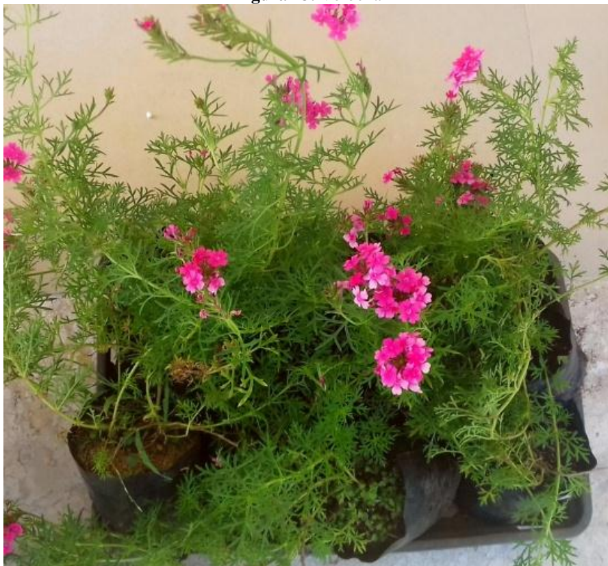
Figura 23. Verbena