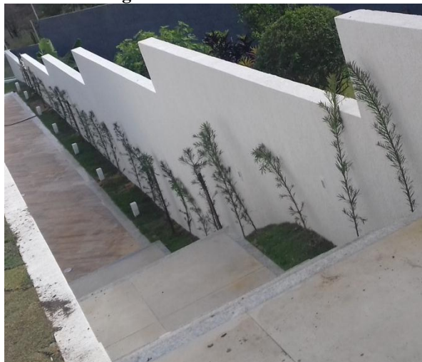
Figura 53. Escada de acesso

A escada que dá acesso a parte frontal da casa, teve como bordadura o uso de podocarpo e grama, que trouxeram textura, cor e privacidade à área da piscina (Figura 53).