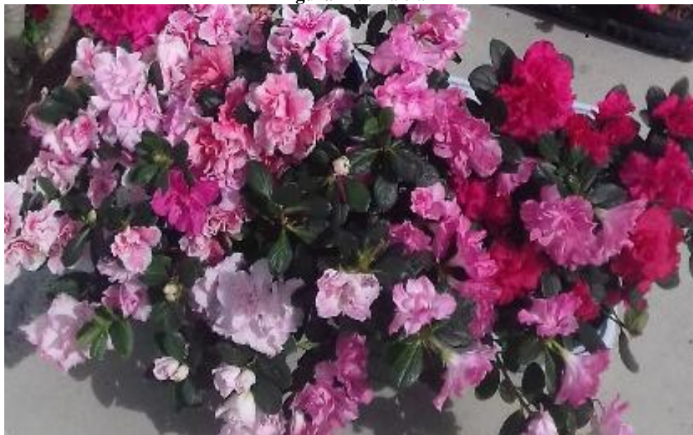
Figura 17. Azaléia