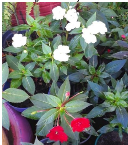
Figura 25. Beijo-turco