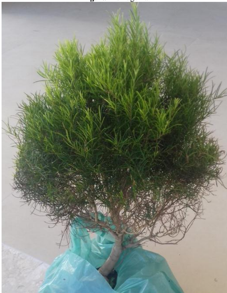
Figura 12. Eugenia