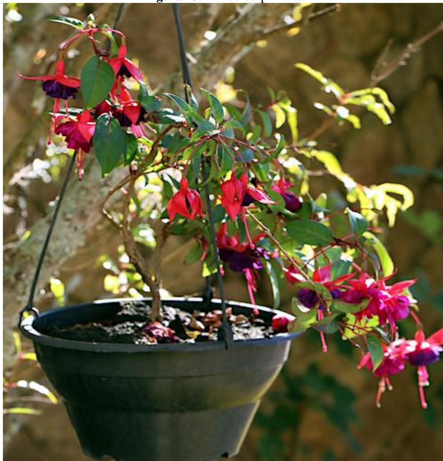
Figura 13. Brinco-de-princesa