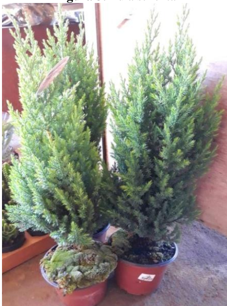
Figura 3. Tuia strickta