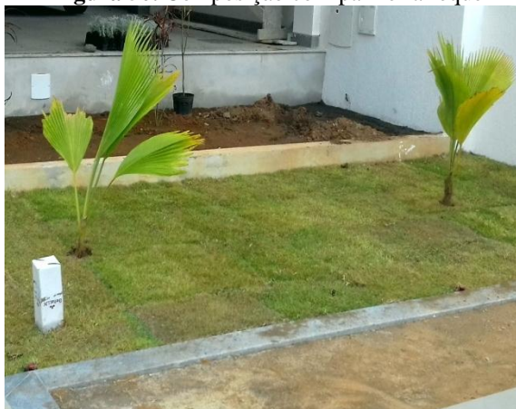
Figura 50. Composição com palmeira-leque

formaram uma composição bem interessante na escada que dá acesso a piscina (Figura 52).