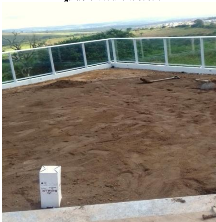
Figura 37. Nivelamento do solo

Para a implantação das espécies foi realizado o nivelamento do terreno, que foi realizado através de equipamentos como nivelador de bolhas, régua niveladora, inchadas e rastelos, para posterior realizar o plantio no jardim (Figura 37). Foi necessária a utilização de solo vindo de outro local, para aterrar, melhorando o nível da área, tendo em vista que a residência tinha uma declividade considerável e continham resto de construção. A introdução desse solo ajudou também para o desenvolvimento das mudas e da grama no solo.