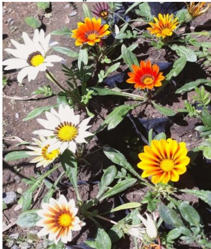
Figura 21. Gazânia