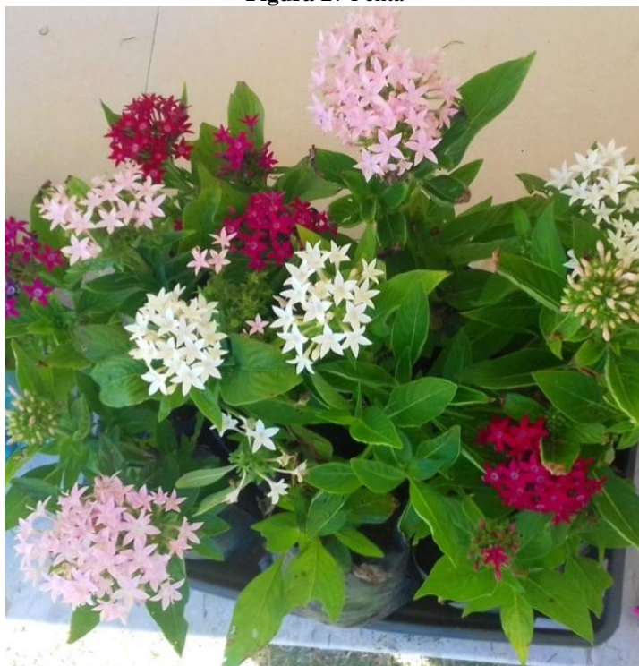
Figura 27 Penta