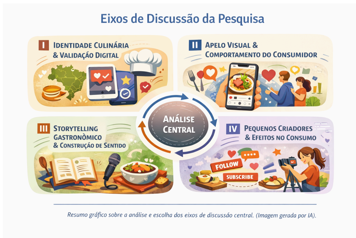
Figura 2. Resultado da análise e escolha dos eixos de discussão central.