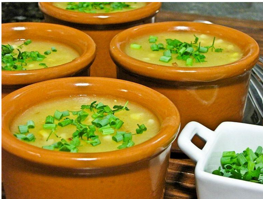
Figura 14 - Caldinho de mocotó