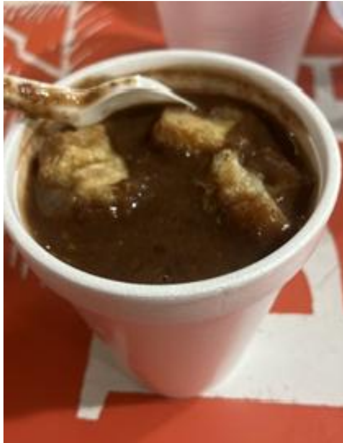
Figura 2 - Caldinho de feijão preto com torresmo