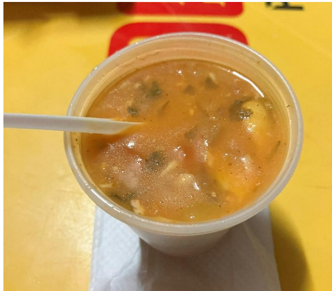
Figura 5 - Caldinho de peixe

Outras variações populares incluem o caldinho de camarão, preparado com partes como o cefalotórax e a carapaça, e o caldinho de peixe, que utiliza cabeças de peixe (figura 5), vegetais e carboidratos como batata e macaxeira (COSTA et al., 2022). Tais preparos mostram o vínculo entre práticas alimentares e sustentabilidade, ao reaproveitar partes do alimento normalmente descartadas