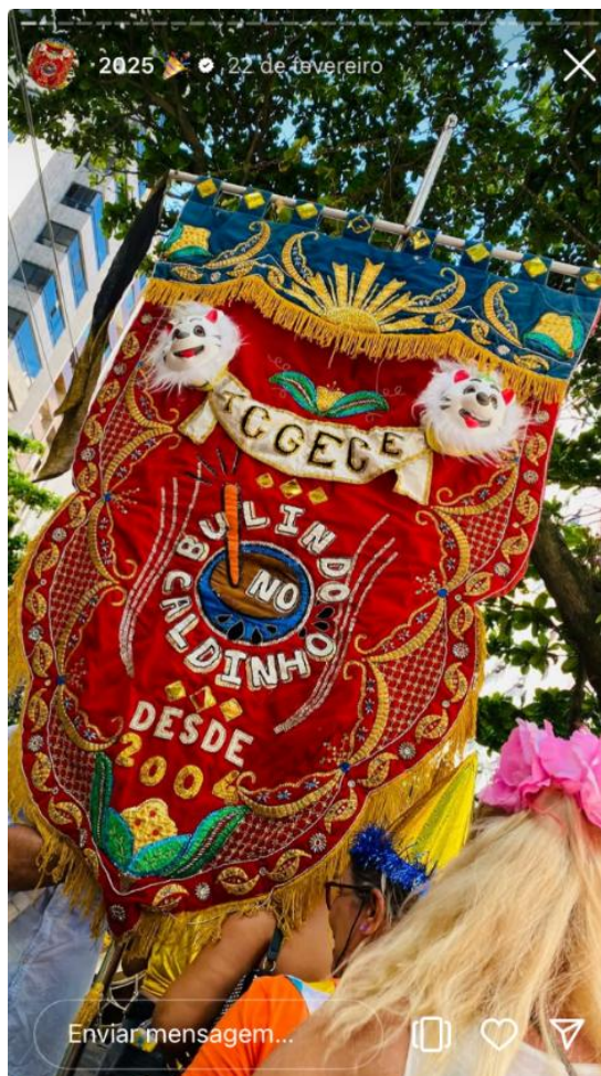
Figura 27 - Estandarte da T.C.G.E.C.E. Bulindo no Caldinho

Fonte: Rede Social do Bulindo no Caldinho (2025)