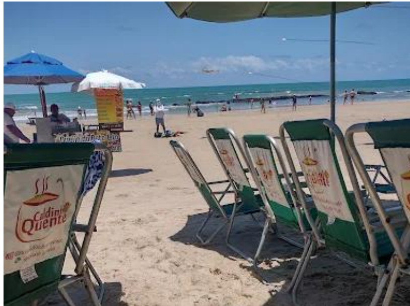
Figura 25 - Barraca de praia Caldinho Quente em Boa Viagem

e herdou as receitas do seu sogro Biu, do Caldinho do Biu, que já se aposentou da praia há anos segundo o portal Diário de Pernambuco (2017).