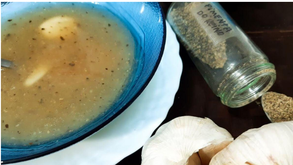
Figura 7 - Mingau de cachorro

Já o mingau de cachorro (figura 7), originalmente feito com farinha de milho, podendo ser um derivado do quarenta e servido aos cachorros, foi adaptado para ser feito com farinha de mandioca, alho e pimenta do reino sendo uma excelente cura para gripes e resfriados segundo a cultura popular. É importante ressaltar que para a venda como caldinho, ambos têm a sua consistência alterada para facilitar o consumo.