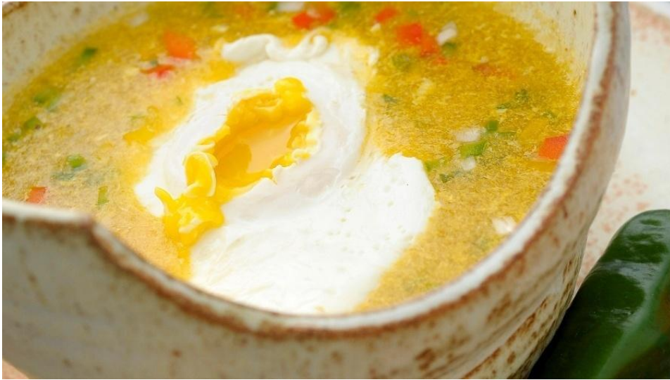
Figura 6 - Cabeça de galo