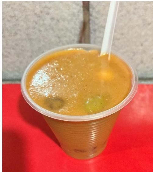
Figura 13 - Caldinho de feijão mulatinho