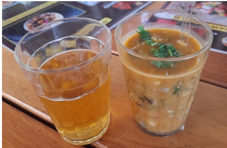
Figura 10 - Caldinho de sinfonia marítima