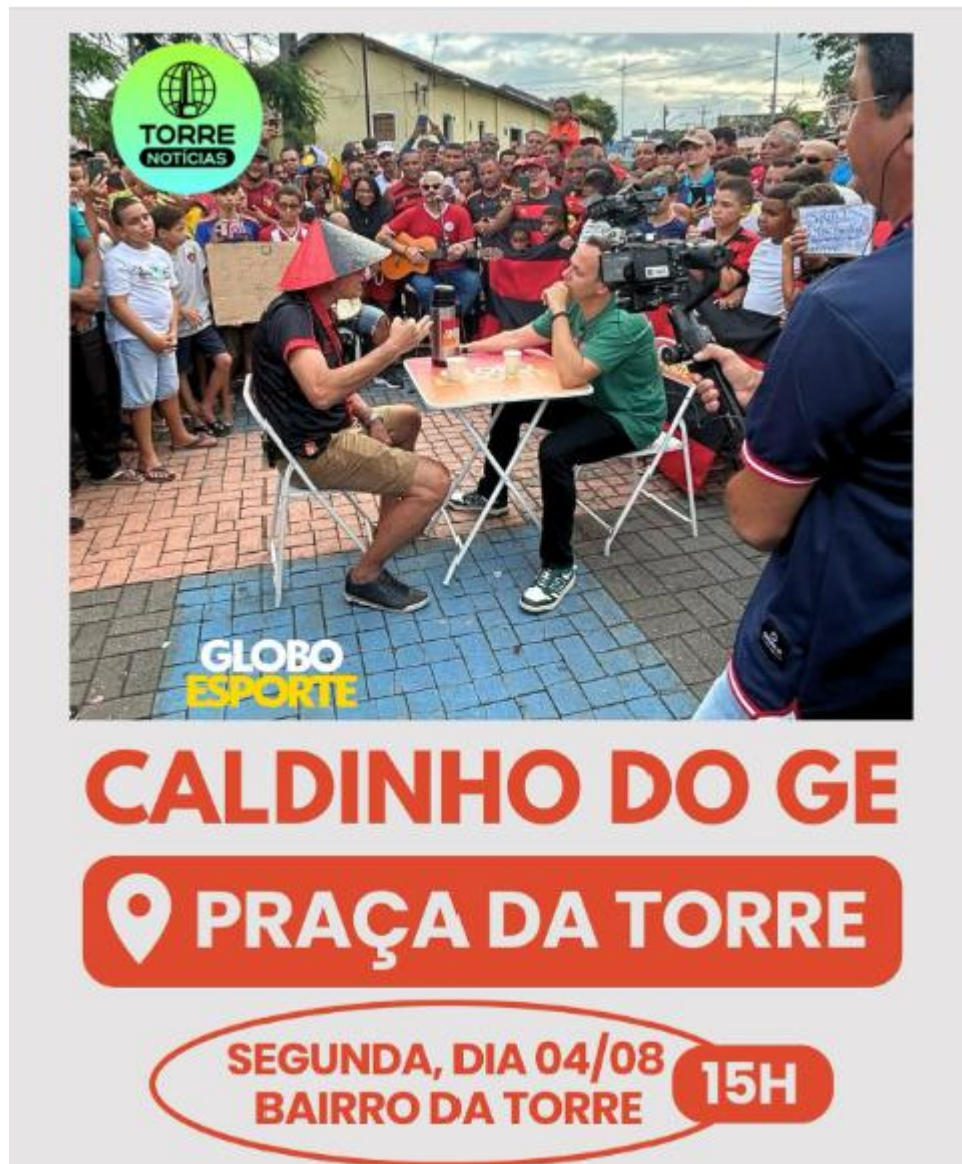
Figura 31 - Convocação dos moradores do bairro da Torre