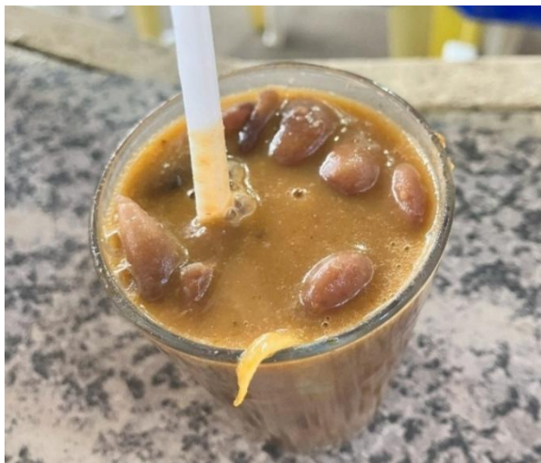
Figura 12 - Caldinho de fava com charque