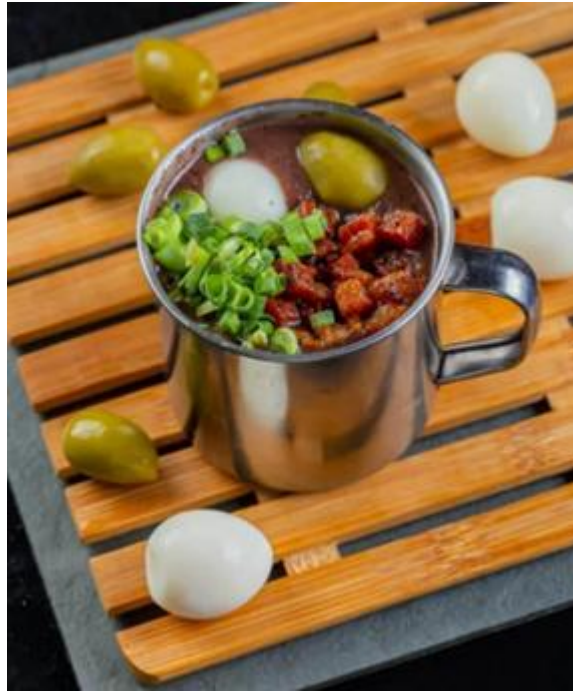
Figura 3 - Caldinho de feijão preto