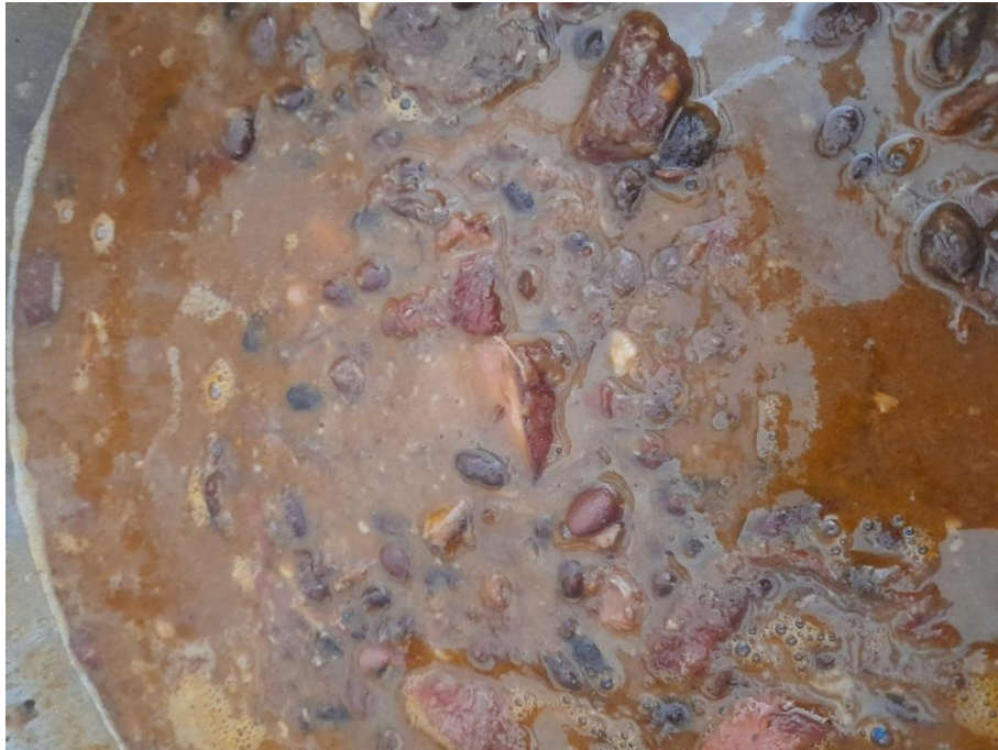
Figura 1- Típica feijoada de feijão preto