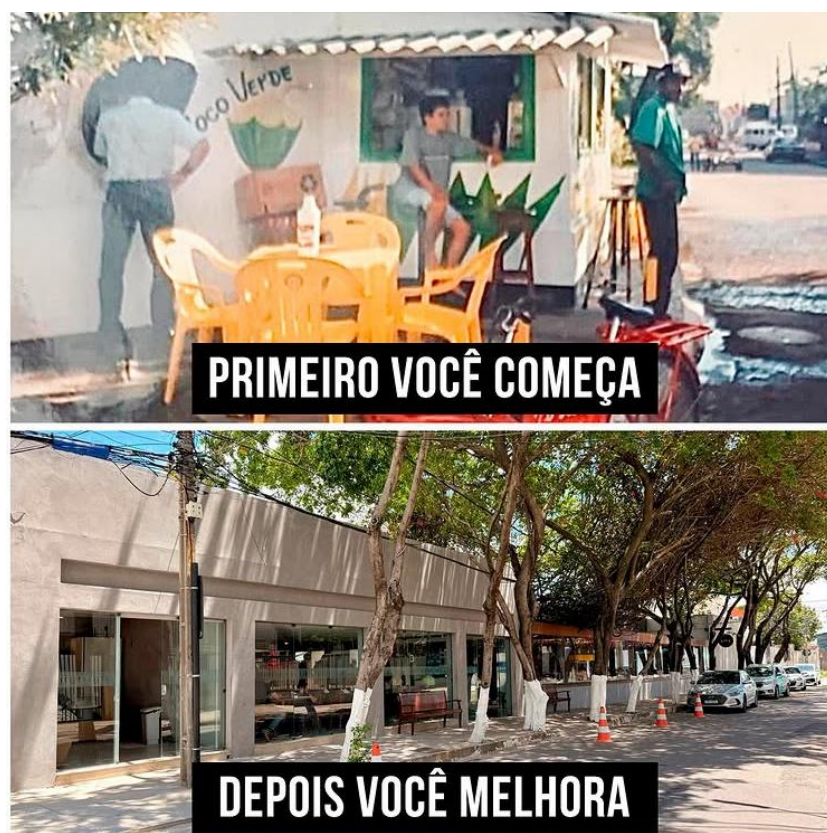
Figura 23 - Evolução do Caldinho do Neném