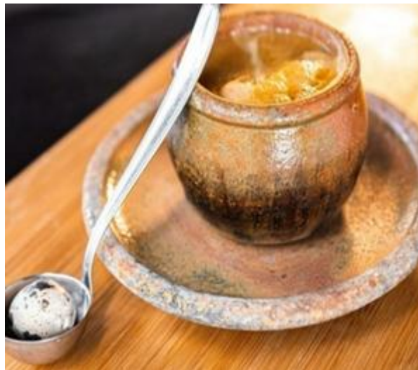
Figura 4 - Caldinho de feijão mulatinho