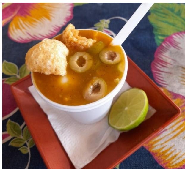
Figura 15 - Caldinho de vaca atolada