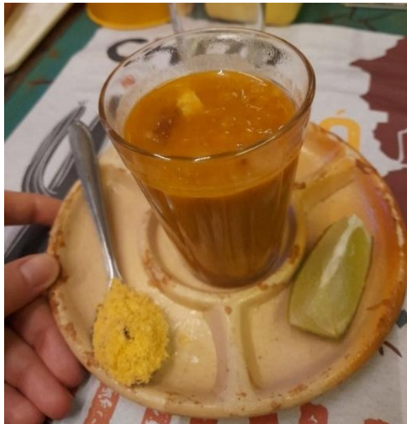
Figura 11 - Caldinho de dobradinha