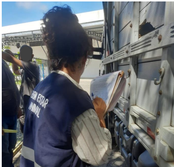
Figura 5 - Avaliação dos animais capturados.

A realização de captura de animais (geralmente de equídeos e bovinos) soltos em vias públicas eram medidas visando evitar acidentes de trânsito. As ações incluíram o resgate dos animais e a análise clínica dos animais (figura 5), com a realização de exames para identificação de possíveis doenças, especialmente zoonoses. Caso fosse diagnosticada alguma enfermidade, os animais seriam encaminhados para tratamento no Centro de Saúde Animal (CVA), e após a recuperação, seriam devolvidos aos seus proprietários. Caso contrário, os animais seriam destinados à adoção.