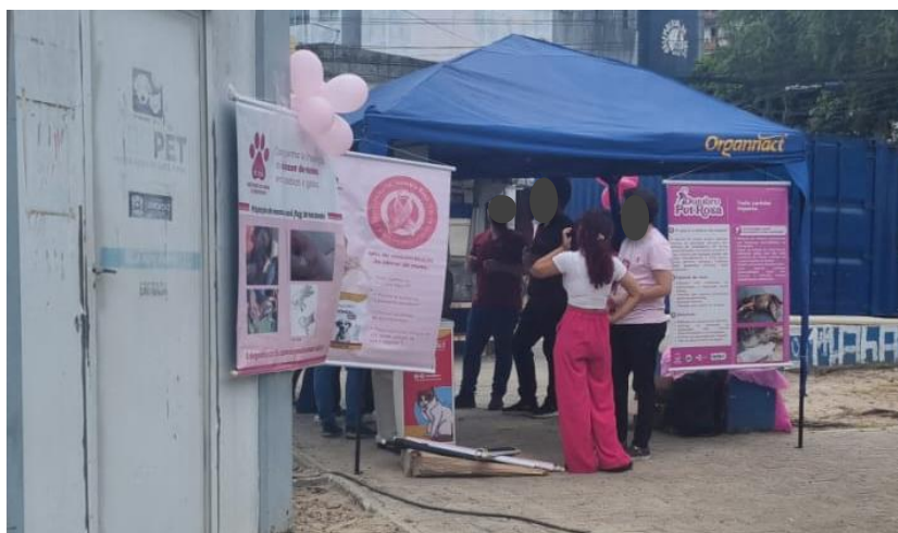
Figura 10 - Evento outubro rosa.

Na figura 11, foi organizado junto com os veterinários, residentes e graduando da Universidade Federal Rural de Pernambuco o evento outubro rosa, onde ocorreram exames de prevenção ao câncer de mama.