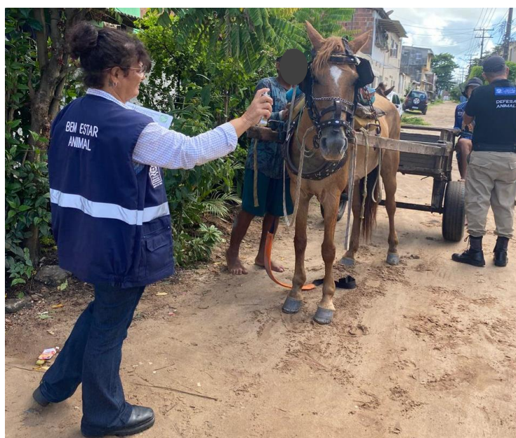
Figura 4 - Aplicação de medicamentos nos ferimentos dos equinos.