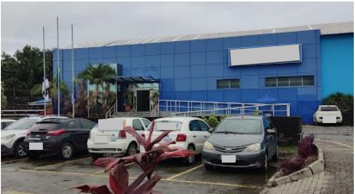
Figura 1 - Centro Administrativo de Jaboatão dos Guararapes

Durante o Estágio Supervisionado Obrigatório, as atividades foram conduzidas na Secretaria De Bem-Estar Animal da Prefeitura municipal de Jaboatão dos Guararapes-PE (Figura 1) localizado no Centro Administrativo de Jaboatão dos Guararapes (8°09'04"S 34°55'18"O (Google Earth)) no endereço: Estrada da Batalha 1200 Galpão N - Jardim Jordão, Jaboatão dos Guararapes - PE