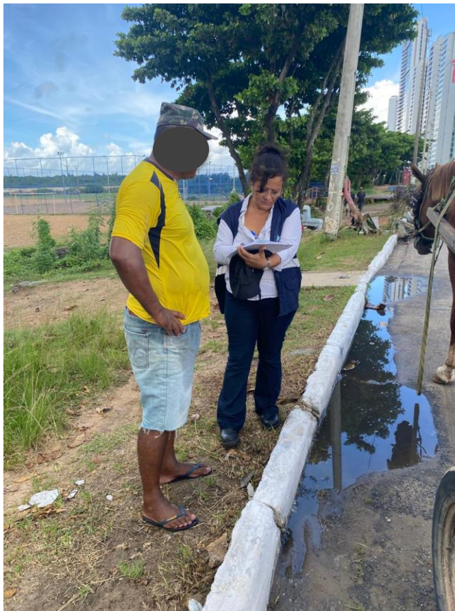
Figura 3 - Coleta de dados dos carroceiros e animais.