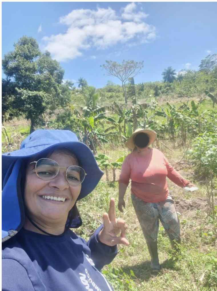
Figura 11 - Visita técnica a pequenas propriedades.

Durante o estágio foi realizadas visitas técnicas a agricultores de baixa renda figura 12. Na visita as propriedades, vimos às demandas que precisavam ser feitas, aconselhamos e sugerimos algumas ações de imediato e observamos a situação os animais.