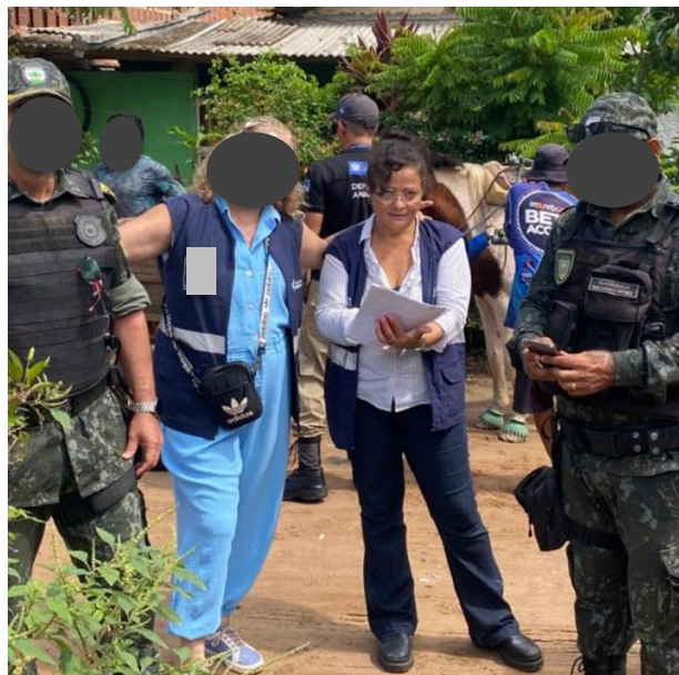
Figura 2 - Atividade educativa para carroceiro com acompanhamento da polícia militar

Os carroceiros eram parados para fazer o cadastro do animal (Figura 3), onde coletávamos os dados (RG, CPF e endereço do dono, idade e sexo do animal, equipamentos que garantiam o bem – estar do animal e se apresentavam ferimentos e doenças visíveis). Quando encontrávamos ferimentos, aplicávamos medicamentos nas feridas (figura 4) e sinais de maus – tratos eram feitas medidas educativas e em caso de reincidente o animal era recolhido.