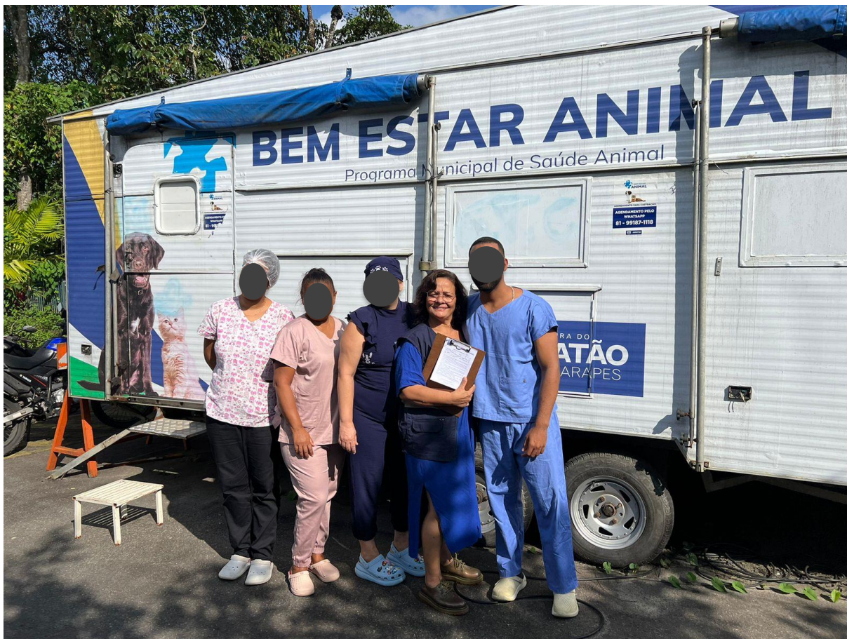
Figura 6 - Equipe da unidade móvel de castração do castramovel.

Na unidade móvel de castração, era feito atividades de agendamento onde coletávamos dados e lançados em planilha (figura 7 e 8). Foi também realizada a fiscalização e o acompanhamento das Unidades Básicas de Saúde (UBS), que prestam atendimento veterinário, com consultas realizadas por médicos veterinários e acompanhamento da equipe técnica.