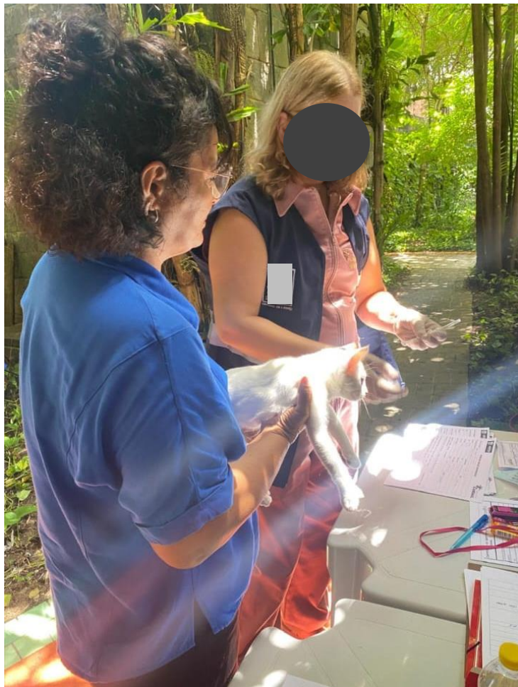
Figura 9 - Campanha de adoção de cães e gatos.

Na figura 11, foi organizado junto com os veterinários, residentes e graduando da Universidade Federal Rural de Pernambuco o evento outubro rosa, onde ocorreram exames de prevenção ao câncer de mama.