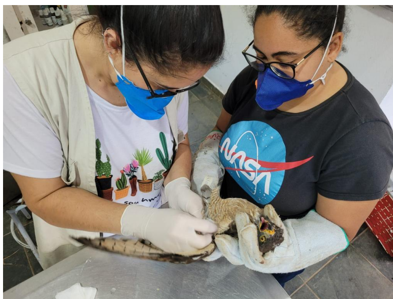
Figura 8. Avaliação de um gavião-carijó ( Rupornis magnirostris ) que chegou vítima de trauma cranioencefálico na Associação Mata Ciliar.

Na triagem, inicialmente, os animais admitidos passavam por avaliação clínica. Neste momento foi realizado o preenchimento da ficha de monitoramento, mediante o exame físico e a avaliação dos parâmetros vitais (Figura 8), como frequência cardíaca (FC), frequência respiratória (FR), além da temperatura, grau de desidratação e peso. Quando necessário, também eram realizados os primeiros cuidados para estabilização do paciente, como analgesia e reposição da volemia e hidratação.