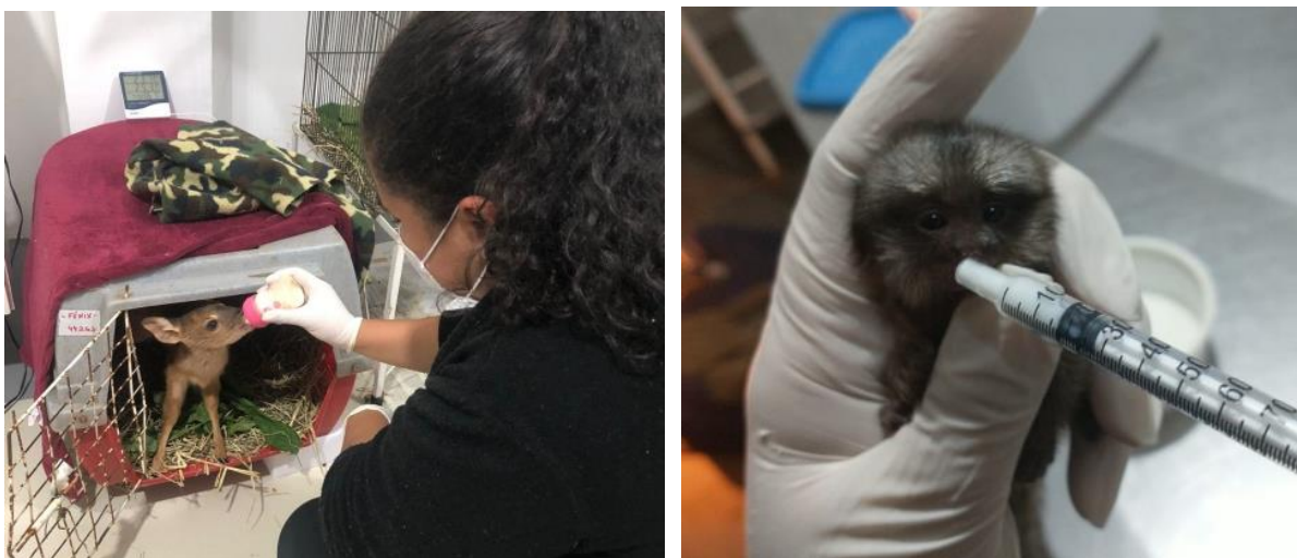
Figura 17 e 18. Amamentação de mamadeira com 100 mL de leite de cabra para um filhote de veado catingueiro ( Mazama gouazoubira ) à esquerda. Alimentação de 0,5 mL de leite de cabra via seringa de insulina em filhote órfão de sagui-de-tufo-preto ( Callithrix penicillata ), à direita na Associação Mata Ciliar.

Durante os plantões noturnos e nos finais de semana, foi acompanhado o setor da maternidade, onde foi possível compreender a importância do manejo neonatal para o sucesso da reabilitação. Acompanhei um filhote de veado catingueiro ( Mazama gouazoubira ) que chegou órfão, onde era necessário fornecer mamadeira com 100 mL de leite de cabra durante o dia e noite (Figura 17), além da estimulação com algodão umedecido com água morna, primeiro na vulva para estimular a urina e posteriormente no ânus para a defecação. Também foi realizado o mesmo procedimento em filhote de sagui de tufo preto ( Callithrix penicillata ) (Figura 18), e alimentação via sonda em filhotes de columbiformes, até então esses indivíduos não haviam sido identificados quanto a espécie, uma vez que chegaram ainda sem plumagem, o que dificulta a diferenciação das espécies de Columbiformes. A quantidade do leite variava diariamente com a avaliação da bióloga responsável pela maternidade.