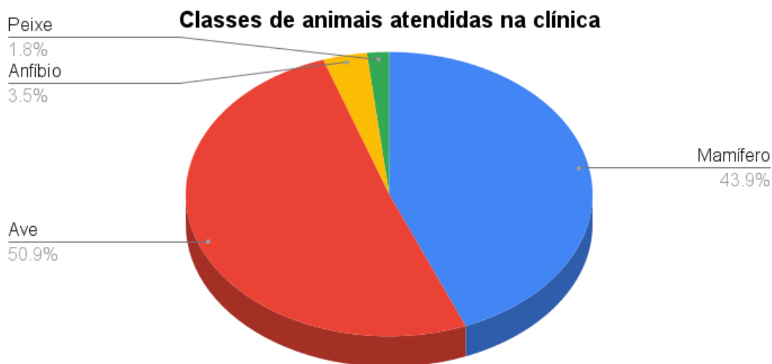
Gráfico 3. Classes dos animais atendidos durante o período de estágio supervisionado obrigatório na Clínica Amazoo Pets.