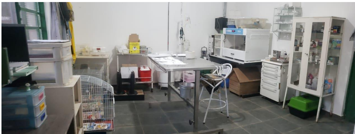
Figura 2. Ambulatório do Setor de Triagem da Associação Mata Ciliar.

médica ou serem realocados para outros recintos. O ambulatório era ainda equipado com uma Unidade de Terapia Animal (UTA) que funcionava como um ambiente com temperatura e umidade controlada por termômetros e termostatos. Além disso, havia uma sala de necropsia, com freezers para o armazenamento das carcaças.