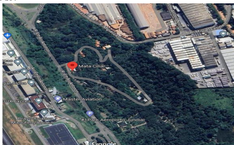
Figura 1. Área da Associação Mata Ciliar sendo representada por floresta semidecidual reflorestada, vista por satélite, Jundiaí-SP.

Segundo o relatório de fauna da AMC, sua área no município de Jundiaí possui cerca de 33 hectares, sendo predominantemente de floresta estacional semidecidual (Figura 1). Tal área passou por processo de revitalização e reflorestamento, o que possibilitou o estabelecimento da fauna originária utilizando o projeto do viveiro de mudas.