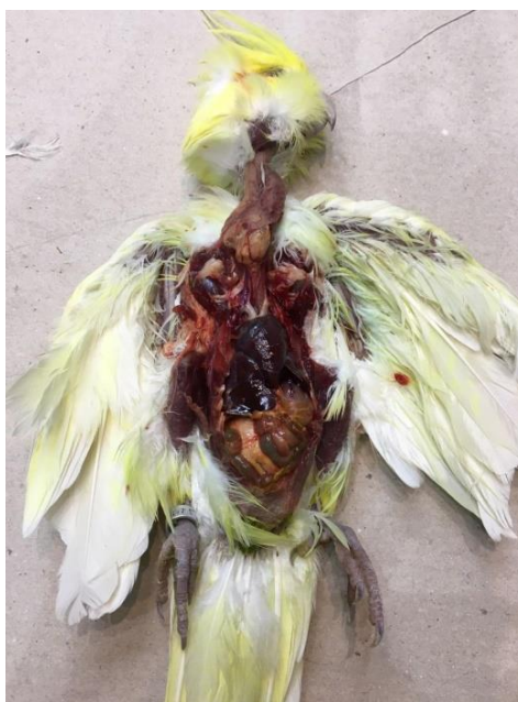
Figura 27. Realização de necropsia em calopsita ( Nymphicus hollandicus ), fêmea, jovem com óbito por “morte súbita” na Clínica Amazoo Pets.