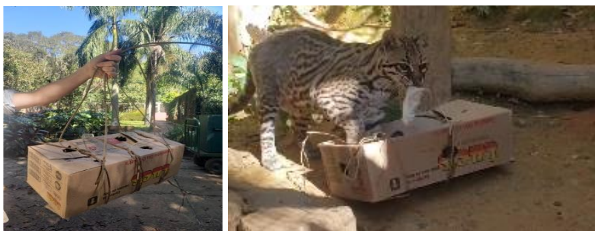
Figura 9 e 10. Execução e fornecimento de enriquecimento ambiental com caixa de papelão, folhas secas e alimentação para indivíduo de Jaguaritica do plantel ( Leopardus pardalis ) da Associação Mata Ciliar.

O setor chamado de “Reabilitação e Lobos”, era composto por espécimes de felídeos e de canídeos, como os lobos-guará ( Chrysocyon brachyurus ) em processo de reabilitação. À vista disso, foi acompanhado o tratador do setor e realizado rondas, para observação e avaliação visual dos animais do plantel, procurando lesões possíveis de visualizar a distância e alterações de comportamento. Foi possível realizar o enriquecimento ambiental para alguns indivíduos, a fim de diminuir o ócio e proporcionar bem-estar. Utilizaram-se caixas de papelão com folhas secas e com ratos, amarradas com cipós (Figura 9 e 10). Essas caixas eram então ofertadas aos animais e acompanhava-se o comportamento esperado de predação e estímulo cognitivo ao buscar a presa.