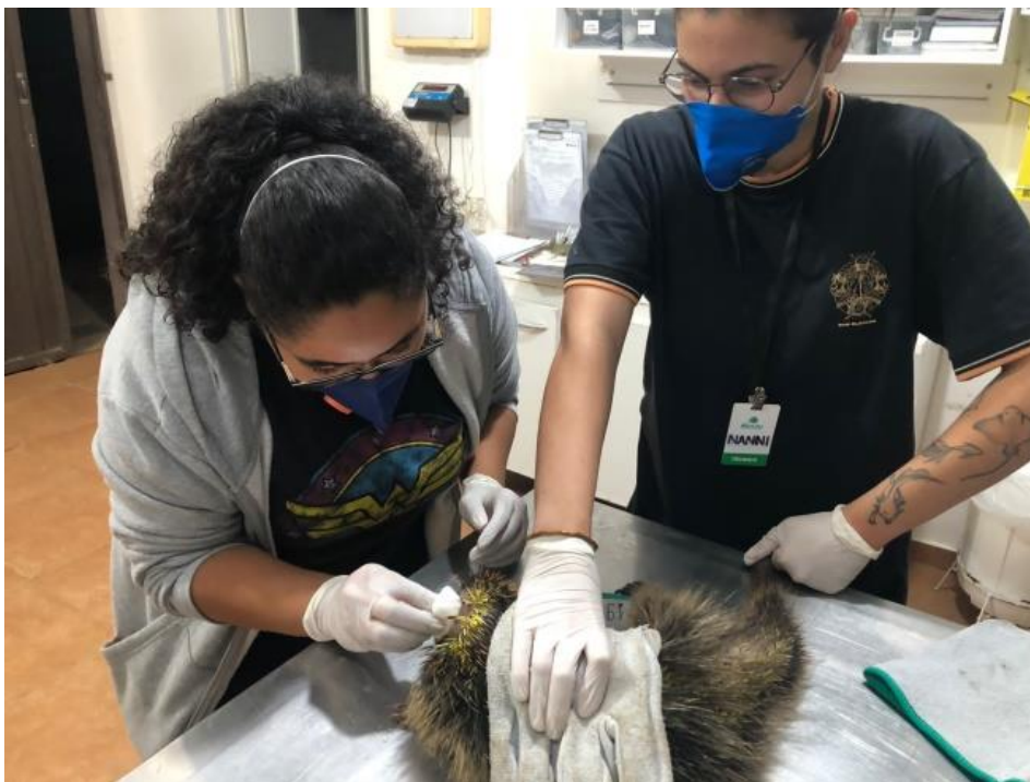
Figura 11. Limpeza de ferida em crânio em indivíduo de ouriço cacheiro ( Sphiggurus villosus ), causada por ataque de cão na Associação Mata Ciliar.

Devido ao grande número de pacientes traumatizados, com lesões cutâneas diversas, foi possível aprimorar os conhecimentos sobre manejo de feridas, pude realizar o manejo de feridas de um ouriço cacheiro ( Sphiggurus villosus ) com lesão e exposição óssea em crânio (Figura 11) e um tratamento de longo prazo em exemplar de quati ( Nasua nasua ) com lesão extensa em dorso de cauda (Figura 12), utilizava-se clorexidine degermante e açúcar cristal associados numa proporção de 2g:1g respectivamente, visando a aceleração da formação de tecido de granulação e a consequente reepitelização (Figura 13 e 14).