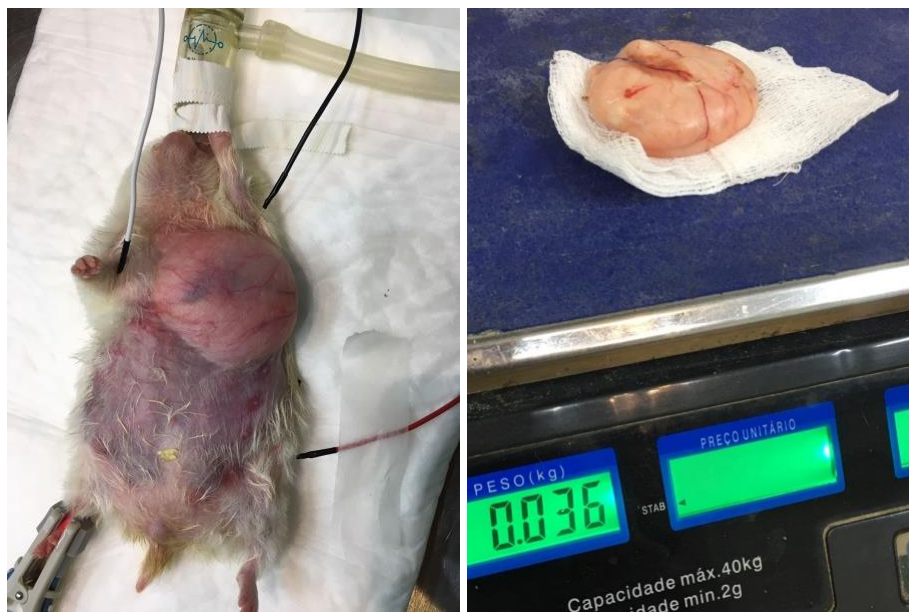
Figura 25 e 26. Realização de cirurgia para retirada de provável lipoma, visualizado em ultrassonografia na região torácica de hamster sírio ( Mesocricetus auratus ) na Clínica Amazoo Pets. A tutora não autorizou a realização do exame histopatológico.