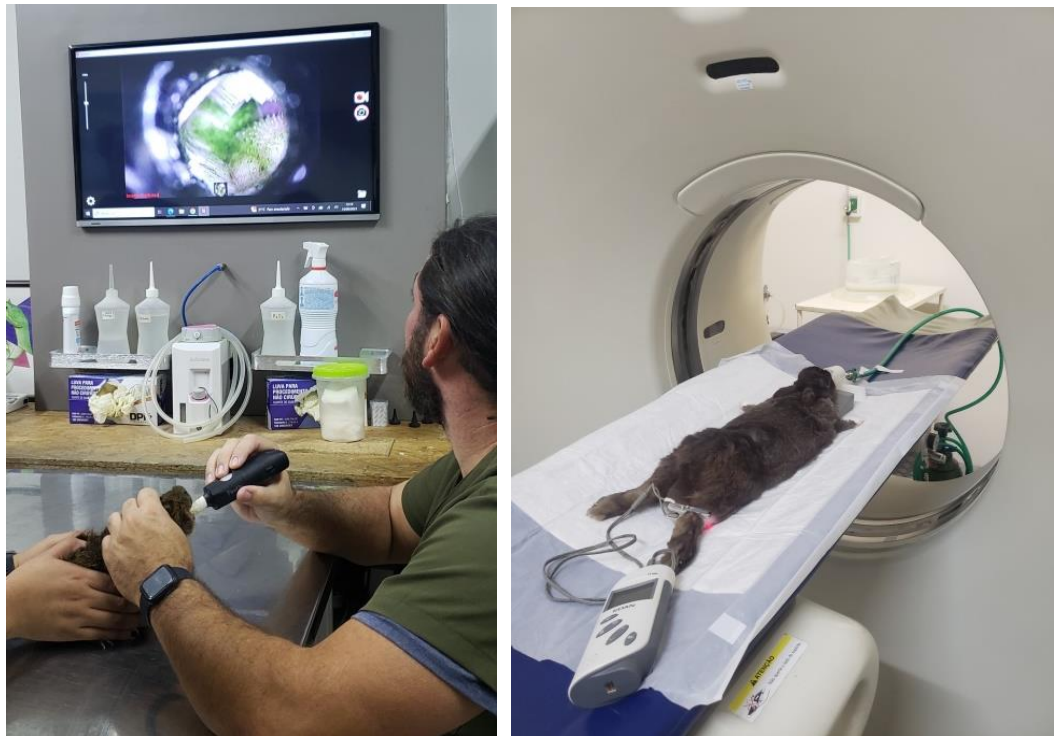
Figura 23 e 24. Realização de videoscopia para avaliação da arcada dentária em porquinho-da-índia ( Cavia porcellus ) à esquerda na Clínica Amazoo Pets. Tomografia do crânio de um coelho ( Oryctolagus cuniculus domesticus ) em uma clínica parceira, à direita na Clínica Climev Saúde Pet.

como, auxílio nas cirurgias (Figura 25 e 26), colheita de materiais para realização de exames, como fezes, sangue, urina e material purulento, além de massas e neoplasias, aplicação de fármacos, assistência na confecção de curativos pós-cirúrgicos, auxílio aos animais internados, aferição do controle ambiental necessário para as diversas espécies internadas, através de termômetros de mesa e superfície para a temperatura e hidrômetros para a umidade, tentando sempre manter a umidade acima de 45%. Além desses houve também o acompanhamento de consultas domiciliares e realização de necropsias (Figura 27).