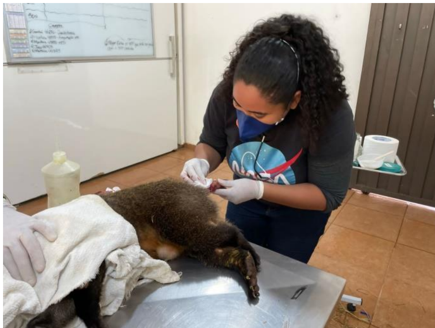
Figura 12. Limpeza de ferida em cauda, em indivíduo de quati ( Nasua nasua ), na Associação Mata Ciliar. Curativo feito utilizando clorexidine degermante e açúcar cristal.