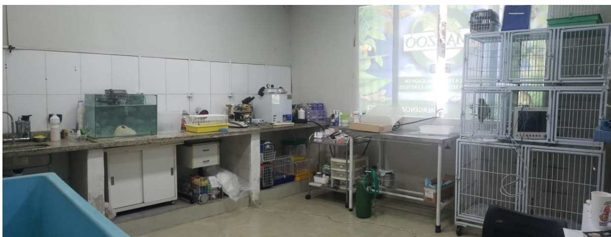
Figura 22. Internamento da Clínica Amazoo Pets.