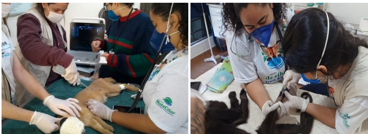
Figura 15 e 16. Manejo de um macho de gato-mourisco ( Puma yagouaroundi ) à esquerda e de uma fêmea de bugio ruivo ( Alouatta guariba ) à direita na Associação Mata Ciliar.

Durante esse procedimento, fiquei responsável pelo monitoramento anestésico do animal durante todo o manejo, que durou cerca de uma hora, a monitoração era feita através da FC, FR e temperatura retal. (Figura 15). Em outro momento, assim como descrito anteriormente também foi feito o manejo de um bugio ruivo ( Alouatta guariba ), com histórico de apatia, emagrecimento e mudança de comportamento, onde também fiquei responsável pela monitoração anestésica (Figura 16), foi feita a tentativa de coleta de sangue, mas devido ao grau alto de desidratação do animal, não foi possível. Na sequência foi feita a administração de fluidoterapia com soro fisiológico.