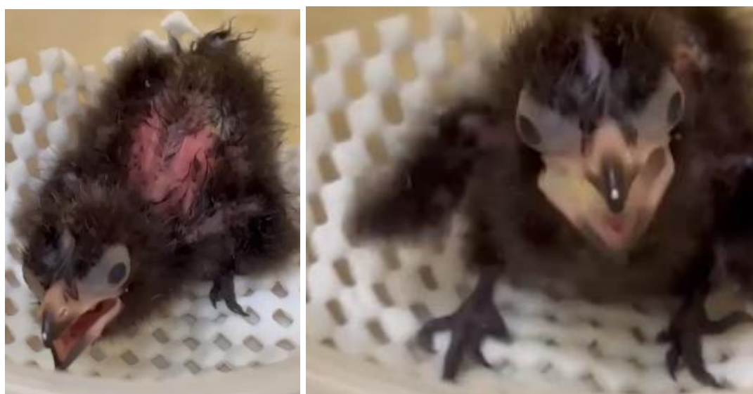
Figura 28 e 29. Filhote de turaco-de-schalow ( Tauraco schalowi ) apresentando quadro de dispneia e regurgitação.

Os dois filhotes chegaram regurgitando e desidratados, foi feito o tratamento de suporte com soro ringer com lactato e suplementação vitamínica de vitamina B (Bionew®). No filhote de turaco-de-schalow, foi colhido sangue, mas o filhote não resistiu e morreu durante a colheita, foi colhido cerca de 0,6mL de sangue para hemocultura pela veia jugular.