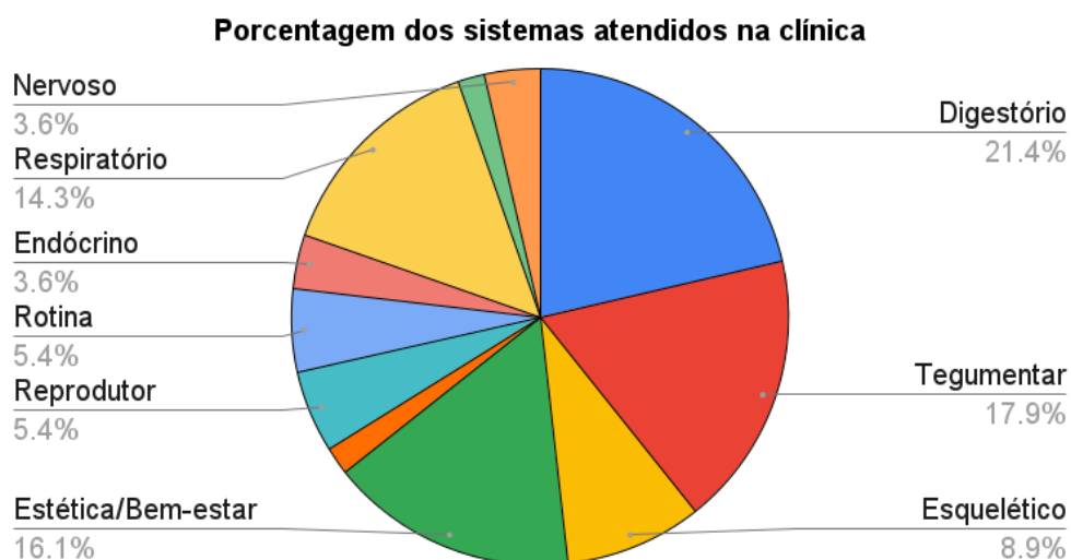
Gráfico 4. Sistemas mais acometidos de acordo com a avaliação clínica na Clínica Amazoo Pets.

De acordo com as avaliações clínicas, os sistemas mais acometidos foram o sistema digestório com 21,4%, seguido pelo sistema tegumentar com 17,9% dos casos atendidos. Na clínica, recebia-se ainda os animais para manejos de bem estar e estética, como corte de unhas, corte de asas (para evitar o voo), e tosa higiênica, esses procedimentos representaram 16,1% dos animais recebidos, como mostra no Gráfico 4.