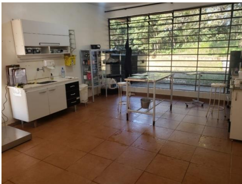
Figura 4. Sala de procedimentos e preparação dos animais do Centro Jaguaretê da Associação Mata Ciliar.