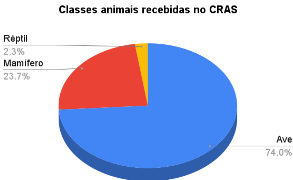
Gráfico 1. Classes de animais recebidas no Centro de Reabilitação de Animais Silvestres da Associação Mata Ciliar.

Acompanhei a admissão de animais silvestres no setor da triagem durante o período de 01 de junho a 31 de julho de 2023. Durante esse período foram recebidas 88 espécies de três classes de animais. No gráfico 1, podemos ver a casuística de classe animal, sendo as aves a maior porcentagem de recebimentos (74,0%), seguido pelos mamíferos (23,7%) e os répteis com a menor casuística do estágio (2,3%).