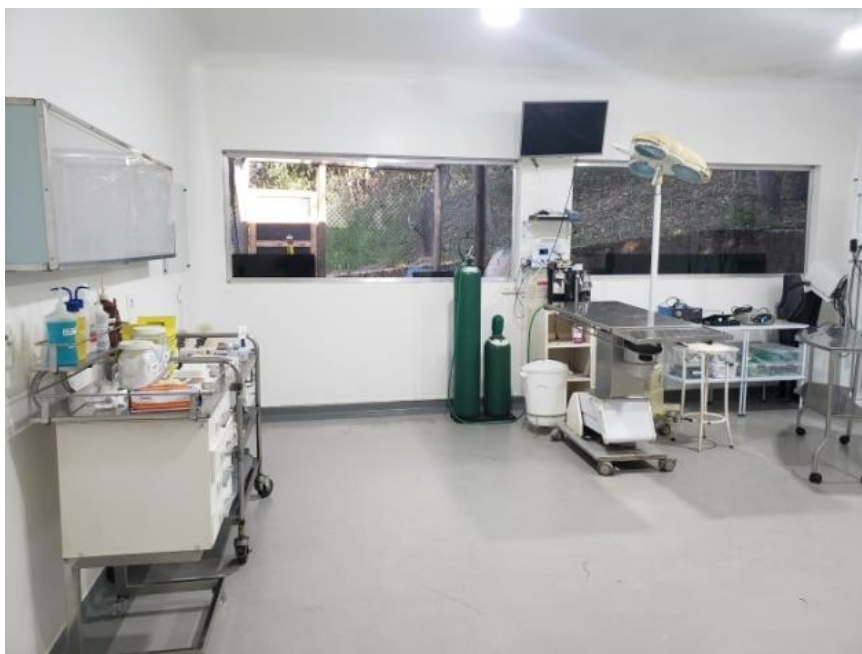
Figura 5. Centro cirúrgico do Centro Jaguaretê da Associação Mata Ciliar.