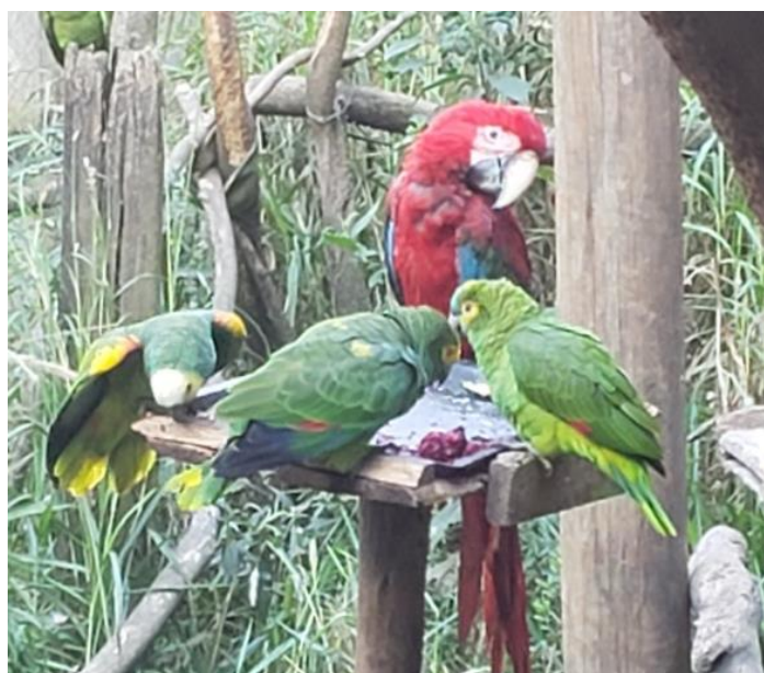
Figura 7. Indivíduos de arara vermelha ( Ara chloropterus ) e papagaios verdadeiros ( Amazona aestiva ) se alimentando no período da manhã em um recinto da Associação Mata Ciliar.

O alimento dos animais era preparado em cozinha destinada para esse fim, de modo que aqueles que consumiam a dieta pela manhã, tinham a sua alimentação priorizada e preparada no dia anterior e armazenada nas geladeiras, e a dieta dos animais que comiam à tarde era preparada pela manhã. Os itens da dieta dos animais eram levados em bandejas e recipientes diversos, e transportados por carrinhos de mão até o recinto, o preparo e fornecimento do alimento era feito de acordo com as particularidades de cada espécie animal.