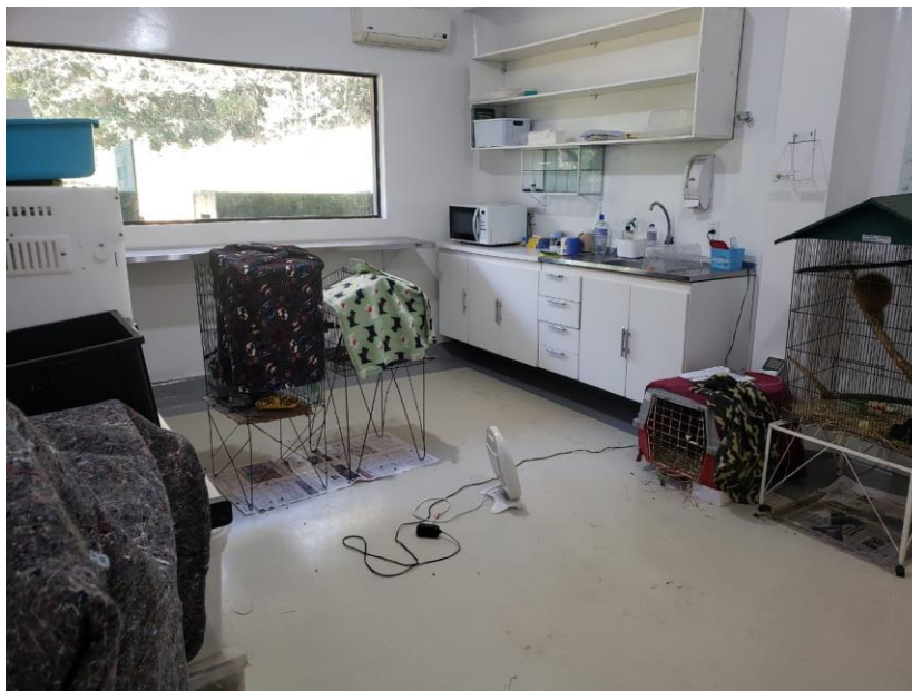
Figura 6. Maternidade localizada dentro do Centro Jaguaretê da Associação Mata Ciliar, equipada, com pia, armários, aquecedores e duas Unidades de Terapia Animal