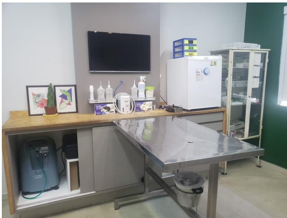
Figura 21. Sala de procedimento e cirurgia da Clínica Amazoo Pets.