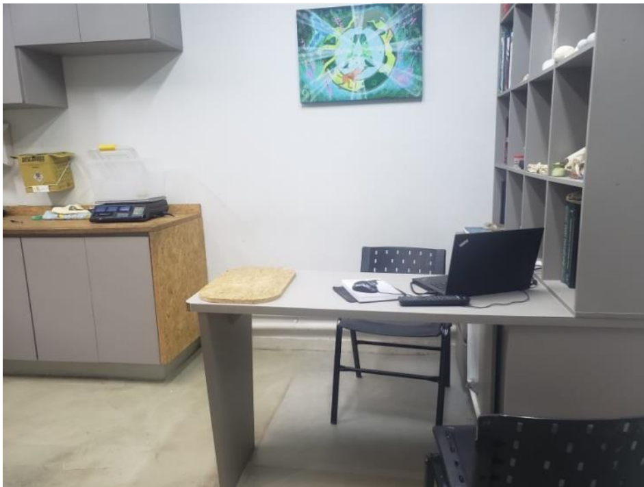
Figura 20. Consultório da Clínica Amazoo Pets.

O local possui recepção, estoque, lavanderia, copa, dois banheiros, um consultório (Figura 20), uma sala de procedimento e cirurgia, equipada com monitores multiparamétricos, materiais cirúrgicos e aparelho de anestesia inalatória (Figura 21), uma internação adaptada para as diversas espécies atendidas (Figura 22) e uma sala de necropsia.