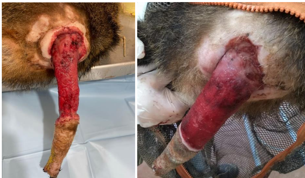
Figura 13 e 14. Evolução em 10 dias da ferida em cauda, em indivíduo de quati ( Nasua nasua ), na Associação Mata Ciliar. Curativo feito utilizando clorexidine degermante e açúcar cristal.