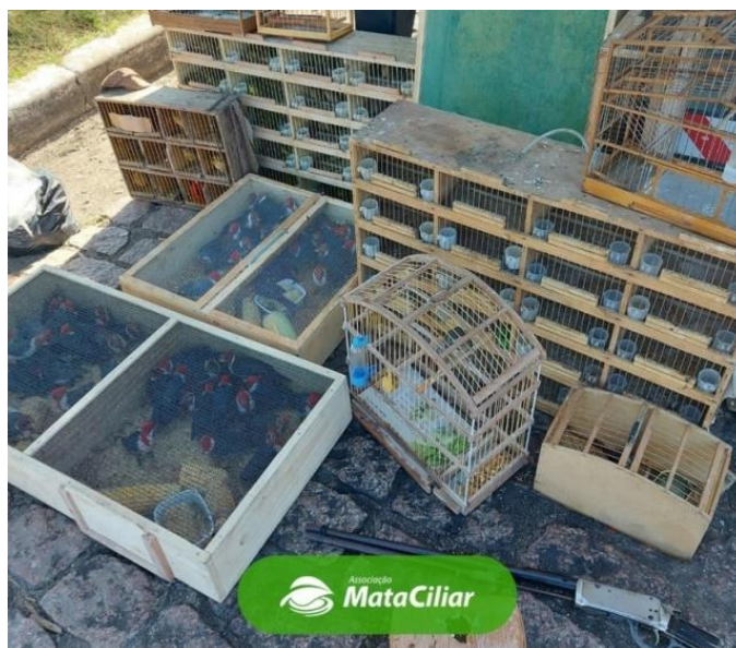
Figura 19. Recebimento de uma apreensão na Associação Mata Ciliar de 206 aves em condições precárias, vítimas de tráfico.