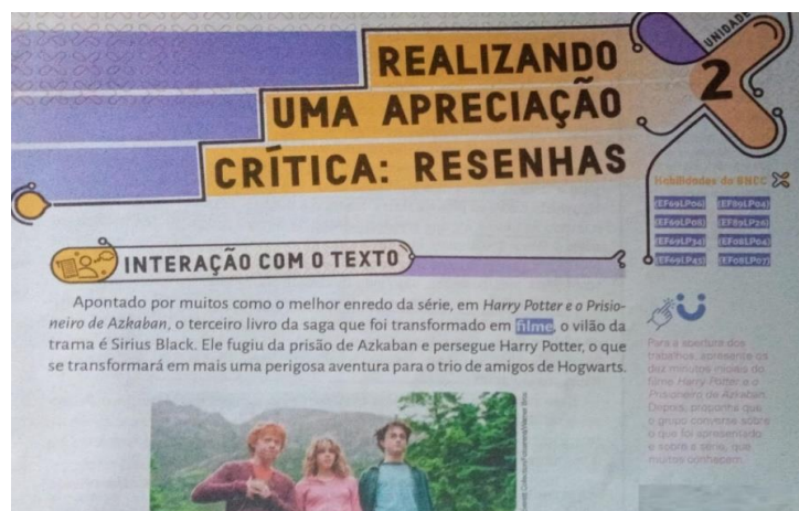
Figura 1 – Abertura da apresentação do gênero resenha crítica

Em relação à resenha crítica, o livro a aborda como um gênero que combina descrição, interpretação e avaliação, destacando seu papel na formação de leitores capazes de argumentar e construir opiniões fundamentadas. A escolha da linguagem é predominantemente secundária, no sentido bakhtiniano, pois o texto mediador oferece uma análise reflexiva da obra resenhada, ao mesmo tempo em que ensina os alunos a se posicionarem criticamente. Essa abordagem didática posiciona a resenha crítica como um espaço de diálogo entre o estudante, a obra e o contexto cultural, estimulando a construção de sentidos compartilhados.