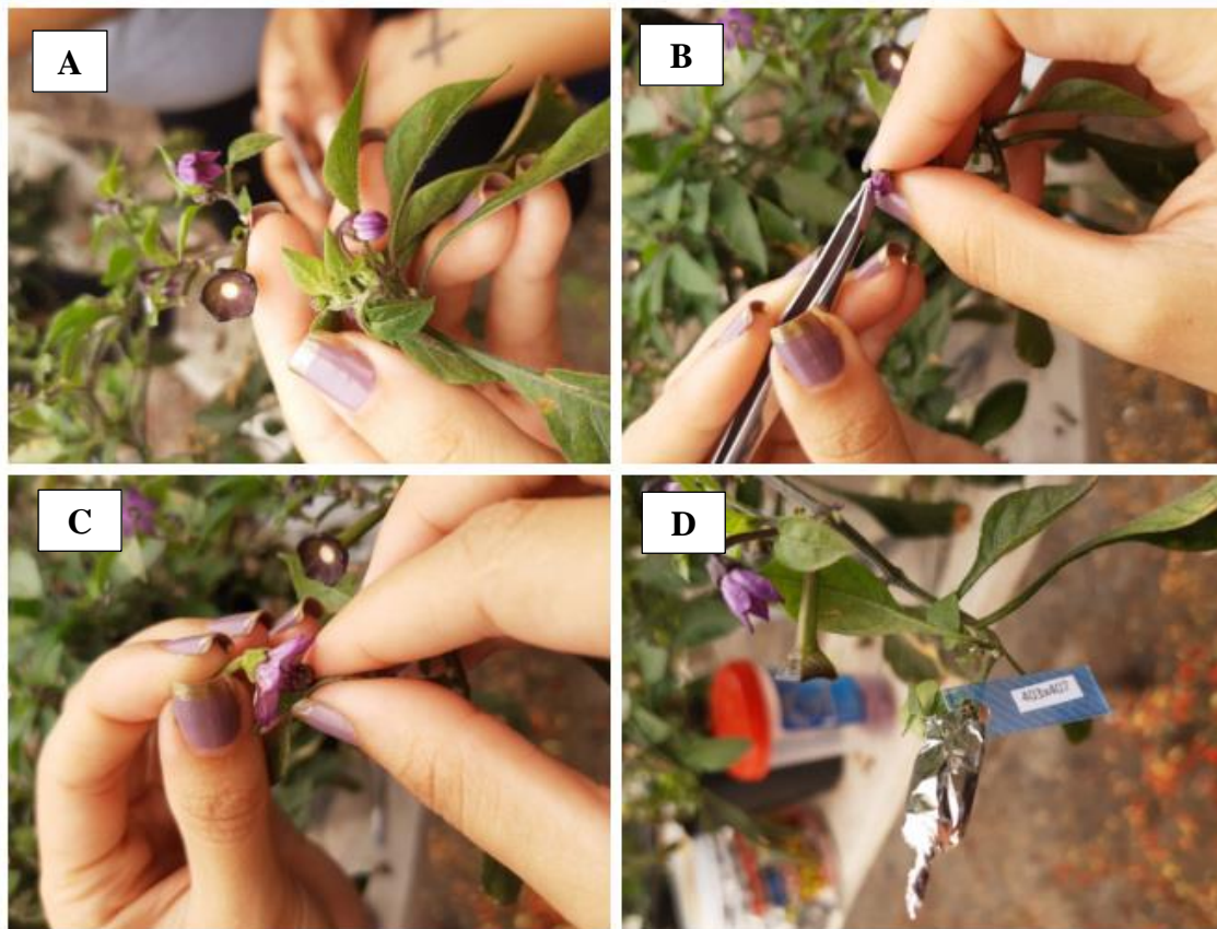
Figura 17 – Botão com estágio balão (A); remoção da corola e anteras (B); transferência do pólen para o estigma (C); etiquetagem e proteção (D).