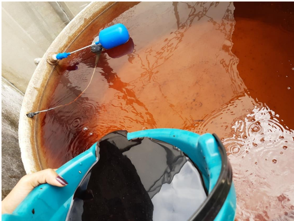
Figura 10 - Fertilizante adicionado a caixa d'água