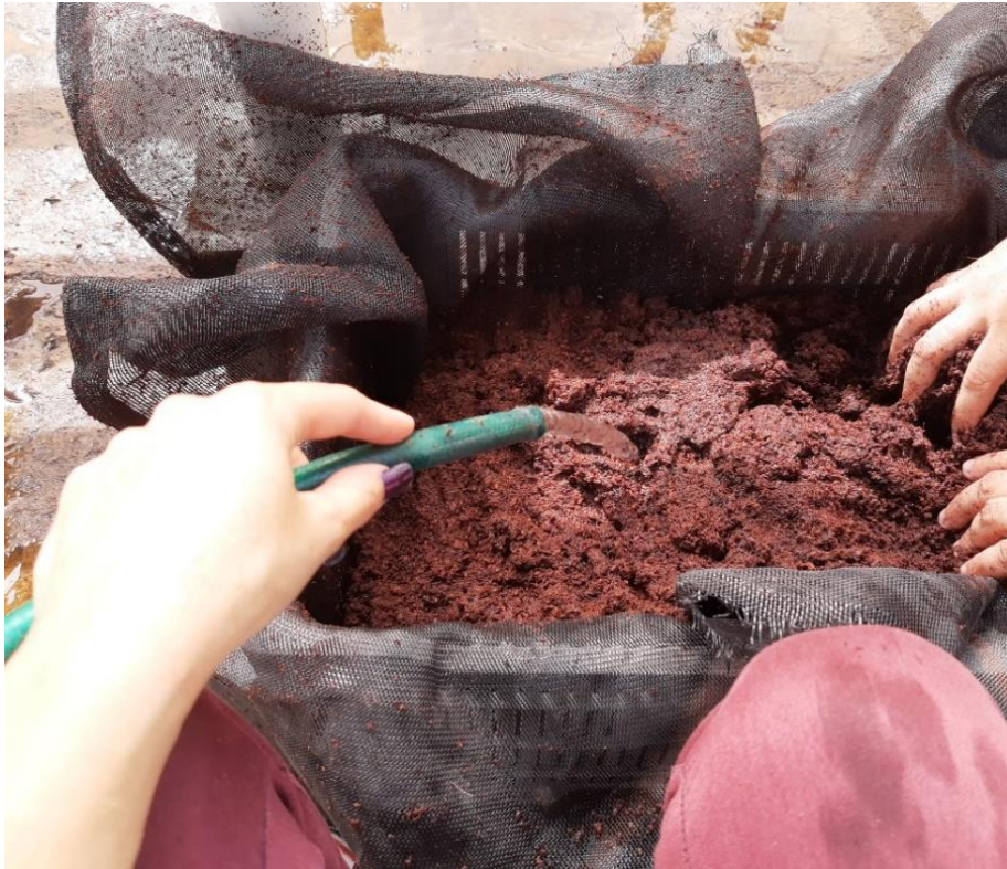
Figura 3 - Lavagem do pó de coco

água corrente com um auxílio de uma mangueira. O processo de lavagem realizado objetiva reduzir a concentração de tanino encontrado no pó de coco (Fig. 3).