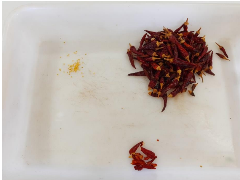
Figura 6 - Extração de sementes

Foi realizada a extração das sementes dos frutos das pimenteiras que foram colhidas e acondicionadas em envelopes identificados, passando por um período de secagem exposto ao sol. Os frutos foram abertos paralelamente ao comprimento com o auxílio de uma faca e as sementes foram retiradas dentro da bandeja (Fig. 6), sendo as sementes contaminadas por fungos descartadas. As sementes extraídas eram colocadas em envelopes identificados e armazenados.