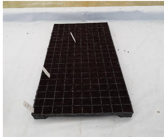
Figura 5 - Bandeja na bancada de irrigação por capilaridade