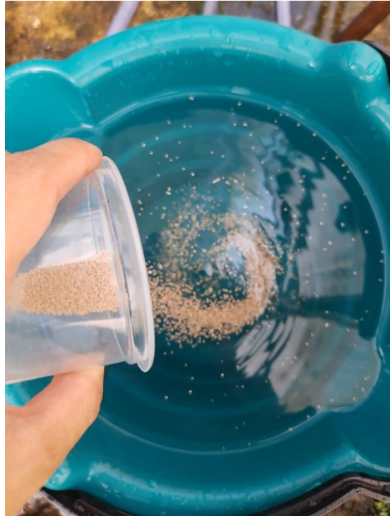
Figura 20 - Preparo da solução sistêmica