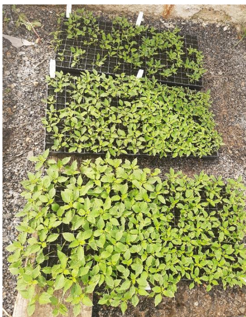
Figura 6 - Mudas dos genótipos

As mudas foram retiradas com cuidado da bandeja de sementeira para não danificar as raízes e colocadas em bandejas com a identificação do seu genótipo. Consecutivamente, foi feito o manuseio do solo, abrindo covas para acondicionar as mudas e ajustando o substrato para a muda ficar aderida.