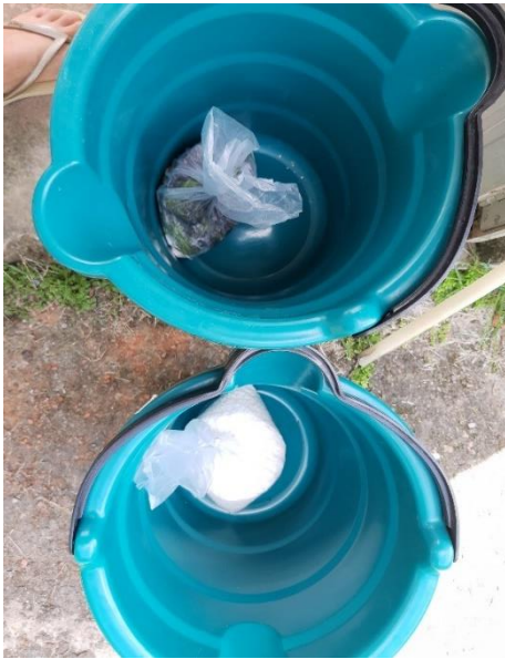
Figura 8 - Fertilizantes já pesados