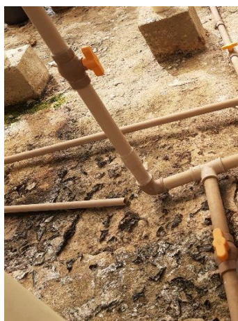
Figura 12 - Registros