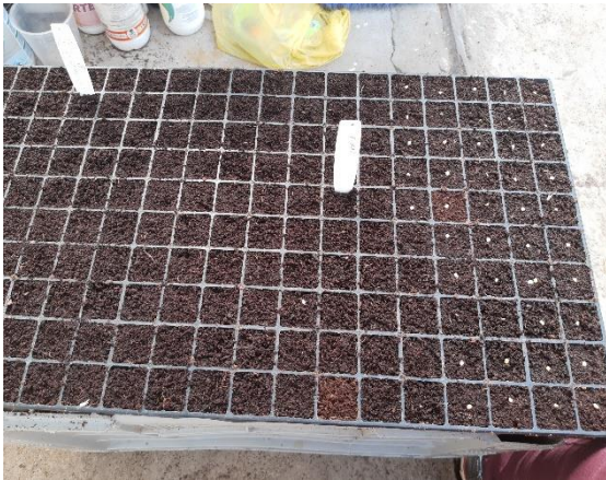
Figura 4 - Semeadura