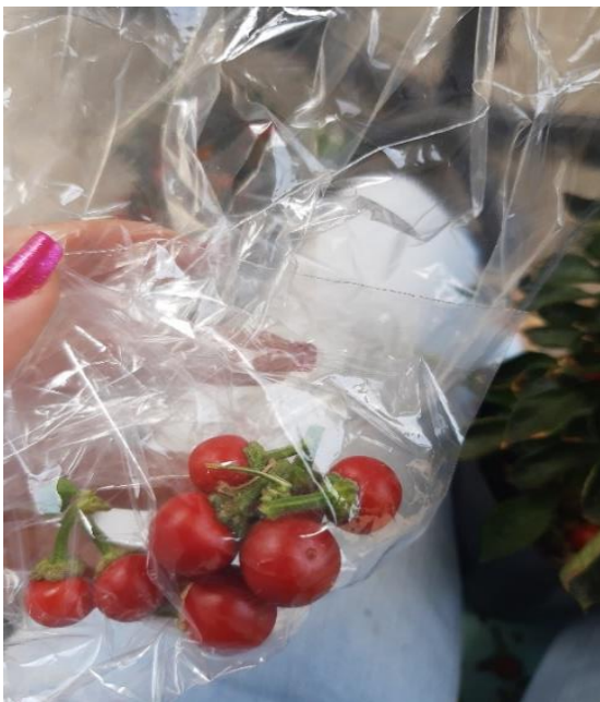
Figura 14 - Coleta de frutos para as avaliações.

No laboratório, sucedeu a contagem do número de sementes extraídas e a quantidade de lóculos dos nove frutos por cada genótipo. As medições referentes a comprimento, espessura e diâmetro foram realizadas com o auxílio de um paquímetro. A pesagem da massa fresca dos frutos foi realizada em uma balança analítica e, conseqüentemente, levados à estufa para a determinação do peso da massa seca posteriormente (Fig. 16).