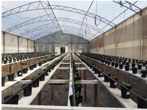
Figura 2 - Casa de vegetação (experimento)