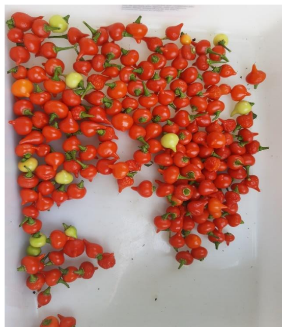
Figura 15 - Contagem do número de frutos