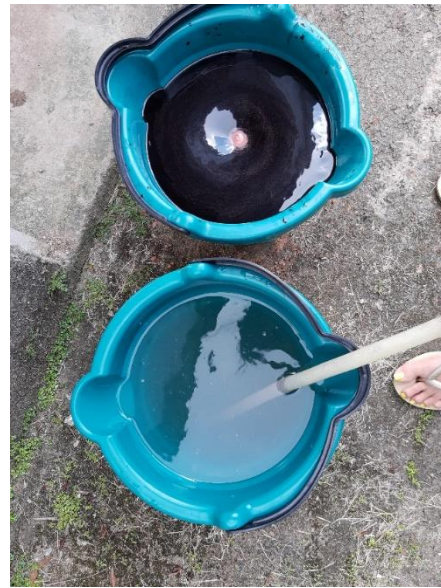
Figura 9 - Fertilizantes dissolvidos