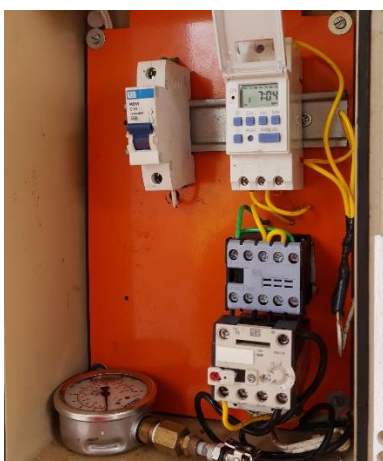
Figura 11 - Timer digital

Vistorias no nível de solução na caixa d'água foram feitas para que não faltasse para a irrigação. Se o nível estivesse baixo, perto do tubo de sucção, abria-se o registro para a entrada de água na caixa. Quando a caixa estava cheia e acabado de ser feita a solução nutritiva, fechava-se o registro para não entrar água, afim de não diminuir a concentração da solução pela entrada de água conforme fosse reduzindo o nível da boia.