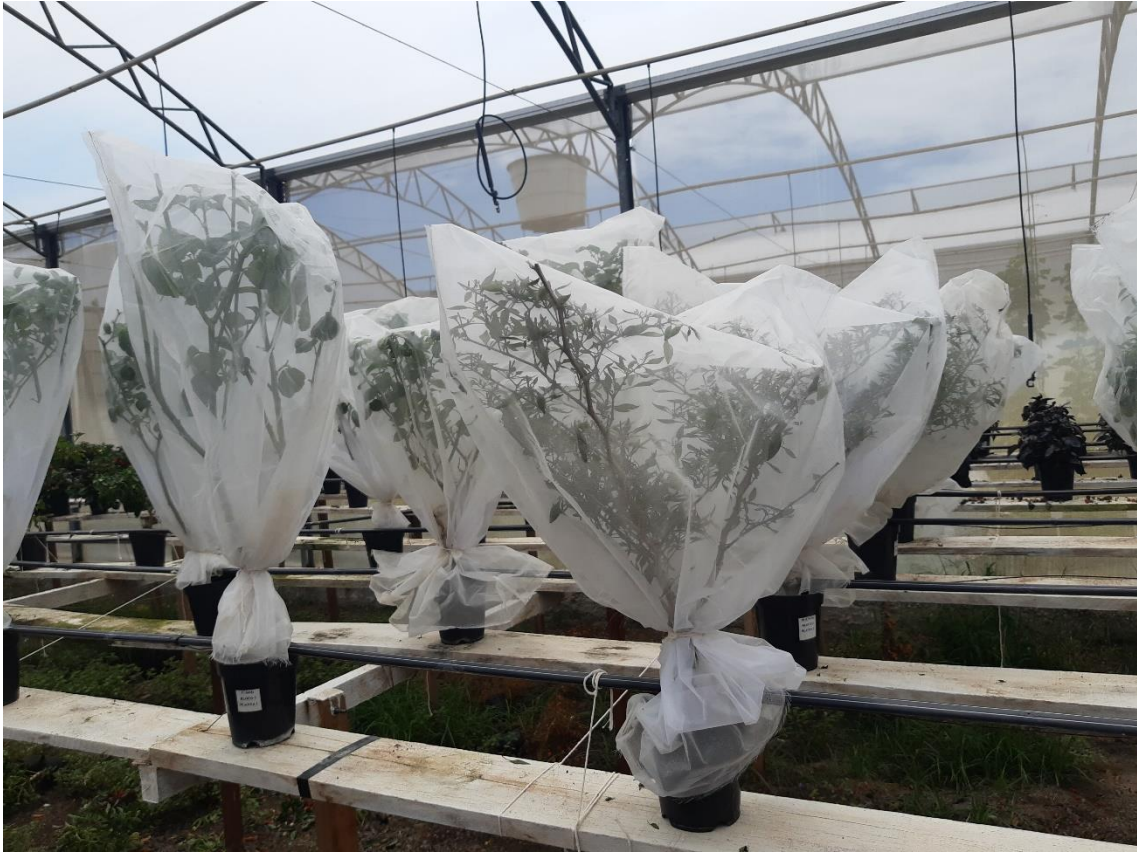
Figura 18 - Proteção