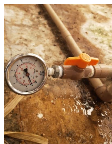
Figura 13 - Aferição da pressão