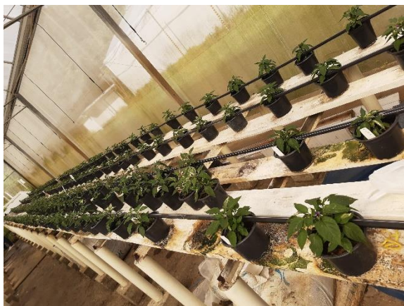
Figura 1 - Casa de vegetação (produção)

O estágio supervisionado foi realizado no Instituto Agrônomo de Pernambuco (IPA), mediante o acompanhamento de boa parte do experimento no programa de melhoramento de pimenteiras ornamentais, conduzido em casa de vegetação. O trabalho foi conduzido em duas casas de vegetação, onde uma servia para produção de mudas, mantimentos de populações e o cultivo de outras culturas, como goiabeiras, medicinais e orquídeas (Fig. 1) e a outra era destinada ao experimento e as populações para cruzamentos ( Fig. 2).