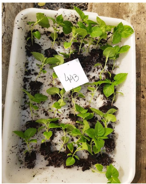
Figura 7 - Retirada das mudas para transplante