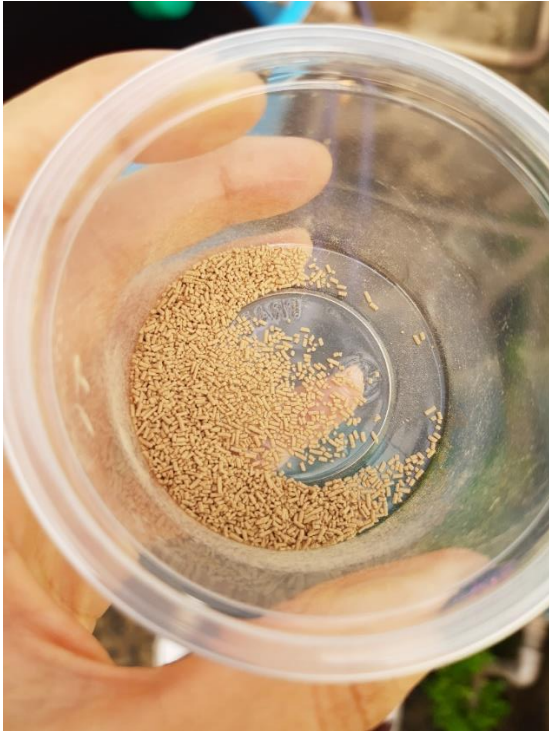
Figura 19 - Inseticida sistêmico granulado