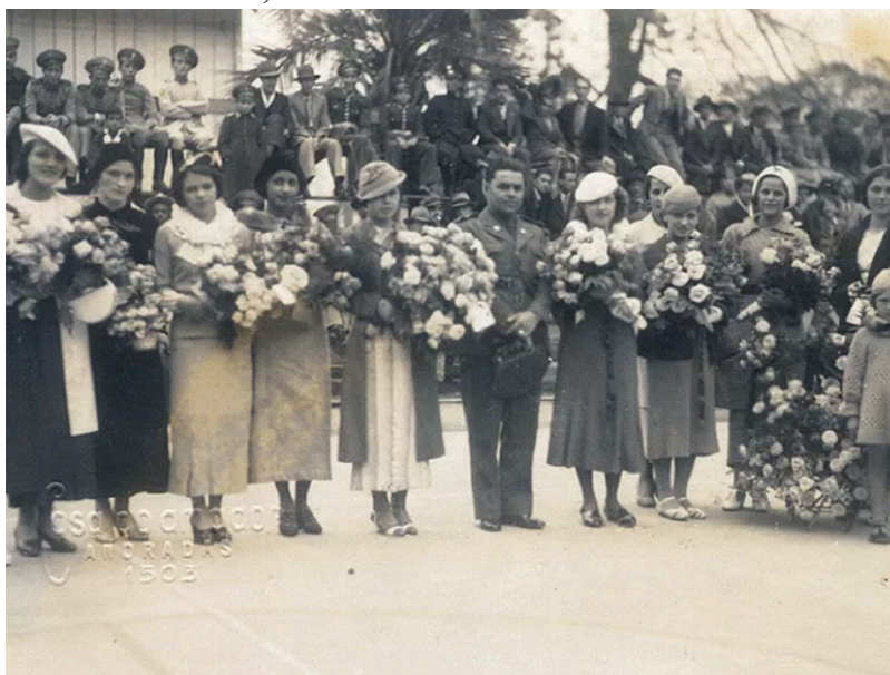
Mulheres receberam flores na primeira festa de Dia das Mães no Brasil, em 1918