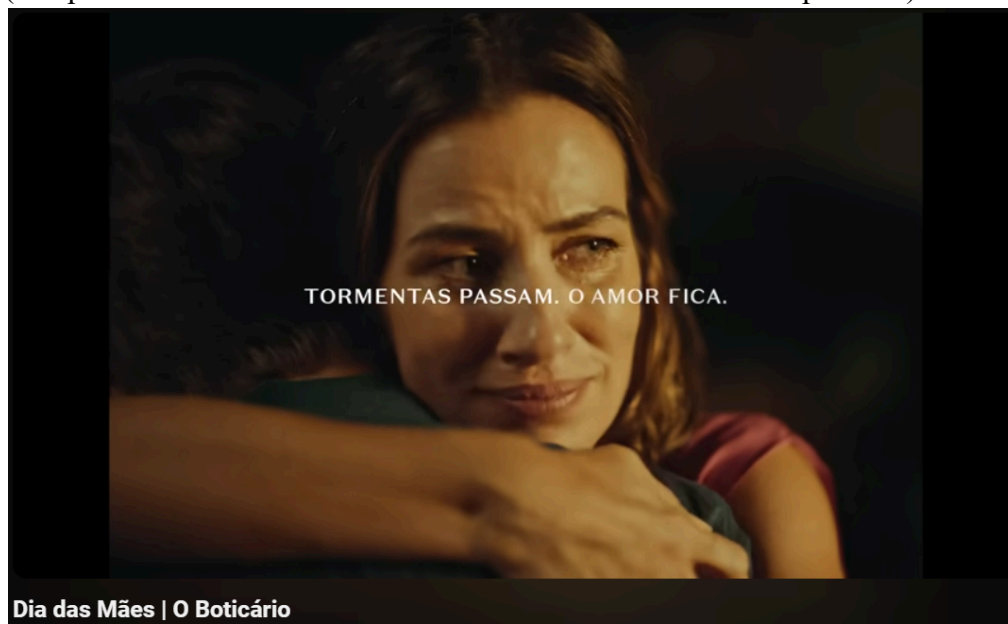
Figura 9 – Print retirado do vídeo publicado na página do Boticário no Youtube (campanha do dia das mães de 2024 - Tormenta: O Amor Sempre Fica).