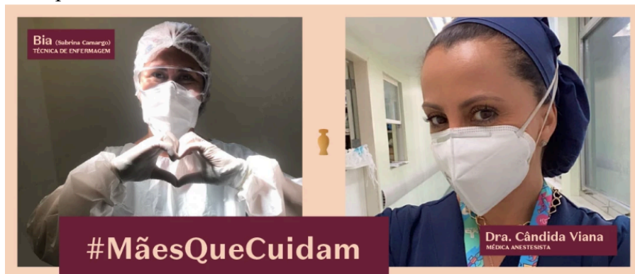
Figura 4 – Imagem retirada da reportagem da meio&mensagem sobre a campanha da Boticário