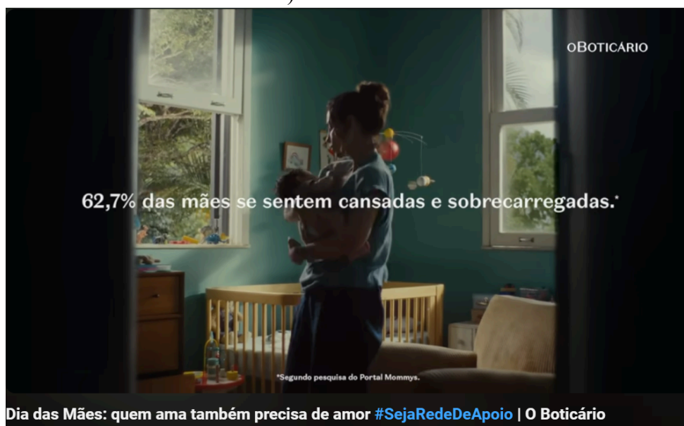
Figura 8 – Print retirado do vídeo publicado na página do Boticário no Youtube (campanha do dia das mães de 2023 - #SejaRedeDeApoio: Quem Ama Também Precisa de Amor)