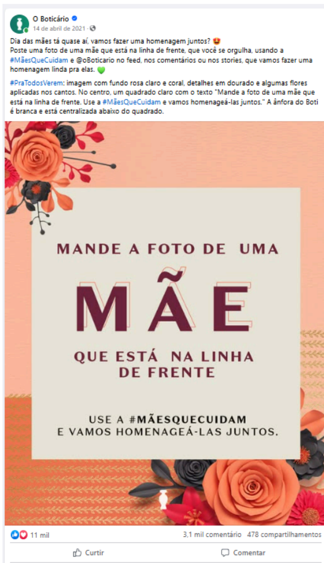
Figuras 6 – Imagem retirada da página do Facebook do O Boticário sobre a campanha do dia das mães de 2021

Fonte: Disponível em: https://www.facebook.com/oboticario/posts/dia-das-m%C3%A3es-t%C3%A1-quase-a%C3%AD-vamos-fazer-uma-homenagem-juntos-poste-uma-foto-de-uma-/5388641594540760/ (Acesso em: 08 ago. 2024)