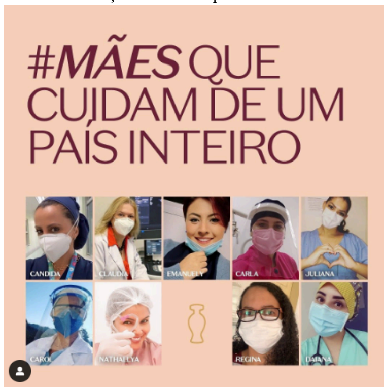
Figuras 5 – Imagem retirada da página do Instagram da Rede Comunicação sobre a campanha da Boticário