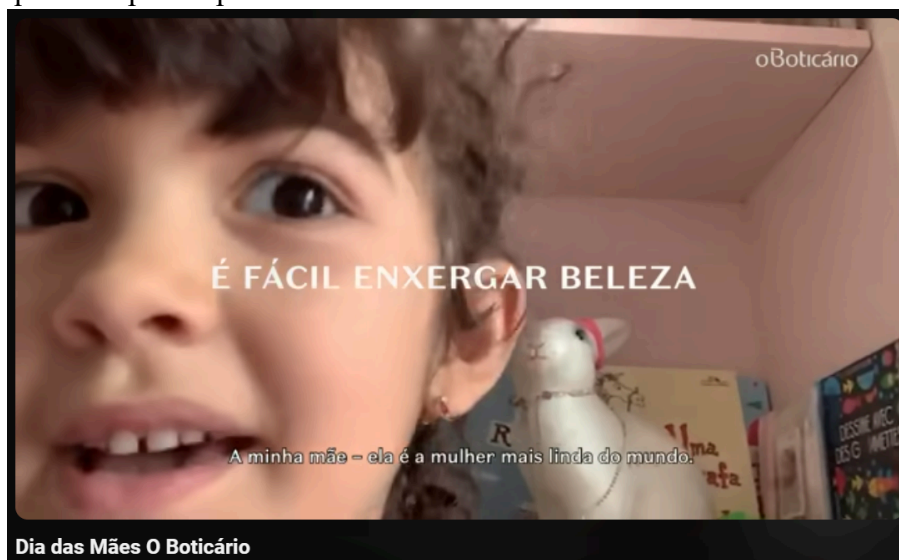
Figura 3 – Print retirado do vídeo publicado na página do Boticário no Youtube campanha do dia das mães de 2020 – #FicaemCasa: Mães que se Superam pelos Filhos