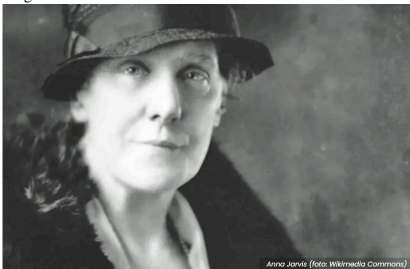
Figura 1 – Anna Jarvis.

Foto: Wikimedia Commons. Fonte: Disponível em: https://mediatalks.uol.com.br/2024/05/12/quem-criou-o-dia-das-maes-conheca-a-historia-de-anna-jarvis/ (acesso em: 29 Jul. 2024).