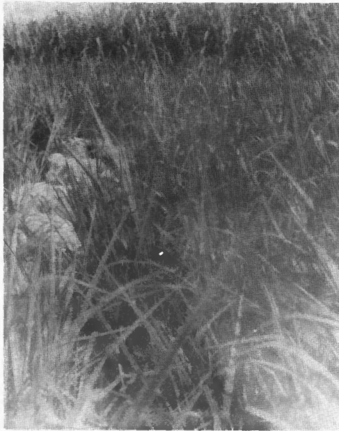
Figura 1 – Área plantada com capim mineirão ( Pennisetum purpureum ), contígua ao piquete, onde os cordeiros pastavam pela manhã.