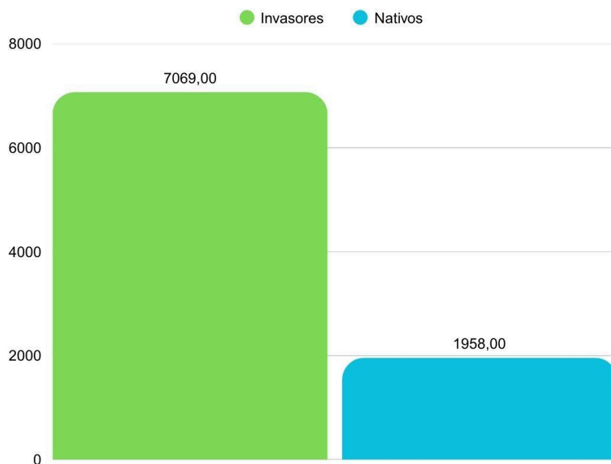
Figura 2. Abundância absoluta de drosofilídeos nativos e exóticos coletados na área do Parque de Cunhambebe em Angra dos Reis, Rio de Janeiro, Brasil.

A análise da composição das populações revelou uma predominância de espécies exóticas-invasoras, que corresponderam a 78,16% do total de drosofilídeos amostrados (figura 2).