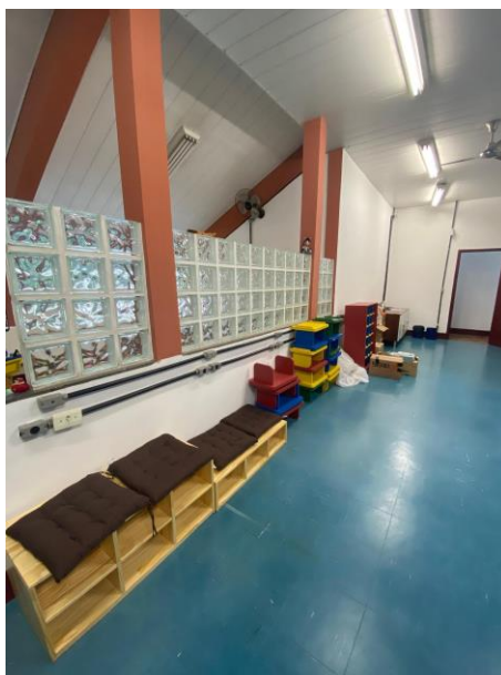
Figura 5 - Organização e mobiliário da Bebeteca da UFMG 2