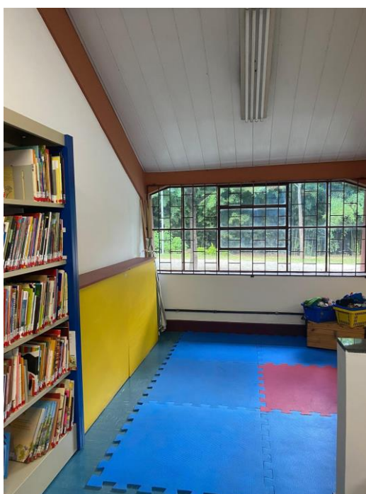
Figura 1 - Ambientes de leitura e convivência da Bebeteca da UFMG

O espaço físico da Bebeteca da UFMG foi sendo construído de maneira gradual, enfrentando limitações estruturais, mas sempre guiado por uma intencionalidade formativa e estética. A conquista da Casa da Infância marca uma nova etapa na consolidação da proposta da bebeteca, oferecendo melhores condições para o desenvolvimento das práticas de leitura literária voltadas a infância. 1