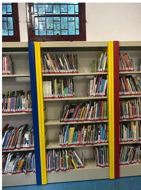
Figura 3 - Acervo 2