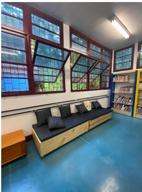
Figura 4 - Organização e mobiliário da Bebeteca da UFMG 1