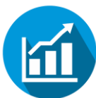
Figura 1: IPTU lançado x arrecadado (2019 – 2023)