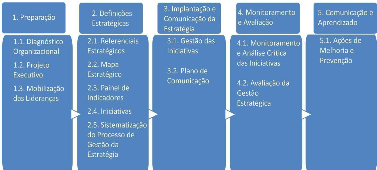
Figura 4: O Processo de Aplicação da Metodologia BSC para a Administração Pública