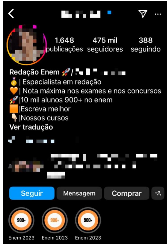
Imagem 01: Biografia do @professordigital

mais credibilidade, especialmente quando são apontados os resultados, em números, de seus estudantes (10 mil alunos obtiveram mais de 900 pontos na redação do Enem).