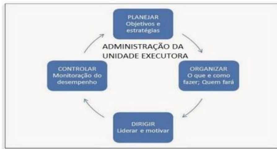
Figura: 3 Estrutura da Administração de UEX