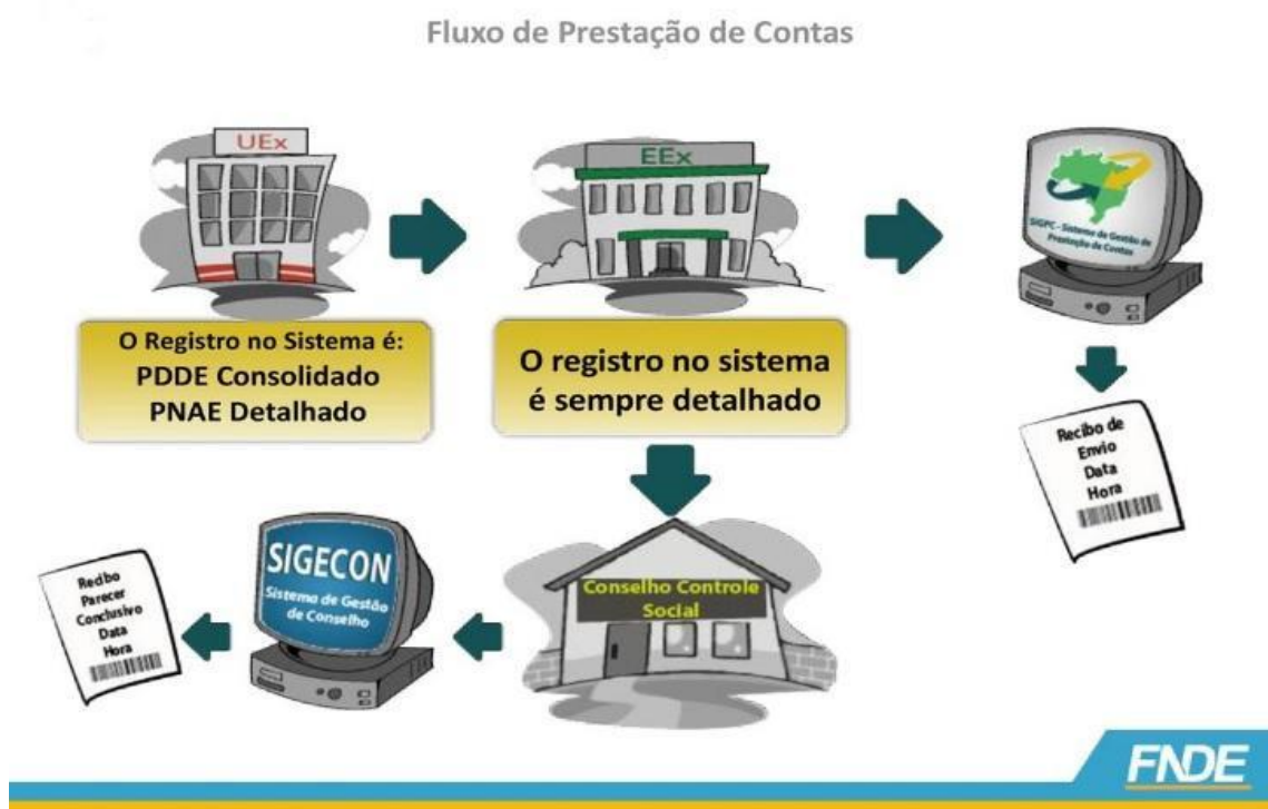
Figura 4 - Fluxo de prestação de contas

O Relatório de Auditoria encontra-se dividido em duas partes: Resultados dos Trabalhos, que contempla a síntese dos exames e as conclusões obtidas; e Achados de Auditoria, que contém o detalhamento das análises realizadas. As evidências de auditoria são obtidas mediante aplicação de procedimentos de auditoria, que são os testes de observância, também chamados de testes de controle e os testes substantivos. Nos testes de observância, os tipos de testes utilizados foram os testes de segregação de funções, o exame documental, inquérito, contagem física, conferência de cálculos e verificação da integridade.