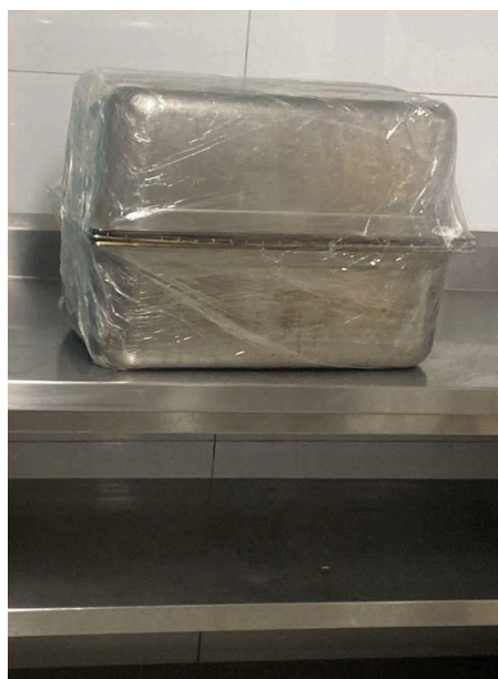
Figura 12: Processo de defumação do atum no restaurante Ruizito.

A defumação (figura 12) é um dos métodos de conservação de alimentos mais antigos, atuando na preservação por meio da redução da atividade da água, além da ação antimicrobiana e antioxidante dos compostos presentes na fumaça, como fenois, aldeídos, cetonas, hidrocarbonetos e ésteres, que inicialmente se depositam na superfície do alimento e depois, penetram sua estrutura muscular. O processo mais comum é da defumação a frio, realizada em temperaturas que variam entre 25°C e 30°C (Figueiredo, 2016).