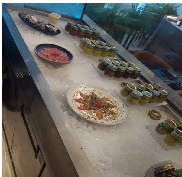
Figura 3: Vitrine do bar frio do restaurante Ruizito em Recife/PE

O bar frio é uma seção dedicada à finalização de pratos que na sua maioria não requerem cocção em altas temperaturas. É uma área responsável pela montagem de entradas frias, carpaccios e ceviches, além da produção de molhos frios e emulsões que vão acompanhar boa parte dos pratos que saem de lá. É composto por bancadas refrigeradas, refrigeradores e um congelador, considerando que os insumos trabalhados no bar frio são frescos e bastante perecíveis. Há também um aquário para as ostras e lambretas servidas no restaurante.