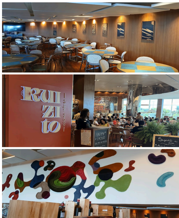
Figura 4: Ambientação do Salão do Ruizito.

Já para a cozinha, existem duas entradas que ligam ao salão, facilitando a circulação dos profissionais, e garantindo um fluxo operacional mais eficiente. O espaço da retaguarda é dividido em setores, sendo eles: