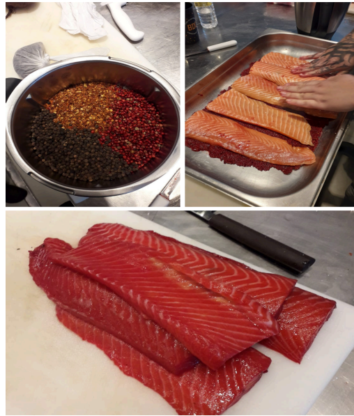
Figura 9: Processo de cura do salmão