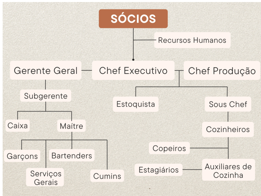
Figura 5: Organograma do Ruizito