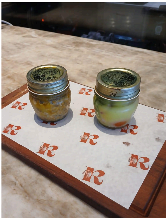
Figura 16: Mini conservas produzidas no Ruizito

apresentadas sobre uma tábua de madeira, e acompanhava fatias de torradas com um fio de azeite.