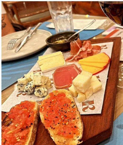
Figura 7 : Tábua de frios