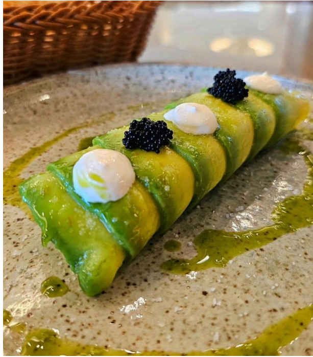
Figura 14: Canelone de abacate