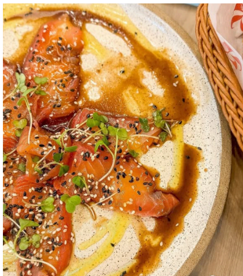
Figura 8: Salmão curado

Para o preparo do salmão curado (figura 8), é utilizado o método de cura seca, que é uma técnica de conservação milenar, combinada com um processo de aromatização por dry rub , e que consiste em envolver o peixe com sal e outros condimentos, o que retira a umidade ao mesmo tempo em que parte do sal é absorvida pela carne. Esse método permite uma absorção homogênea dos temperos e também ajuda a definir a textura do peixe (Durham, 2001).