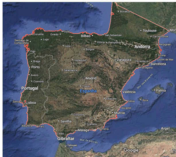
Figura 1: Península Ibérica