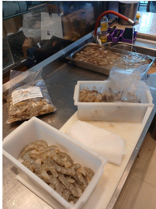
Figura 6: Pré-preparo do camarão

limpando as tripas que percorrem as costas do camarão com o auxílio de um palito de maneira que fosse melhor mantida a integridade do crustáceo.