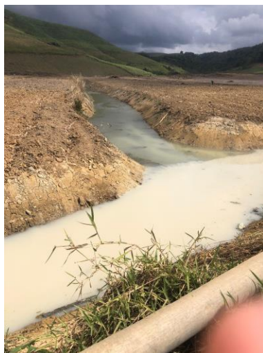
Figura 14 – Drenagem subterrânea

Para mitigar o excesso de umidade nas áreas de várzea, que compromete a oxigenação radicular, a usina utiliza uma técnica de drenagem subterrânea com bambus seccionados e manta, como pode ser visualizado na Figura 14, garantindo o escoamento do excesso de água e mantendo o alto potencial produtivo destas áreas.