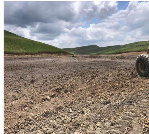
Figura 4 – Solo pós-preparo