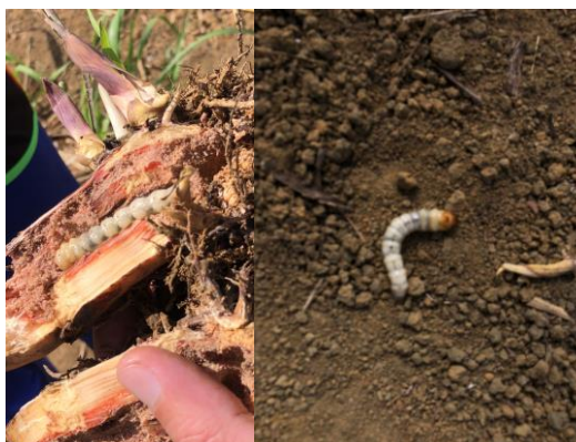
Figura 15 - Análise de infestação de Broca-da-cana