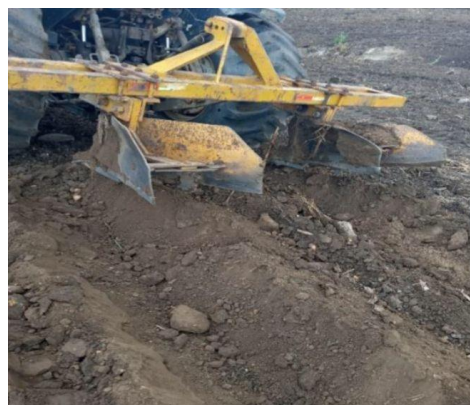
Figura 5- Sulcador