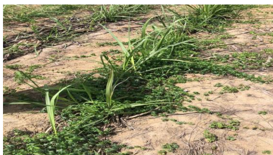
Figura 20 – Planta daninha enrolada no melão

No grupo das plantas daninhas de folhas largas, destacam-se espécies como a corda-de-viola ( Ipomoea spp. ) (Figura 20) de hábito trepador, que se enrosca no dossel da cana, provocando tombamento e causando perdas significativas durante a colheita mecanizada, e o melão-de-são-caetano ( Momordica charantia ), competidor agressivo, especialmente em áreas de reforma de canavial. Entre as ciperáceas, a tiririca ( Cyperus rotundus ) merece atenção especial por ser considerada uma das plantas daninhas mais problemáticas em escala mundial, em função de seu extenso sistema de bulbos subterrâneos, o que demanda estratégias específicas de manejo, com ênfase no controle em pré-emergência por meio do uso de herbicidas como a sulfentrazone.