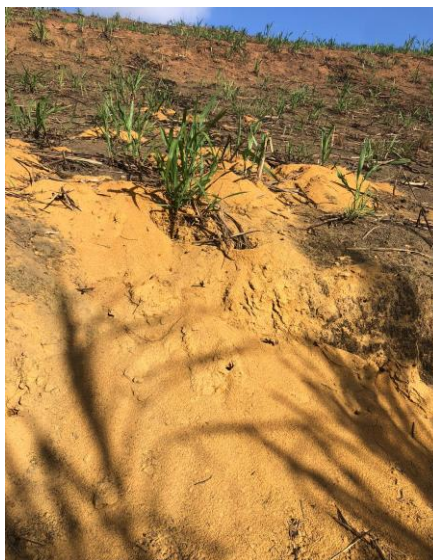
Figura 17 - Formigueiro

inseticidas sistêmicos aplicados de maneira localizada, na Figura 17 pode-se observar formigueiro encontrado.