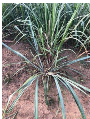
Figura 19 – b) Capim-colonião ( Panicum maximum )