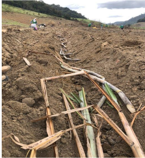
Figura 7 - Plantio duplo acorrentado