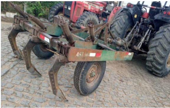
Figura 1 – Subsolador