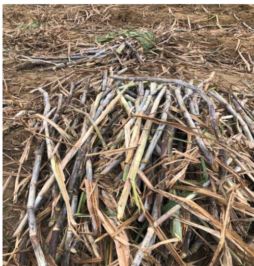
Figura 6- Cana semente para plantio

Para o plantio, são utilizados colmos-semente com idade média entre seis e oito meses, selecionados com base em critérios de sanidade, vigor vegetativo e ausência de danos mecânicos ou fitossanitários (Figura 6). O corte da cana-semente é manual, prática adotada para minimizar injúrias às gemas e preservar o potencial de brotação. Após o corte, os colmos são transportados em carretas até as frentes de plantio, onde ocorre a distribuição manual no interior dos sulcos e o fracionamento em rebolos contendo, em média, de três a quatro gemas viáveis.