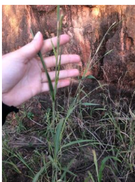
Figura 19 – a) Capim-camalote ( Rottboellia cochinchinensis )