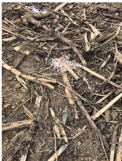
Figura 11 – Adubação em socaria (14-00-18)