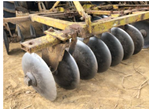
Figura 2 – Grade de discos