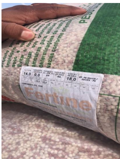
Figura 10 – Adulbo NPK para fundação

A estratégia de adubação adotada pela usina caracteriza-se pela elevada precisão técnica e pelo rigor no cuidado operacional, fatores que contribuem diretamente para a eficiência do uso de nutrientes e para a sustentabilidade do sistema produtivo. No momento da implantação do canavial, a adubação de fundação é realizada diretamente no sulco de plantio, com a aplicação de aproximadamente 600 kg ha -1 da formulação NPK 14-00-18 (Figura 10).