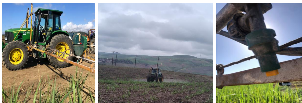
Figura 21 – Sistema de pulverização utilizando pulverizadores de barras tratorizados John Deere 6100

Nas áreas de várzea e em encostas com declividade moderada, o controle é realizado predominantemente por meio de aplicação mecanizada terrestre, utilizando pulverizadores de barras tratorizados John Deere 6100 (Figura 21). Esses equipamentos possuem tanque com capacidade de 900 litros e barra de 10,5 metros, operando com vazão média de 150 L ha -1 . A versatilidade do sistema permite sua utilização em aplicações de pré-emergência, pós-emergência e dessecação, proporcionando elevada capacidade de cobertura em grandes extensões e boa uniformidade de distribuição da calda.