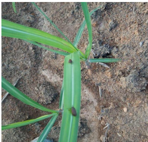
Figura 16 - Infestação de cigarrinha-das-raízes

A cigarrinha-das-raízes ( Mahanarva fimbriolata ) (Figura 16) é outra praga de relevância, especialmente em áreas conduzidas sob colheita mecanizada, em razão da maior permanência de palhada sobre o solo. Em situações que demandam intervenção, recorre-se ao controle químico, com a utilização de produtos como o Regente Duo®, aplicado no sulco de plantio ou em cobertura, conforme o estágio da cultura e o nível de infestação observado.