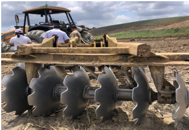
Figura 3 – Grade niveladora