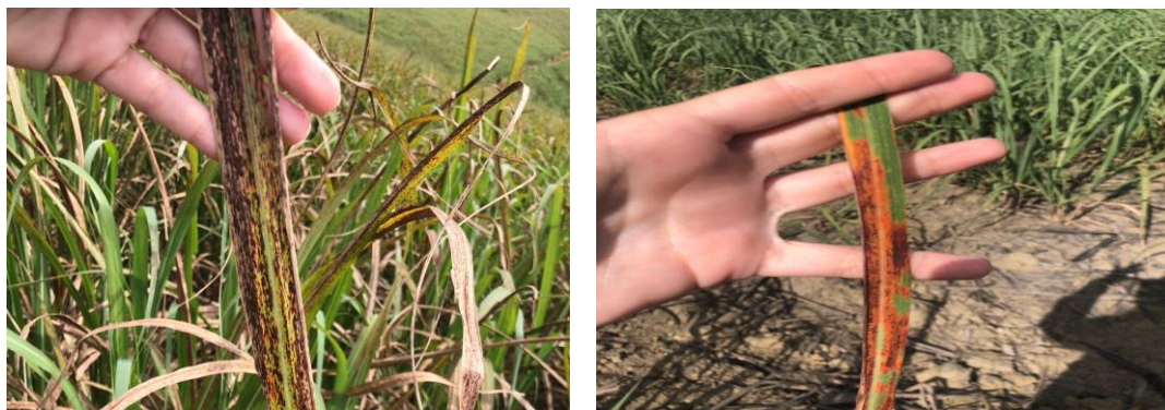
Figura 18 – a) Ferrugem marrom ( Puccinia melanocephala ) e b) Ferrugem Alaranjada ( Puccinia kuehnii )