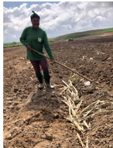
Figura 9 - Retificação de sulco de plantio