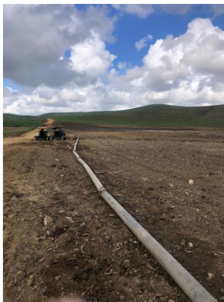
Figura 12 - Tubulação para escoamento de vinhaça