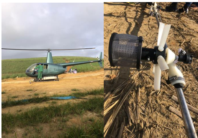
Figura 23 – a) Helicóptero acompanhado de apoio com carro pipa para abastecimento de água e prevenção a acidentes; b) Atomizador rotativo (bico de hélice) para fins de padronização do tamanho das gotas.

Os helicópteros são utilizados como plataformas móveis de alto rendimento, principalmente para a aplicação de herbicidas e maturadores (Figura 23). Equipados com tanques de 250 litros, operam com vazões ajustadas conforme o objetivo da aplicação, utilizando cerca de 25 L ha -1 em pré-emergência, 12 L ha -1 em aplicações foliares e 30 L ha -1 na aplicação de maturadores. Entre as principais vantagens desse sistema destacam-se o elevado rendimento operacional, que pode alcançar até 17 hectares por voo em aplicações foliares, e o aproveitamento da pressão aerodinâmica gerada pelas pás, favorecendo a deposição da calda no alvo. O preparo da calda é realizado diretamente no campo por meio de tanque misturador automático, garantindo homogeneidade da mistura e rapidez no abastecimento, fatores essenciais para a eficiência das operações aéreas.