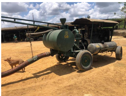
Figura 13 – Motobomba a diesel

A infraestrutura operacional que sustenta esse manejo hídrico é composta por nove eletrobombas, destinadas principalmente ao bombeamento de água para irrigação e suporte às operações agrícolas (Figura 13). Em situações de redução significativa do volume dos reservatórios, a unidade adota estratégias emergenciais, como o sistema de tapagem, que consiste na construção de barramentos manuais com o uso de sacos de areia e bambu. Essa prática permite elevar temporariamente o nível da lâmina d'água, viabilizando o funcionamento das motobombas e assegurando a continuidade das operações de irrigação e fertirrigação, mesmo sob condições hídricas adversas.