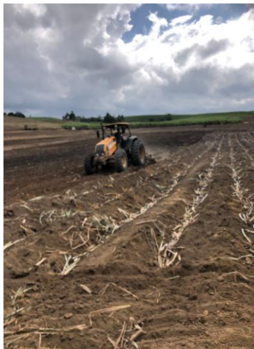
Figura 8- Fechamento do sulco

Após a distribuição da cana-semente e dos insumos, procede-se ao fechamento do sulco, etapa fundamental para assegurar o adequado contato do material propagativo com o solo e a manutenção da umidade necessária à brotação (Figura 8). Em áreas de encosta, essa operação é realizada manualmente, em função das restrições de mecanização e da necessidade de preservação do solo. Em áreas planas, o fechamento é mecanizado, com a deposição de uma camada de aproximadamente 7 a 10 cm de solo sobre os rebolos. Quando necessário, realiza-se ainda a retificação dos sulcos de plantio, corrigindo desalinhamentos e irregularidades formadas durante as operações anteriores, garantindo maior uniformidade do estande e facilitando os tratos culturais subsequentes (Figura 9).