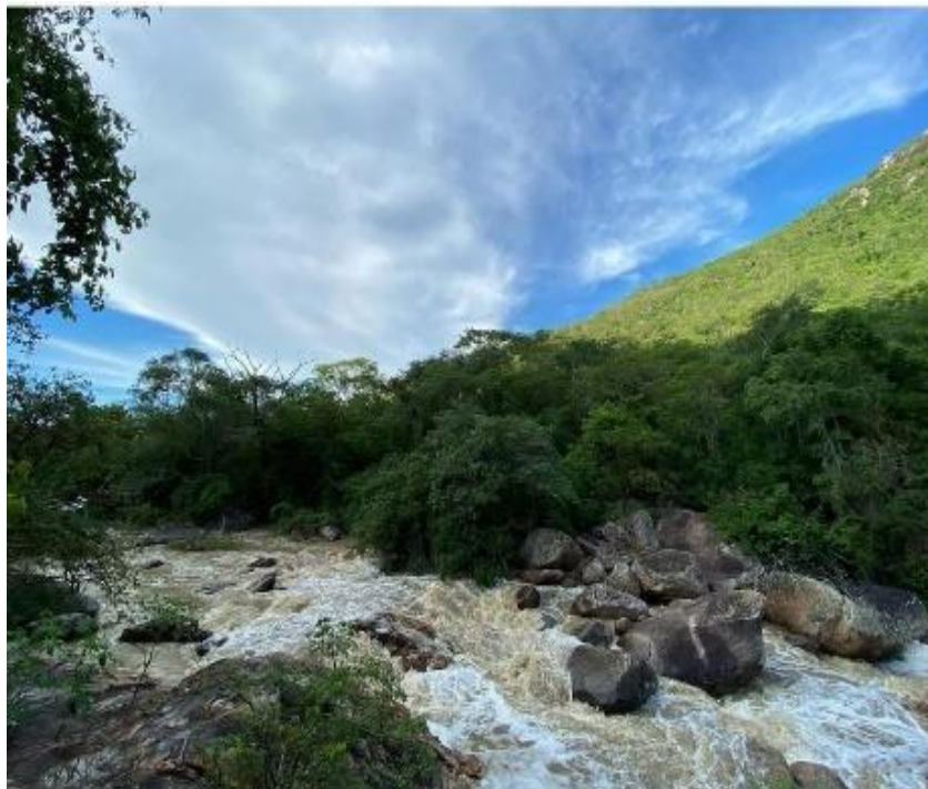
Figura 7. Rio Ipanema (Cachoeira)