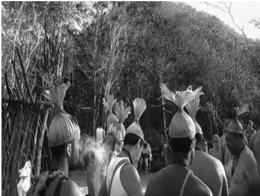
Figura 5. Indios Xukuru de Cimbres reunidos para dançar o ritual sagrado: Toré