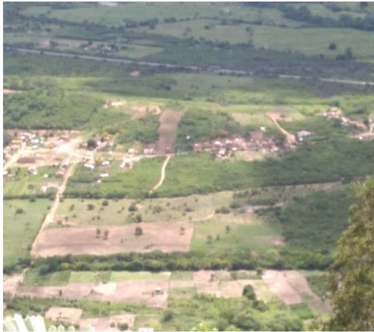
Figura 4. Vista do alto da aldeia Xukuru de Cimbres