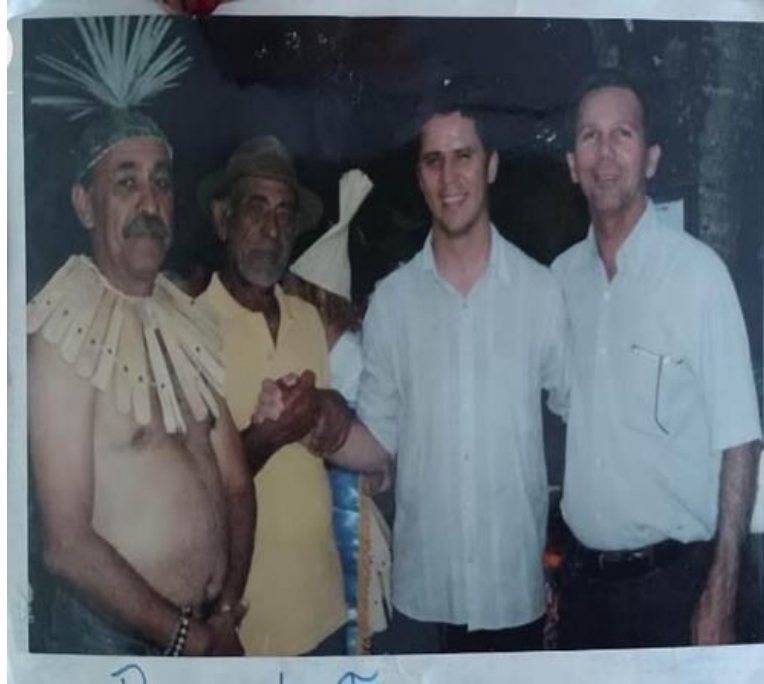
Figura 3. Momento de discussão e reconhecimento de tempos difíceis.

Ele não esqueceu daqueles que o encorajaram durante essa trajetória, nem dos que tomaram ao longo do caminho, como sua mãe, tios e amigos. Confessou que nunca pensou em desistir, embora tenha enfrentado momentos de tristeza. No entanto, a fé em Tupã e as orações da comunidade sempre o mantinham de pé.