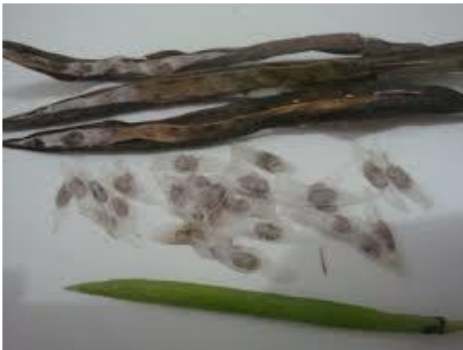
Figura 02: Frutos e sementes de Ipê Rosa ( Handroanthus heptaphyllus ).

o chão, sendo realizado, nesse caso, a retirada de impurezas para o correto armazenamento.