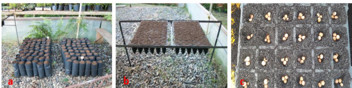
Figura 06: Recipientes utilizados na produção de mudas

eram plantadas em recipientes menores. As sementes que foram semeadas nos tubetes e nas bandejas, posteriormente, foram transplantadas para recipientes maiores.