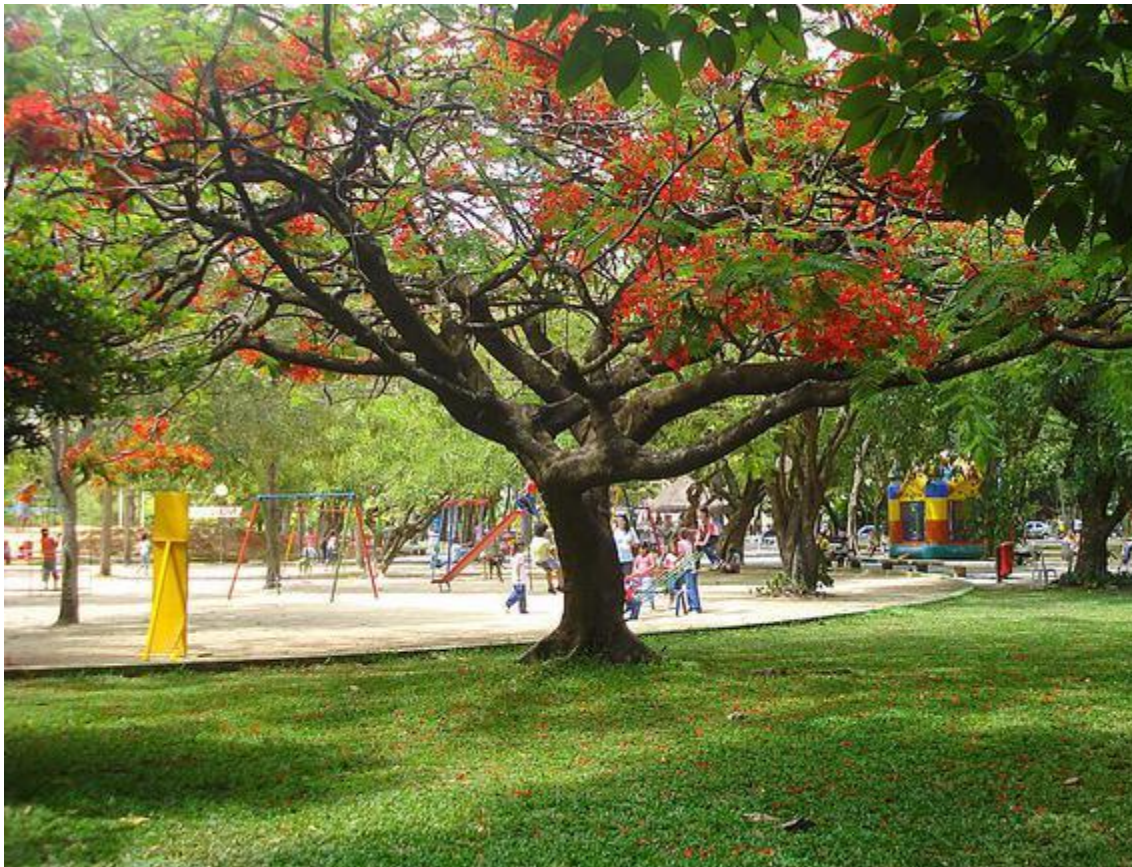
Figura 01: Flamboyant ( Delonix regia ), localizada no Parque da Jaqueira, utilizada como planta matriz.

A seleção de árvores matrizes e coleta de sementes representam a primeira ação de qualquer programa de arborização urbana, sendo fundamentais para a produção de mudas com boa qualidade genética e fenotípica. Deve-se ressaltar que qualquer equívoco cometido nestas etapas só poderá ser verificado após muito tempo, resultando no insucesso da produção das mudas e em fracasso do programa de arborização. As sementes utilizadas para a produção de mudas na Sementeira da Emlurb são oriundas de matrizes espalhadas por parques, praças e ruas, além de espécies locadas no Jardim Botânico da cidade (Figura 01).