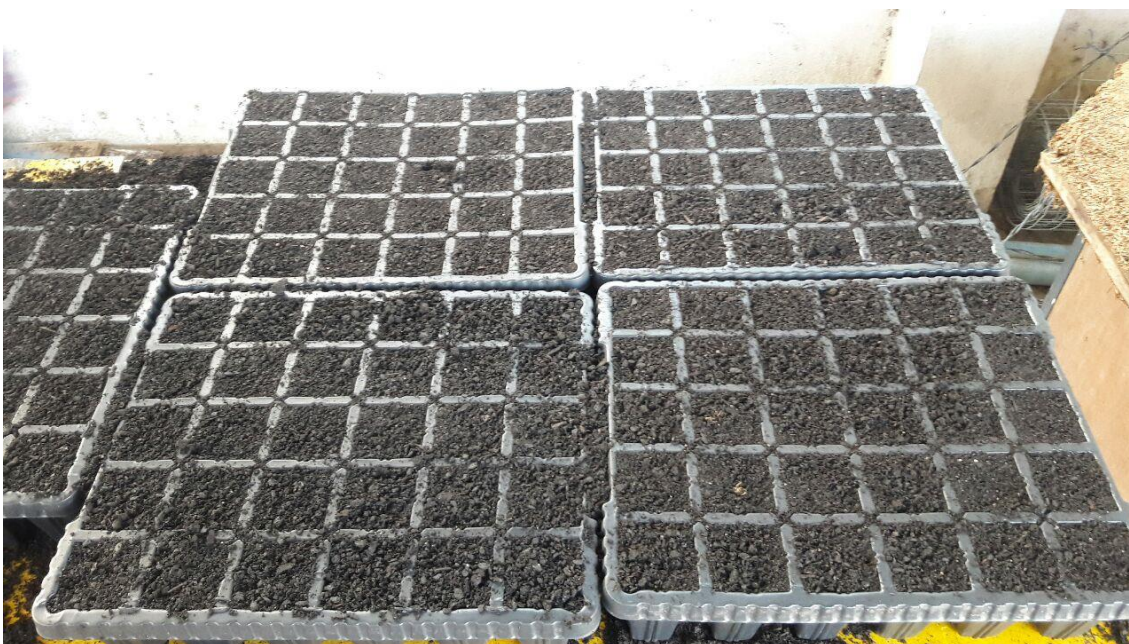
Figura 07: Método indireto de semeadura.

Na sementeira, realiza-se tanto a propagação sexuada quanto a assexuada das plantas. Na produção de mudas com a utilização de sementes, utilizou-se tanto a semeadura indireta quanto a direta. A semeadura indireta, foi realizada colocando as sementes para germinar na sementeira (Figura 07) e depois de germinadas, as mesmas foram transferidas, por meio de repicagem, para os recipientes definitivos (sacos plásticos, tubetes, vasos ou outros), onde se desenvolveram até alcançarem o tamanho ideal para o plantio. Esse tipo de semeadura foi utilizado para espécies com germinação baixa e irregular.