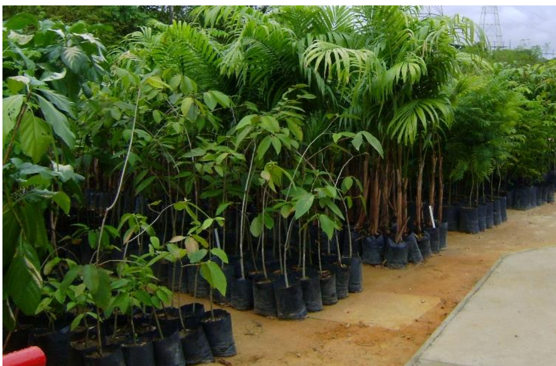
Figura 10: Mudas produzidas na Sementeira da Emlurb.

Mudas produzidas com a finalidade de serem utilizadas para a arborização urbana são manejadas de forma diferente de mudas utilizadas em projetos de reflorestamento, isso se deve ao fato de que as mudas devem compor a paisagem urbana, levando em consideração sua interação com a cidade. As mudas foram manejadas de modo que sua estrutura morfológica não interfira na condução de pessoas e veículos nas ruas. Utilizou-se para isso a realização de podas de formação, visando aumentar ao máximo possível a altura de fuste das plantas (Figura 10).