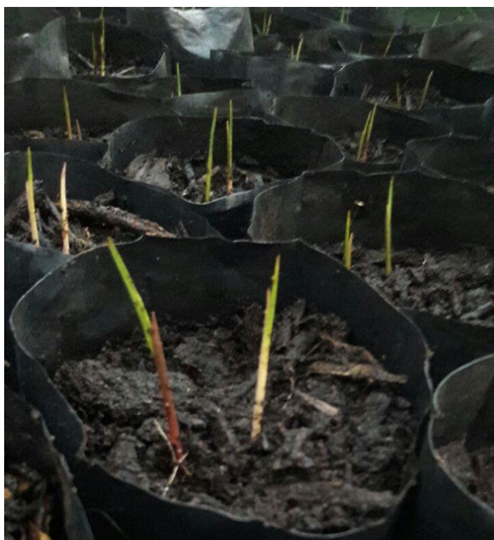
Figura 08: Germinação de sementes em sacos de polietileno.

Em geral, as sementes foram colocadas para germinar numa profundidade que variava de 0,5 cm a 3,0 cm, dependendo do tamanho de cada uma delas. Utilizou-se mais de uma semente por recipiente, visando garantir com isso a presença de pelo menos uma muda por recipiente. Quando mais de uma semente germinava por recipiente (Figura 08), fazia-se o desbaste ou o também chamado raleio, deixando apenas uma muda por recipiente. Na seleção da plântula a ser mantida, optou-se pela visualmente mais vigorosa e sadia e ainda por aquela que estivesse mais próxima do centro do recipiente.