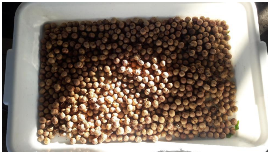
Figura 03: Sementes de açai ( Euterpe oleracea ), após o beneficiamento.

separação utilizadas no beneficiamento foram: tamanho, textura, cor, sanidade, densidade, forma, etc.