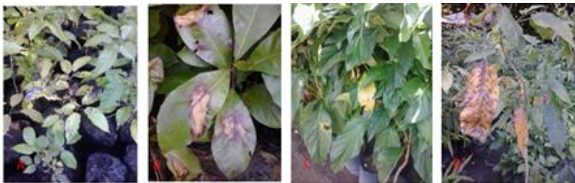
Figura 11: Sintomas foliares observados nas mudas: A - Tabebuia chrysotricha ; B - Terminalia catappa ; C - Morinda citrifolia ; D - Clitoria fairchildiana na sementeira da Emlurb.

Durante o decorrer do estágio, observou-se a presença de sintomas de doenças e injurias causadas por insetos (Figura 11), foi observado a presença de folhas murchas, amarelas ou cortadas, inicialmente foi realizado a redução do sombreamento e da irrigação. Quando não foi suficiente, realizou-se a pulverização com fungicida. No caso de pragas, como pulgões, formigas, paquinhos, cupins, besouros, grilos, lagartas, utilizou-se o controle mecânico e químico. Em relação às ervas daninhas, o controle foi feito em todo o viveiro, e não somente nos canteiros. O controle foi feito manualmente por arrancamento ou, em algumas ocasiões, com o uso de herbicidas.