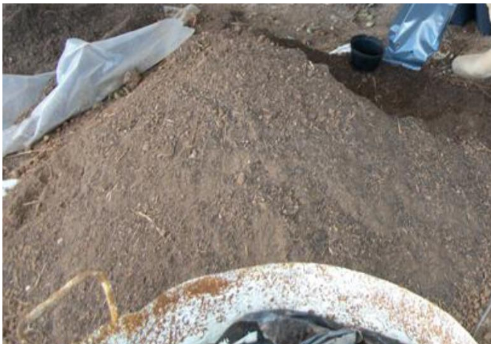
Figura 05: Substrato orgânico utilizado na produção das mudas.

Na Sementeira, as formulações de substratos utilizados na produção de mudas na empresa são todas de origem orgânica (Figura 05). Esses substratos são produzidos à base de casca de arroz carbonizada, húmus, compostagem e solo, variando a porcentagem de cada componente para mudas nativas arbóreas e mudas ornamentais. Dentre as técnicas de reaproveitamento de resíduos orgânicos a compostagem é uma das mais eficazes. O processo possibilita a transformação de resíduos orgânicos em um produto com potencial fertilizante para as plantas (Araújo, 2010).