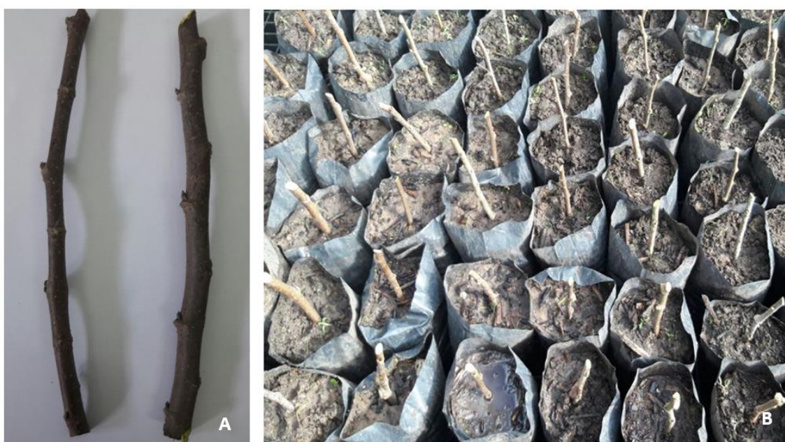
Figura 09: A - Estacas de Morus nigra , B - Plantio de Morus nigra .

Realizou-se a propagação por meio de estaquia, principalmente de espécies arbustivas, como a aceroleira, a amoreira, a seriguela, dentre outras. Para isso, procedeu-se com a identificação das plantas matrizes, posteriormente, as estacas lenhosas foram retiradas de ramos com cerca de seis meses da última poda, com diâmetro entre 1,5 a 2,0cm, padronizadas entre 25 a 30cm de comprimento, sem folhas, com a extremidade inferior da estaca cortada em bisel (figura 09 a). Após o preparo, as estacas foram plantadas em sacos para mudas, (12cm x 20cm), contendo substrato com 50% de solo e 50% de substrato orgânico, enterrou-se a parte inferior das estacas no substrato, deixando-se duas ou três gemas para fora (figura 09 b).