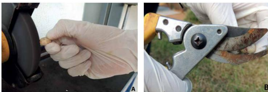
Figura 04: Realização de quebra de dormência em sementes.

Muitas sementes florestais apresentam dormência, trata-se de um impedimento do processo inicial de germinação causado por fatores mecânicos, químicos e (ou) fisiológicos. Para germinar, as sementes precisam de condições que podem variar de espécie para espécie. Para a realização da quebra de dormência das sementes (Figura 04) utilizadas na Sementeira, foram utilizadas escarificações mecânicas, corte do tegumento e tratamentos com água quente.