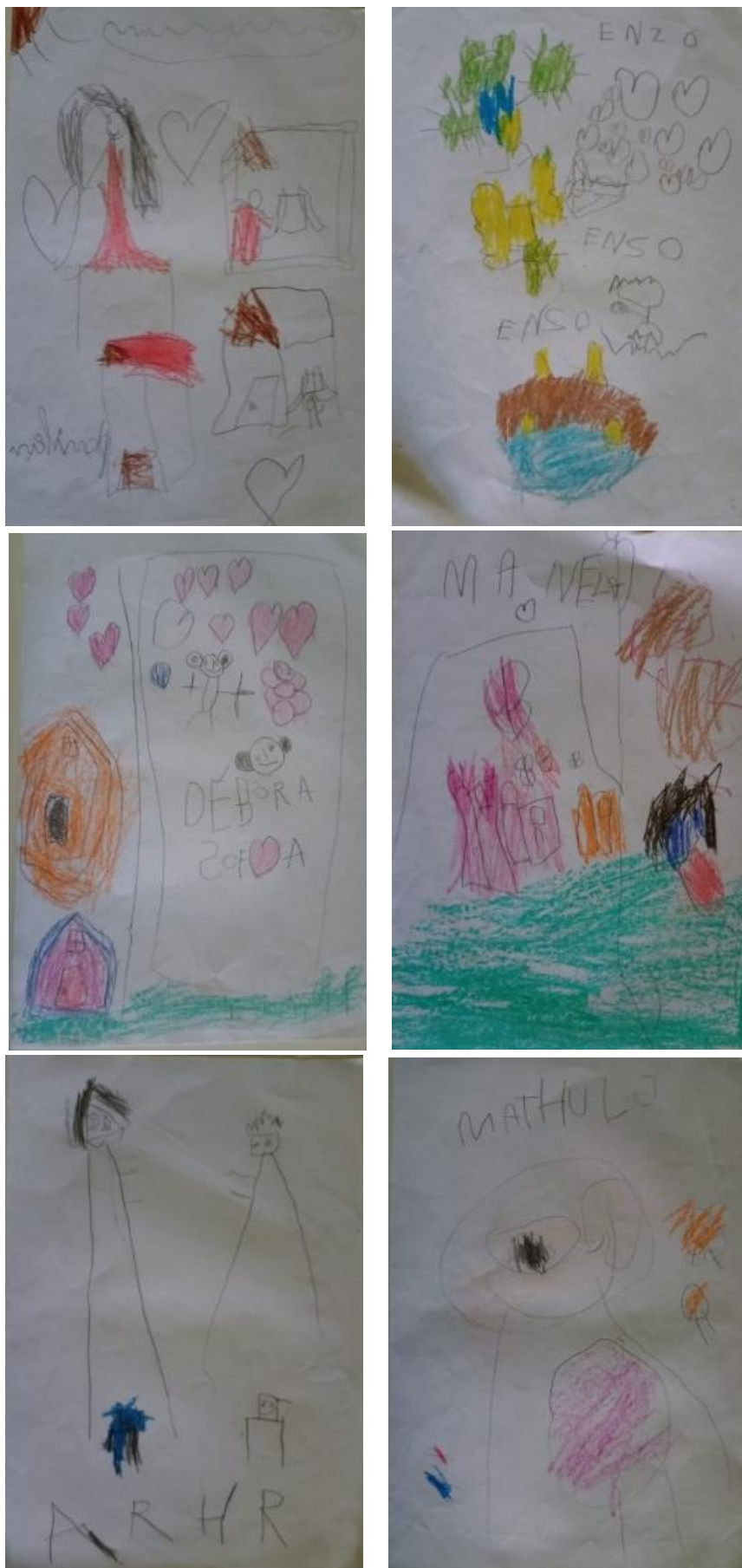
Figura 7: Fase pré-esquematismo