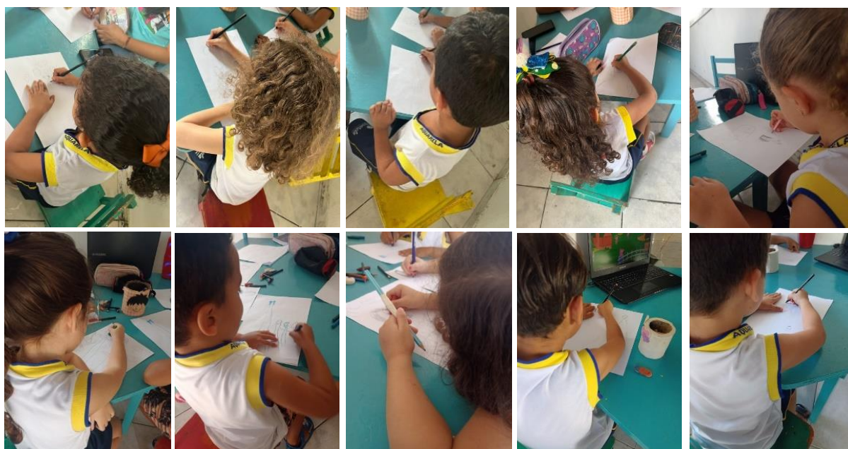
Figura 2: As crianças criando seus grafismos

As artes visuais precisam ser vivenciadas desde a infância, pois será fundamental e essencial para que as crianças desenvolvam os conhecimentos, a importância da imagem, de uma comunicação não verbal, desenvolva sua capacidade de representar objetos por meio de símbolo e signo, se descobrir como ser ativo na sociedade, capaz de realizar suas próprias criações (as garatujas são expressões artísticas da criança) além de conhecer a importância da cultura e aprender a valorizá-la.