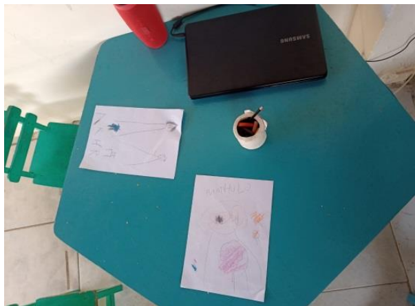
Figura 5: Grupo C

Foi interessante observar que as crianças já sabiam dar nomes às suas garatujas, quando afirmavam: “Esse é o lobo mau”, “Essa é a mamãe porquinho” “Isso é a casa de palha, a casa de tijolo, a casa de madeira”, “Esses são os 3 porquinhos”, etc., onde surgiram círculos e várias formas.