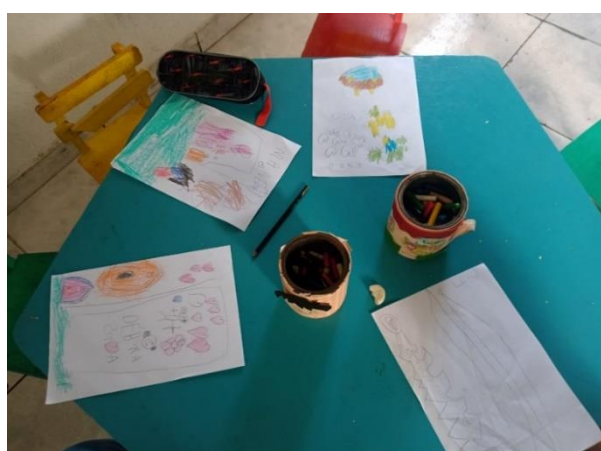
Figura 3: Grupo A

A seguir temos as imagens das 10 (dez) garatujas criadas pelas crianças, enquanto forma de expressão na Educação Infantil III, as quais foram desenvolvidas com base no conto infantil, Os 3 Porquinhos .