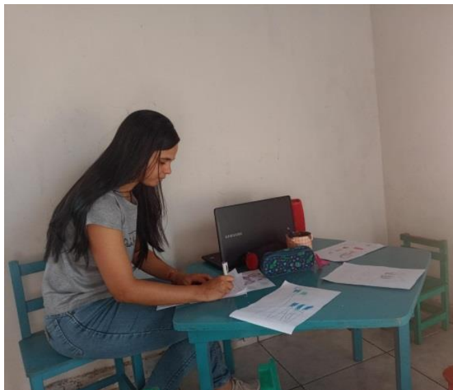
Figura 9: Analisando as garatujas