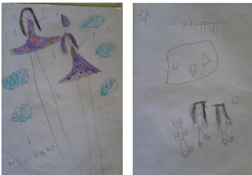
Figura 8: Fase esquematismo

Ambas as crianças têm 5 anos de idade, são do sexo feminino e do grupo B, as quais de acordo com Piaget pela idade estão no período pré-operatório (2-7 anos de idade), porém analisando os seus registros gráficos que estão na fase do esquematismo correspondente aos 7-10 anos de idade. Desenharam com conceitos definidos em relação ao desenho humano, porém é notável a presença do exagero (tamanhos das pernas, noções espaciais) características presente nesta fase, enquanto desenhavam elas buscavam retratar a semelhança, comparando por exemplo o tamanho dos cabelos representados em seus grafismos, ou seja, crianças com noção e percepção.