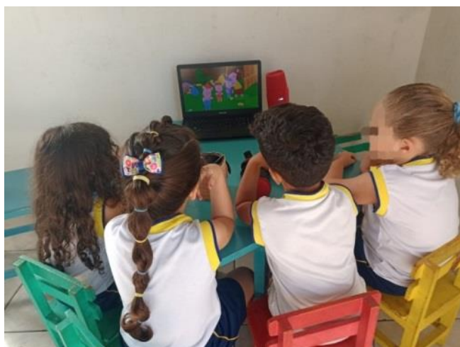
Figura 1: Assistindo a história Os 3 Porquinhos

Desde o princípio da pesquisa foi bastante perceptível que os alunos tinham uma grande conexão com o desenho, pois eles pediam e perguntavam sempre se iam desenhar, já ditavam o que pretendiam desenhar, parecendo ser algo prazeroso para eles.