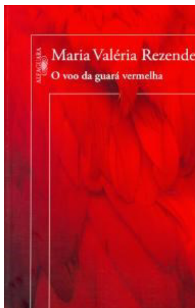
Figura 1 - Capa do livro o voo da guará vermelha , Alfaguara, 2014.

Na capa produzida pela editora Alfaguara/Objetiva, publicada no 2014, em sua 2ª edição, têm-se a ilustração com imagens de penas que transitam entre as cores, encarnado e vermelho, remetendo a uma ave. Neste caso, o nome da autora Maria Valéria Rezende está posicionado na parte superior do livro e abaixo dele o título O voo da guará vermelha com a fonte em branco, gera um contraste significativo com o fundo vermelho. Posicionada na cor branca nos leva a querer saber quem é essa guará vermelha. Observemos a imagem abaixo ao termos na capa do livro elementos coloridos avista-se algumas características em seu design.