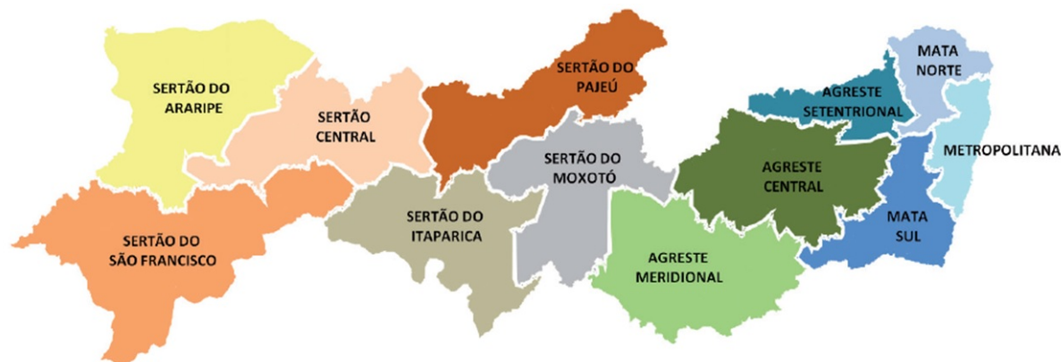
Figura 2 – Mapa das regiões de desenvolvimento (RD) de Pernambuco