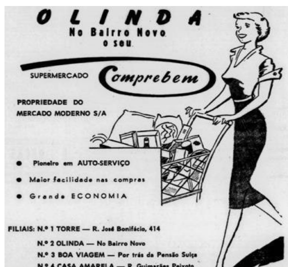
Imagem 2 - Trecho de Jornal “Anúncio do Supermercado Comprebem”