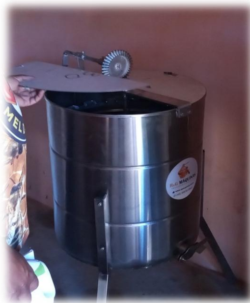
Figura 7 - Centrífuga para extração e limpeza do mel