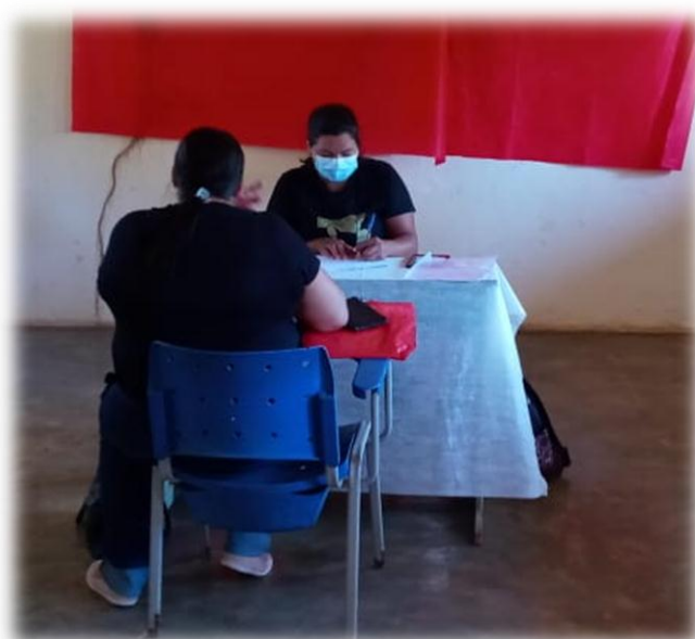
Figura 10 - Entrevista

As entrevistas ocorreram nas associações de cada comunidade que foram agendadas previamente, onde o extensionista realizava as perguntas presentes no questionário da DAP para os agricultores, e eu estagiária, o auxiliava na triagem dos documentos necessários para a realização da DAP e também realizei algumas entrevistas (Figura 10).