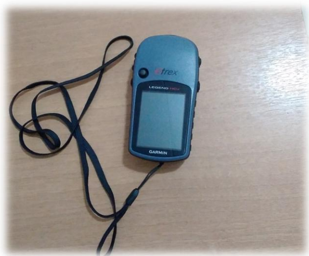
Figura 3- GPS utilizado da marca ETREX Garmin

As inscrições para o Garantia Safra são realizadas nas associações de cada comunidade rural assistida pelo órgão de Ater, mediante o fornecimento dos dados básicos do agricultor (nome, CPF, RG, endereço, apelido, sua área de plantio e as culturas plantadas, estado civil, se casado/a, fornecer os dados do conjugue), após o preenchimento de todos esses dados, a mesma deve ser entregue no Conselho Municipal de Desenvolvimento e no órgão autorizado para a realização da inscrição do Garantia Safra, no caso o IPA que realiza essas inscrições por meio do sistema DAPWeb.