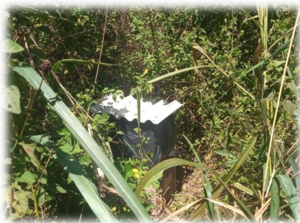
Figura 5 – Caixas iscas para a captura das abelhas

O produtor se identificou com a criação de abelhas migratórias e a partir do ano de 2021, quando começou com apenas uma caixa e, atualmente possui 17 caixas iscas espalhadas em sua propriedade, o qual produz mel, cera e própolis. As abelhas são atraídas por um feromônio produzido por ele mesmo em sua propriedade (Figura 5).