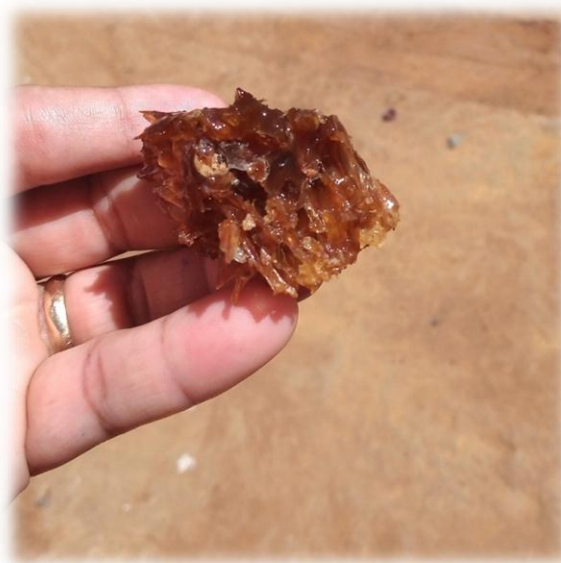
Figura 8 – Favo de mel

Atualmente ele faz parte da Associação de Apicultores em serra Talhada e pretende certificar seu produto com o selo da agricultura familiar para facilitar a comercialização de seu mel.