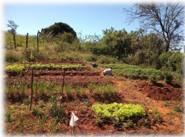
Figura 6 – Horta para consumo familiar

já o mel é comercializado no Rio de Janeiro a R$ 50,00 o litro, devido a quantidade ainda ser pouca o produtor não comercializa o mel o ano todo, ele também possui uma centrífuga (Figura 7) para que não haja contato manual com o mel extraído evitando a contaminação do mesmo, e a produção de cera fica por conta de sua esposa.