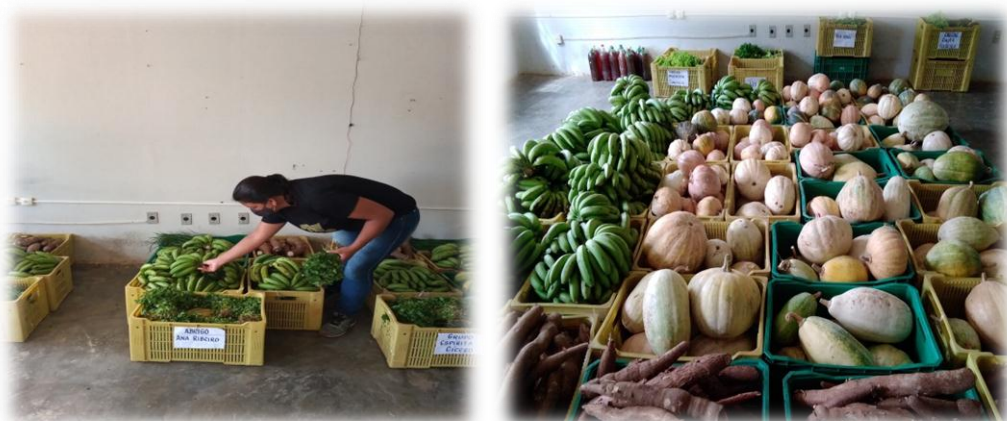
Figura 4– Recebimento de alimentos do programa PAB, no município de Serra Talhada.

Inicialmente era realizada a pesagem de cada alimento, logo depois anotado, finalizada esta etapa, era executada a separação desses alimentos para cada instituição que era atendida pelo programa, nessa divisão era levada em consideração a quantidade de beneficiários em cada instituição (Figura 4).