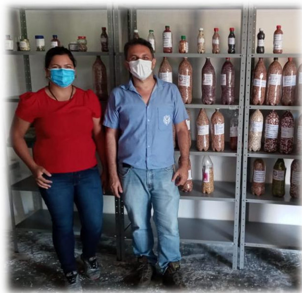
Figura 18 – Banco de sementes da Associação Mulher Flor do Campo