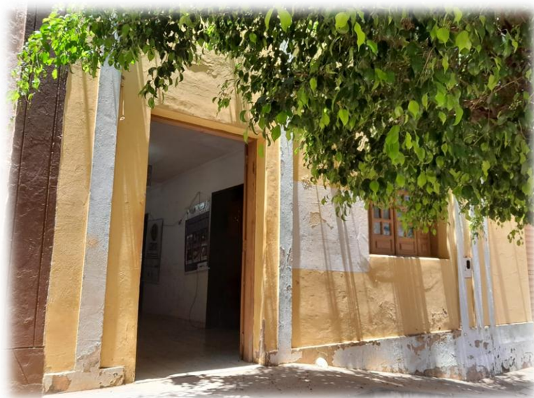
Figura 1 – Escritório do IPA em Santa Cruz da Baixa Verde

O escritório funciona na Rua Santa Luzia, nº76, no Centro da cidade, onde era o antigo CRAS, em um local de fácil acesso às pessoas (Figura 1).