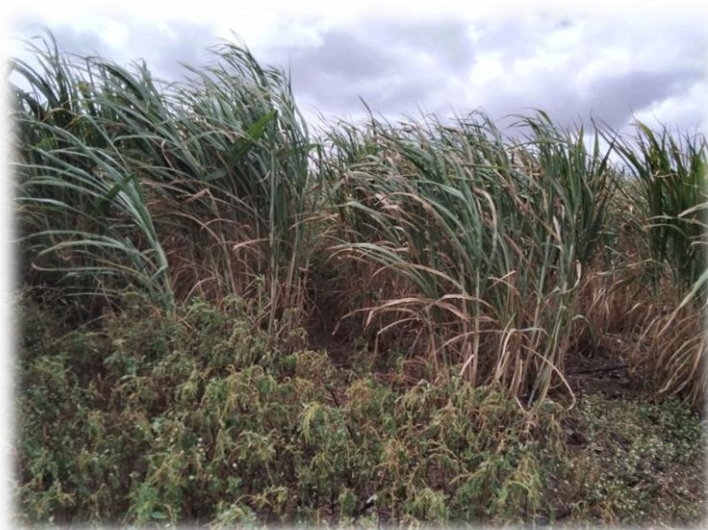
Figura 15– Capim de elefante para silagem dos bovinos

Na propriedade também há um curtume, atividade de onde vem o sustento do filho (Sormano) que administra o negócio.