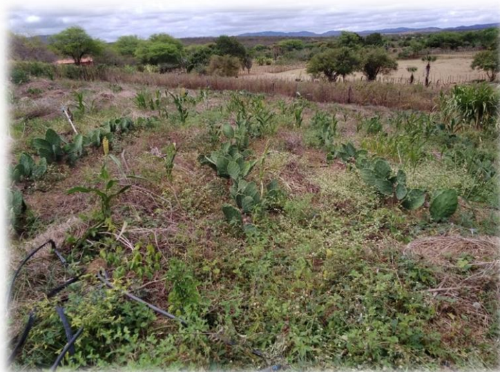
Figura 14 - plantio de palma forrageira