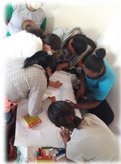
Figura 17– Construção do Diagnóstico Rural Rápido Participativo-DRP

As atividades foram realizadas com a elaboração de um Diagnóstico Rápido Participativo – DRP onde foi feito o levantamento de informações da realidade da comunidade através de desenho de um mapa coletivo da comunidade, construído a partir do ponto de vista de seus membros, onde foram vistos as riquezas que possuía e também as dificuldades enfrentadas, e as políticas públicas que foram feitas na comunidade para a convivência com a seca e as adversidades climáticas enfrentadas na região (Figura 17).