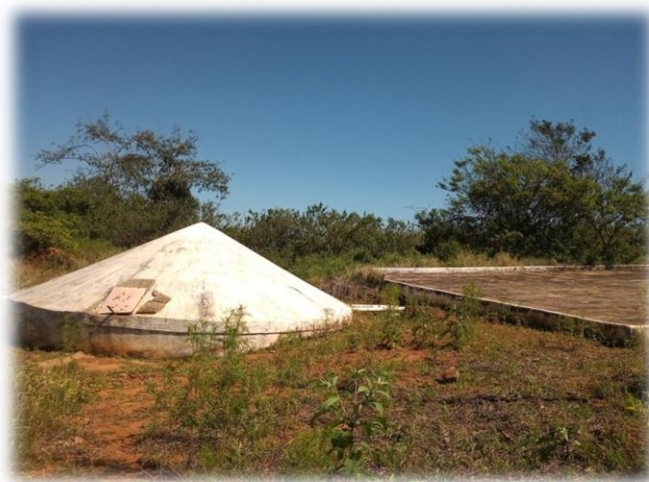
Figura 9 – Cisterna Calçadão de 52.000 litros

Onde também foi beneficiado com uma cisterna calçadão de 52.000 litros pelo Projeto Dom Hélder Câmara para ajudar na produção para a família (Figura 9).