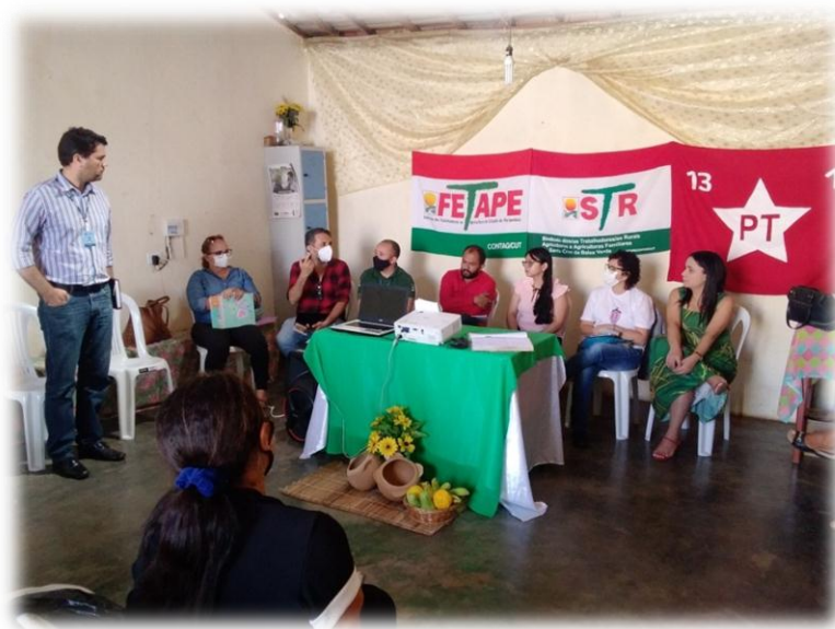
Figura 16- Reunião Conselho Municipal de Desenvolvimento Rural Sustentável de Santa Cruz da Baixa Verde – Condessc

Teve também uma breve fala sobre o Agosto Lilás, que é o mês de conscientização sobre a não violência contra a mulher contando com a presença da coordenadora da Secretaria da Mulher de Santa Cruz da Baixa Verde, e com a apresentação do aplicativo Lamparina, coordenado pela professora da Unidade Acadêmica de Serra Talhada, financiado pela Facepe para trazer luz contra a violência á mulher de Pernambuco, o projeto está sendo apresentado através das comunidades rurais (Figura 16).