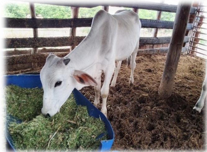
Figura 13- Criação de bovinos em confinamento