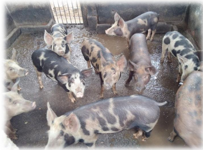
Figura 12 - Criação de Suínos