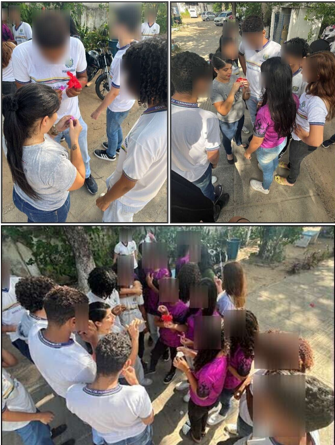
Figura 2. Atividade prática nos arredores da escola.

morcegos, vento, entre outros). Foram mostradas as estruturas reprodutivas em vários tipos de flores e solicitado que analisassem as características florais e tentassem relacionar com as síndromes de polinização. O envolvimento dos alunos foi notório, e muitos demonstraram curiosidade em compreender a diversidade morfológica das flores e suas adaptações aos diferentes tipos de polinizadores.