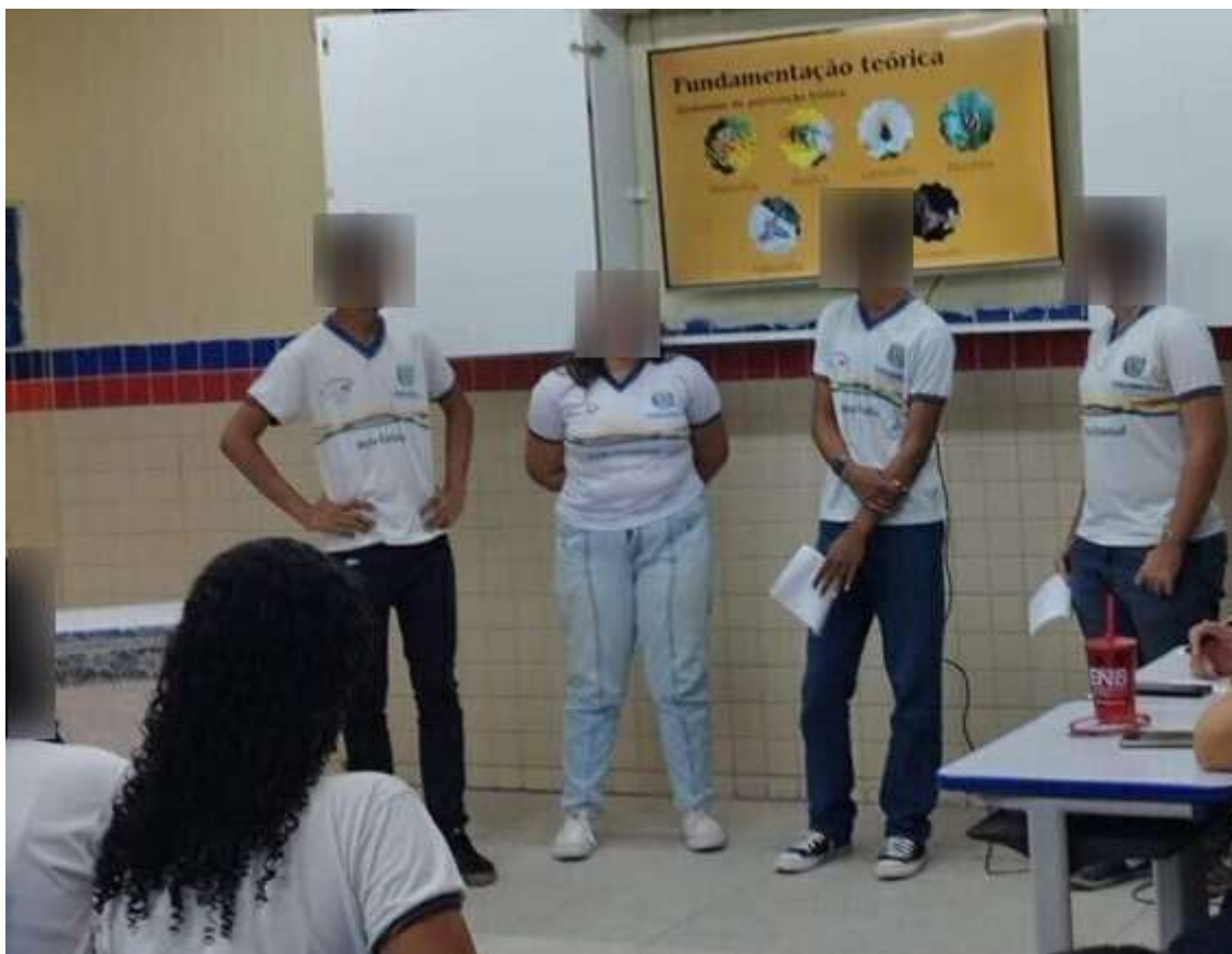
Figura 5. Socialização das produções digitais.

Cada grupo ficou responsável por explorar um subtema, como: polinizadores e suas adaptações biológicas; polinização e produção de alimentos; ameaças ambientais aos polinizadores; e estratégias de conservação e sustentabilidade.