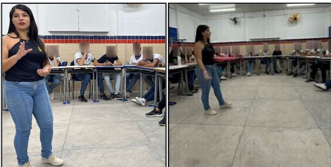
Figura 1. Momentos de exposição dialogada com os estudantes.

No primeiro momento, os alunos participaram de uma exposição dialogada sobre o conceito de polinização, seus agentes e a importância ecológica e econômica do processo (Figura 1). A aula incluiu o uso de recursos audiovisuais (apresentação de slides, vídeos e infográficos e debates mediados pelos professores). Essa abordagem permitiu contextualizar o tema com exemplos do cotidiano, como a produção de frutas, hortaliças e oleaginosas dependentes da polinização. Também foram discutidos os impactos das atividades humanas sobre os polinizadores, como o uso de agrotóxicos, desmatamento e mudanças climáticas, e as consequências ecológicas e socioeconômicas dessas ações. Essa abordagem crítica buscou estimular a consciência ambiental e preparar o terreno para as etapas investigativas subsequentes.